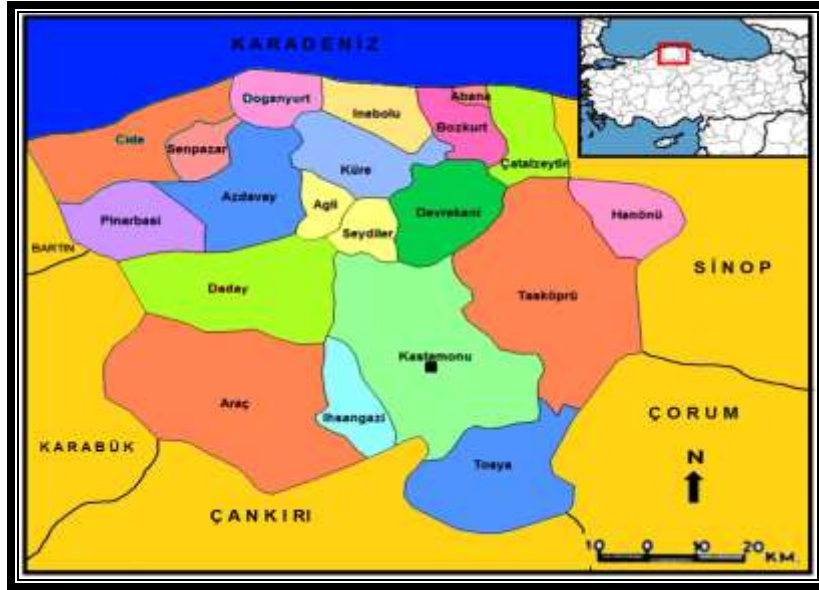
Şekil 1: Kastamonu ili ve ilçeleri

Kastamonu Karadeniz bölgesinin, batı Karadeniz bölümünde bulunmaktadır. Kuzey Anadolu'nun Karadeniz'e doğru meydana getirdiği büyük çıkıntının geniş bir kısmını kaplamaktadır (Kastamonu İl Yıllığı, 1973,61). Doğusunda Sinop ve Çorum, batısında Bartın ve Karabük, güneyinde Çankırı, kuzeyinde ise Karadeniz bulunmaktadır.140 km lik sahile sahiptir (Şekil 1). Toprak genişliği bakımından komşu illerin en büyüğüdür. Toprak genişliği 13.108 km 2 dir. İl yüzölçümünün %74,6'sı dağlarla, %21,6'sı platolarla ve sadece %3,8'i de ovalarla kaplıdır (İbret,2001, 434).