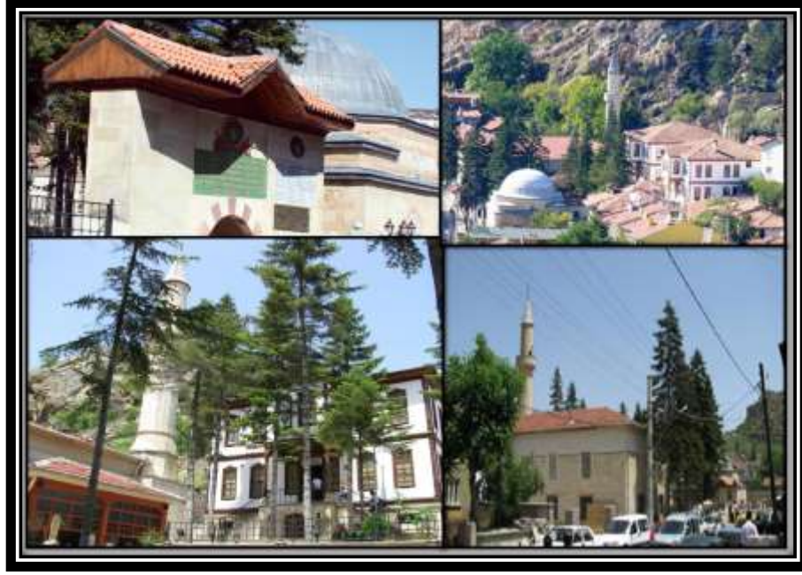
Fotoğraf 1: Şeyh Şaban-ı Veli (Hz. Pir) Külliyesinden bazı görüntüler

Şeyh Şaban-ı Veli külliyesi içerisinde bulunan yapılar büyük ölçüde 1450-1650 yılları arasında yapılmıştır. Külliye içerisindeki cami ilk olarak Seyyid Sünneti Efendi (ö.1469) tarafından yaptırılmış, bugünkü durumuna 1580 yılında getirilmiştir. Yapımında kesme ve moloz taş, taban ve tavanında ahşap kullanılmıştır, caminin en dikkat çeken özelliği külliyenin halveti dergahı olmasından dolayı arka kısımda yer alan halvet odalarıdır. Türbe, Şeyh Şaban-ı Veli'nin vefatından 7 yıl sonra başlanmasına rağmen çeşitli nedenlerle yapımı 1615 tarihinde tamamlanabilmiştir. Türbe kesme taştan, kare planlı ve tek kubbeli olarak inşa edilmiştir, içinde 16 ahşap sanduka bulunmakta bunlardan ortada bulunan büyük olanı Şeyh Şaban-ı Veli'ye aittir. (Çifci, 2006, 27-34). Türbenin yanında bulunan asa suyu hem tat hem de kokusu “zemzem” suyuna benzediğinden dolayı, halk tarafından şifalı olarak kabul edilmektedir.