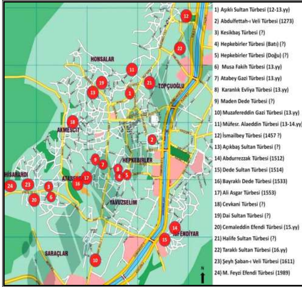
Şekil 3: Kastamonu Şehrindeki bazı türbeler

Çobanoğlu ve diğer beylikler devrinde defnedilen hükümdar, devlet adamı, ilim erbabı ve velilerin kabirleri (Yakupoğlu, 2009, 508). Şehrin muhtelif alanlarında bulunmakta ve çok sayıda yerli ve yabancı turist buraları ziyaret etmektedir. Kastamonu şehrinde bulunan belli başlı türbeler, dönemlerine göre aşağıdaki tabloda verilmiş ve şekilde de gösterilmiştir.( Tablo.4), (Şekil.3).