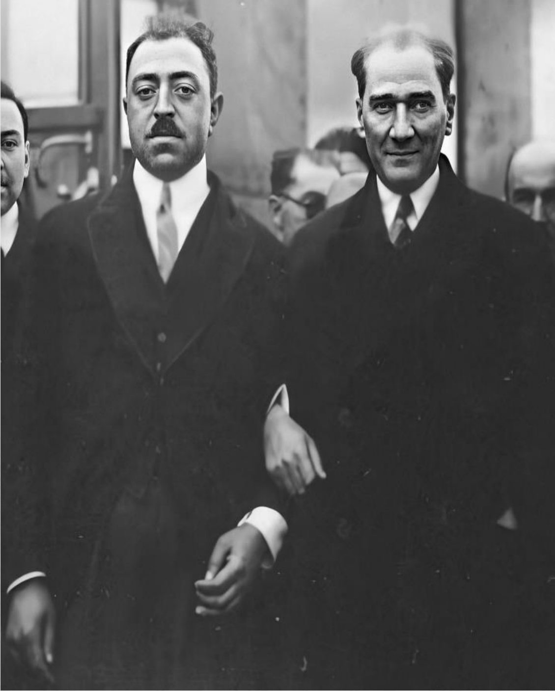
Ek 2: Atatürk ve Amanullah Han Ankara 1928. ( https://onedio.com/haber/bir-zamanlar-afganistan-ataturk-ve-amanullah-han-998030 ).