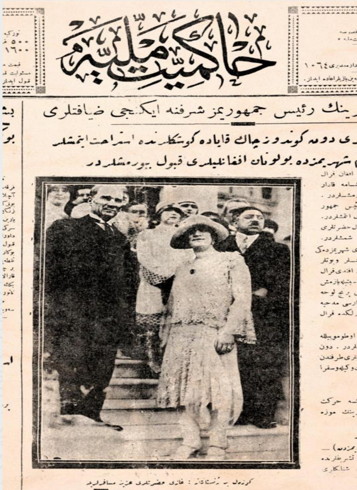
Ek 7: 24 Mayıs 1928 tarihli Hâkimiyet-i Milliye gazetesinde yayımlanan haber. Afganistan Kral ve Kraliçesi Ankara ziyareti haberinde yer alan fotoğrafın altındaki yazı: "Güzel bir enstantane: Gazi Hazretleri aziz misafirleriyle" Hakimiyet-i Milliye Gazetesi, 24 Mayıs 1928, s. 1.