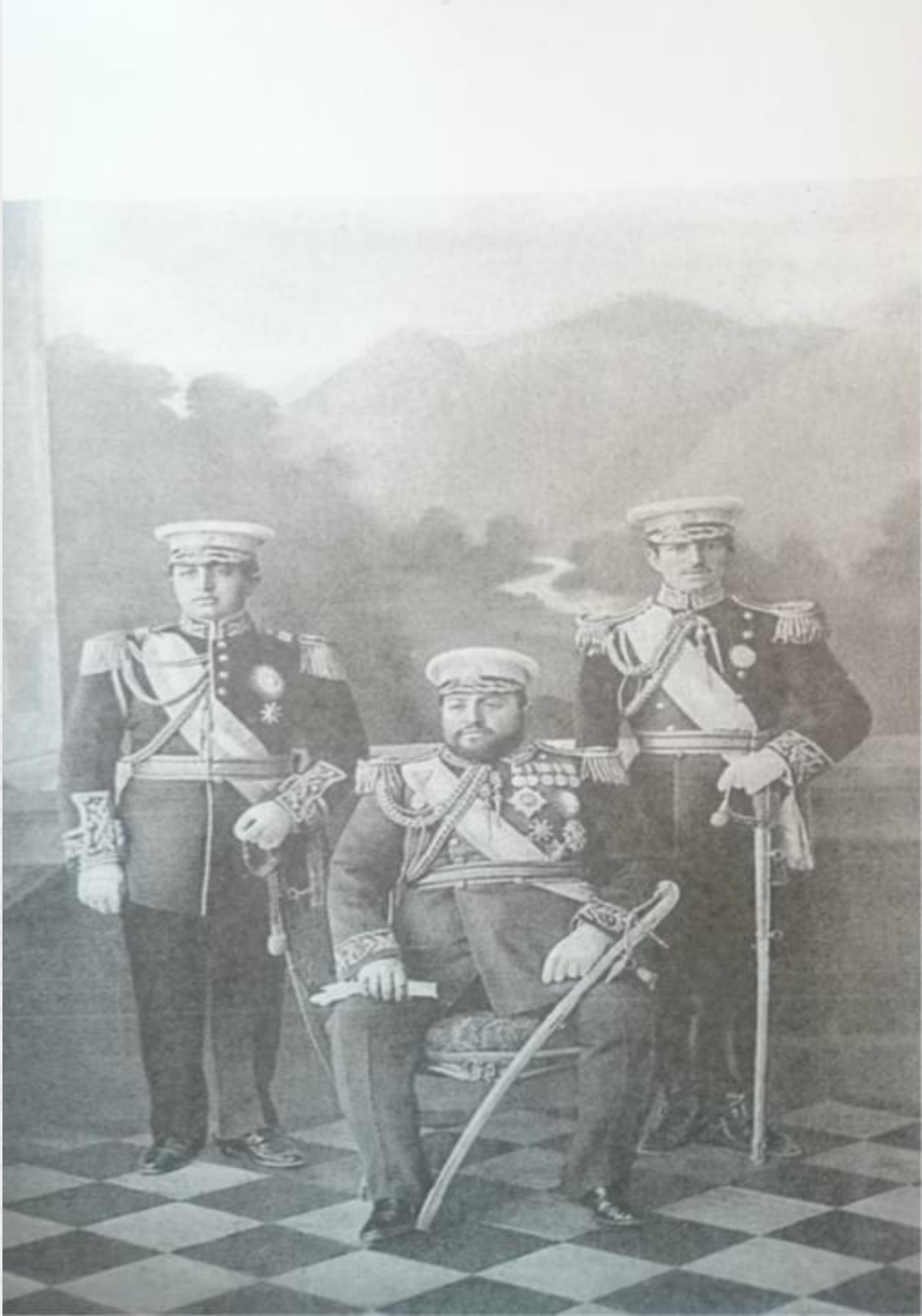
Ek 1: Emir Habibullah Han, solunda Amanullah Han, sağında İnyetullah Han. (Niedermayer, 1924, s. 38).