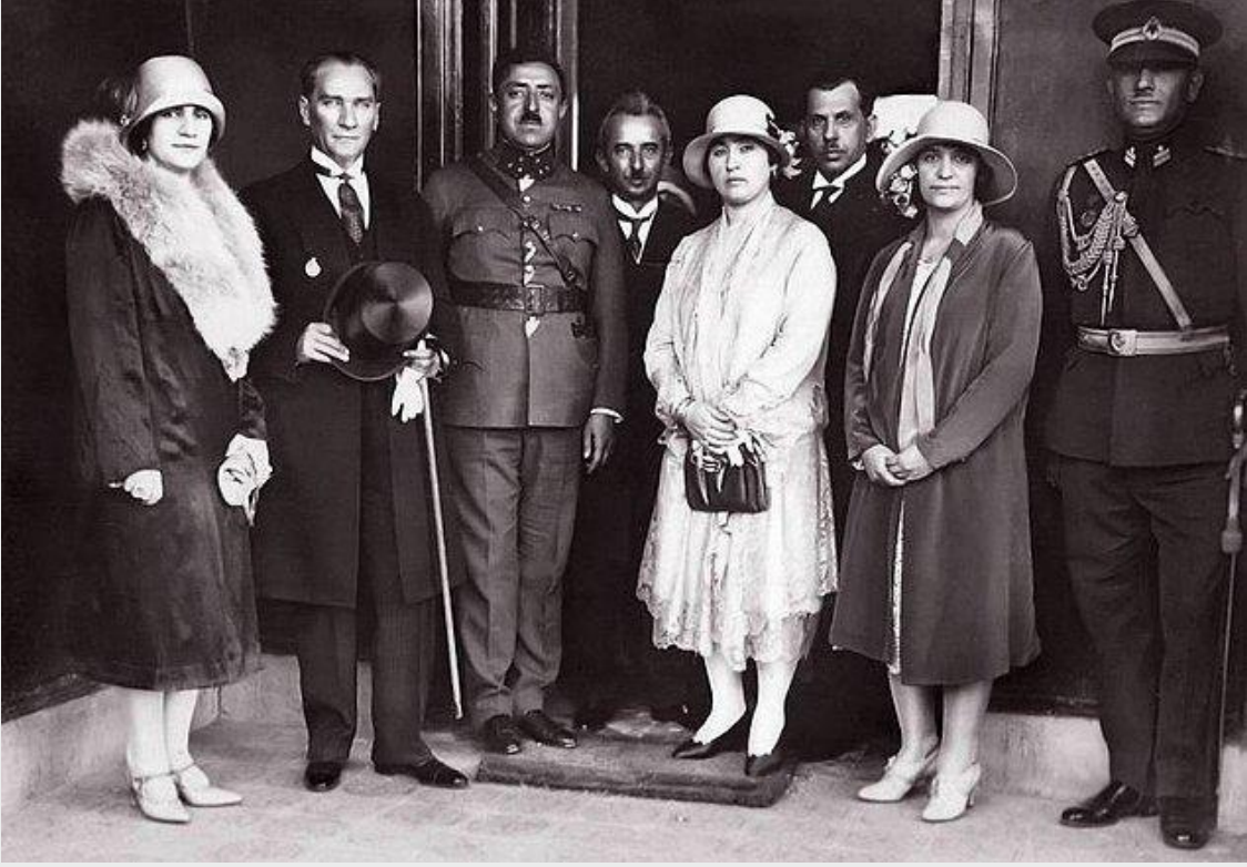
Ek 3: Amanullah Han ve Kraliçe Süreyyâ'nın Atatürk Ziyaretinden. ( https://onedio.com/haber/bir-zamanlar-afganistan-ataturk-ve-amanullah-han-998030 ).