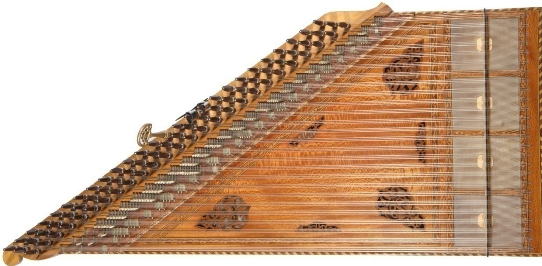
Şekil 1.1. Kanun Resmi

Günümüzde kanun sazı, başta Göksel Baktagir, Tahir Aydoğdu, Hakan Güngör, Ahmet Meter gibi kanun sanatçılarımız sayesinde dünyada rağbet gören sazlarımız arasında birinci sırada gelir.