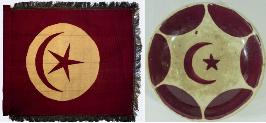
Görsel 6: 18. yy. sonu 19. yy. başı Osmanlı bayrağı (Metropolitan Müzesi) ve Ay-yıldız motifinin görüldüğü porselen tabak.

belgeler, bu motifin bayraklarda kullanımını 16. yüzyıla kadar indirmektedir. Bu motif, III. Mustafa döneminde (1757-1774) devletin sembolü olarak kabul edilmeye başlamıştır. I. Abdülhamid (1774-1789) ve III. Selim (1789-1807) döneminde çıkarılan kanun ile ay-yıldız sembolü resmiyet kazanmıştır. Böylece Avrupa'da 15. yüzyıldan itibaren Osmanlı padişahlarının arması olarak tanınan hilalin yanına yıldız eklenerek III. Selim döneminde ilk kez resmi devlet alameti olarak kullanılmıştır 6 . Dolayısıyla ay-yıldız motifi Osmanlı pazarı için üretim yapan üreticilerin odak noktası olmuş, (Görsel 6) Avrupa'da Osmanlı beğenisine sunulmak için üretilen porselen tasarımlarında, ay-yıldız motifi bu tasarımların vazgeçilmez bir öğesi olmuştur. Çalışmaya konu olan porselen eserler de bunun önemli göstergelerindedir.