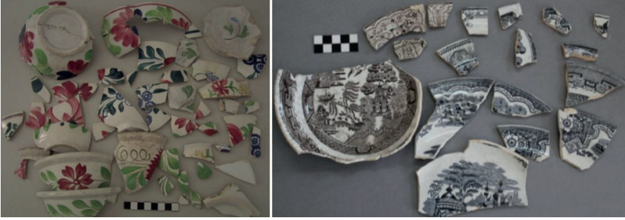
Görsel 2: İngiltere'den ithal edilen porselen örnekleri.