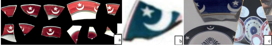
Görsel 7: a- Smyrna Agorası Kazısı Sarreguemines üretimi Ay yıldızlı porcelen tabak örneği; b- Beyrut Kazısı Sarreguemines üretimi Ay yıldızlı porcelen tabak örneği; c- Stratonikeia örneği.