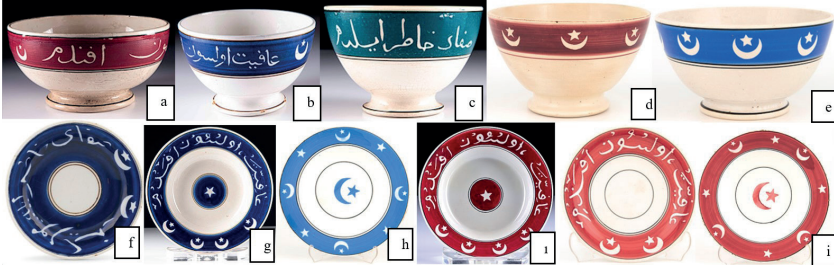
Görsel 9: Müzayedelerde satışa sunulan ay yıldızlı porcelenlere örnekler.