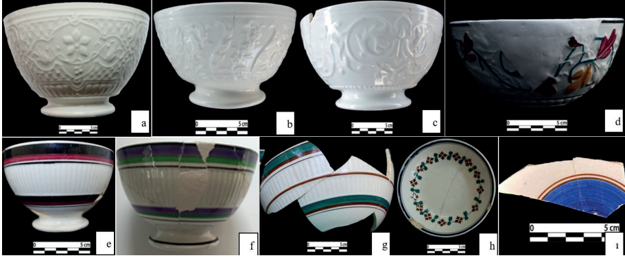
Görsel 3: Opaque de Sarreguemines damgasının görüldüğü porselen örnekleri.