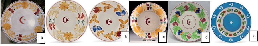
Görsel 10: Hand-painted tekniği ile bezenmiş ay yıldızlı porselen örnekleri.

Müzayedelerde yer alan Osmanlı beğenisini yansıtan örnekler arasında hand-painted tekniği ile bezenmiş örneklerde de ay yıldız motifinin bitkisel bezemelerle bir arada kullanıldığı dikkat çekmektedir (Görsel 10). Balatlar porselen buluntuları arasında da İngiltere üretimi hand-painted tekniği ile yapılmış bitkisel bezeme kompozisyonunun görüldüğü çok sayıda porselen eser gün ışığına çıkarılmıştır (Gök, 2018: 340; Demir, 2023: 81-82).