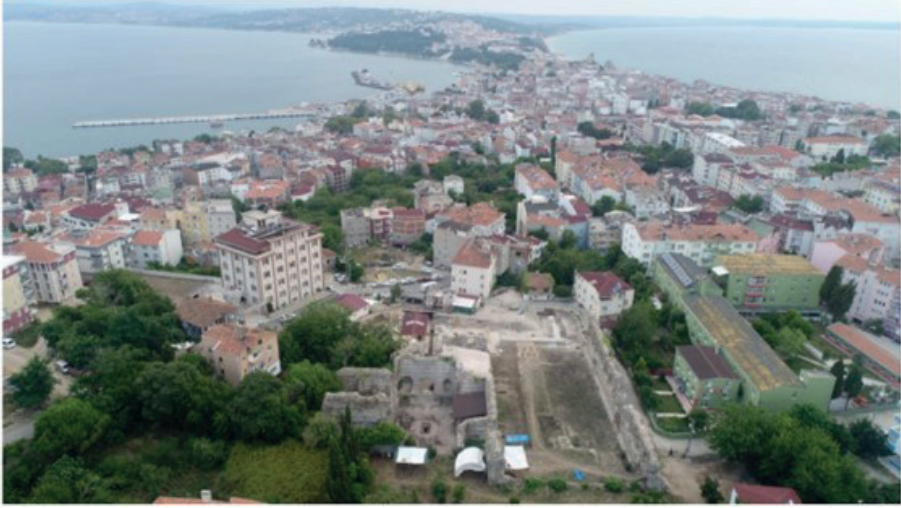
Görsel 1: Balatlar yapı topluluğu havadan görünüm.