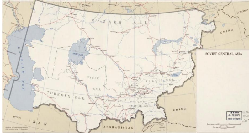
Resim 2. Sovyetler Birliği'nin Tasarladığı Orta Asya Haritası

19. yüzyıldan Sovyetler Birliği dönemine kadar, Rus milliyetçiliğinin etkili akımları Orta Asya'da tezahür etmiştir. Ekonomik ve kültürel açıdan geri olduğu düşünülen Orta Asya, Rusya'nın emperyal meşruiyetini sürdürmesine neden olmuştur (Laruelle, 2008: 28). Rus milliyetçiliği, Bolşevik Devrimi'nden kısa bir süre sonra kendisini hissettirmiştir. Bu bağlamda Sovyetler Birliği döneminde milliyetçilik; yerelcilik, devletçilik ve vatanseverlik temalarıyla öne çıkan bir doktrin olmuştur (Özel, 2014). 1924 yılında Milliyetler Komiseri unvanıyla görev yapan Stalin Rus olmayan gruplara karşı "millet oluşturma" politikası kapsamında, bölgedeki mevcut cumhuriyetleri lağvederek etnisite ayırımına dayalı yeni cumhuriyetler kurulmasını önermiş ve uygulamıştır. Bölge halklarının, Türklük ve Müslümanlık kimliği etrafında birleşmemesi için etnik grupları farklılaştırma mantığı ile yeni uluslar inşa edilmiştir.