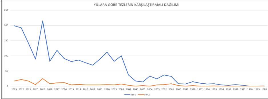
Grafik 1. Yıllara Göre Tezlerin Karşılaştırmalı Dağılımı

1995 tezin başlıklarına dair oluşturulan Şekil 1’deki kelime bulutunda ek niteliğindeki kelimeler ayıklanmış ve liste en az 1 kez yer alış şeklinde sıralanmıştır. Listenin kalabalık görüntüsünün ardında en az 1 yer alış sıralama sistemi vardır. En küçük görünen, mahalle, dinsel, kent, fiziksel, kırsal, zihinsel, iskan gibi kelimeler başlıklarda 1 kez; Van, Elazığ, Marmara gibi kelimeler daha yoğun yer almaktadır. Deprem başlıklı tezlerin en çok tekrar eden kelimesinin deprem olması şüphesiz anlamlıdır ve tartışma odağını güncel tutabilmeyi sağlamaktadır.