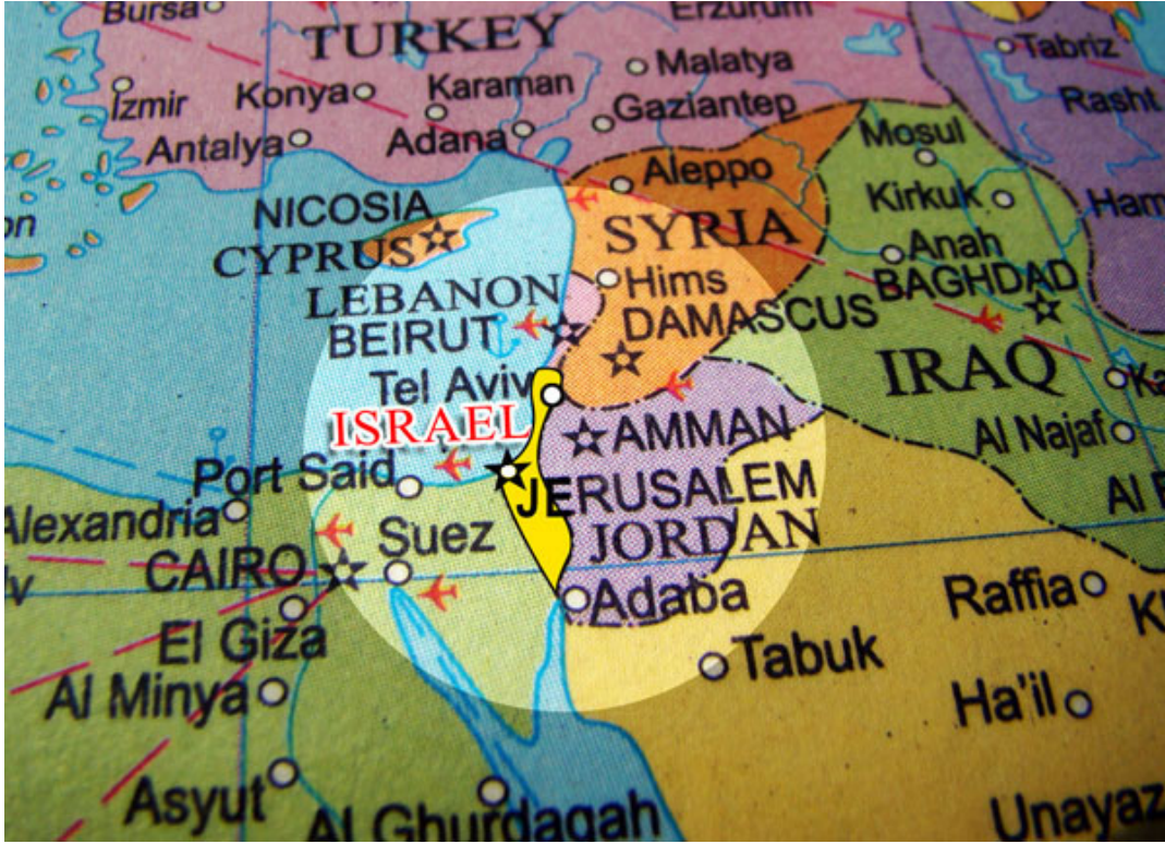
Harita 1: Arz-ı Mev'ud (Vadedilmiş Toprakların Alanı)