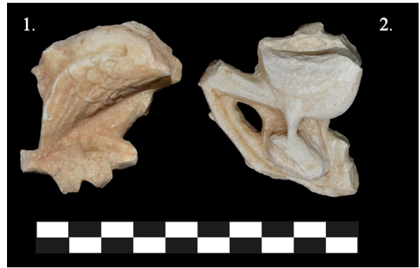
Fig. 9. Olasıyla bir balık ve kuş figürünün betimlendiği bezeli kabartma bezemeli elemanlar