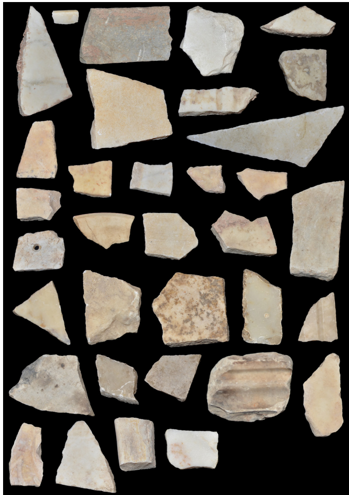
Fig. 12. Üzerinde herhangi bir bezeme unsuru içermeyen mermer kaplama levhası örnekleri