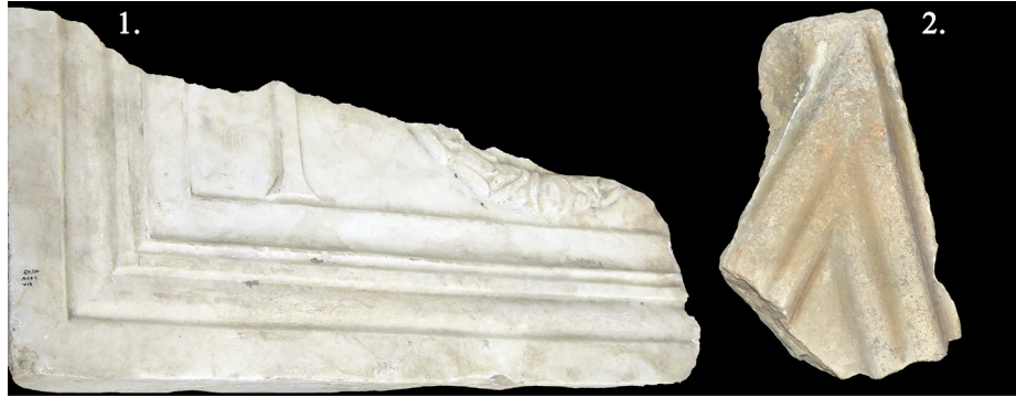
Fig. 7. Ambon (templon?) levhası olarak kullanılmış bloklar