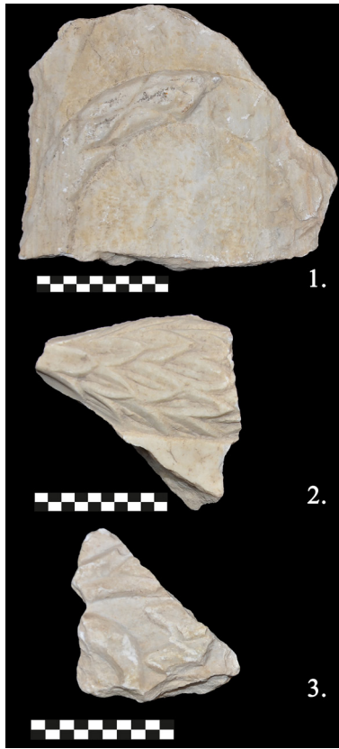
Fig. 8. Akanthus yaprakları ile kabartmalı bezemeler