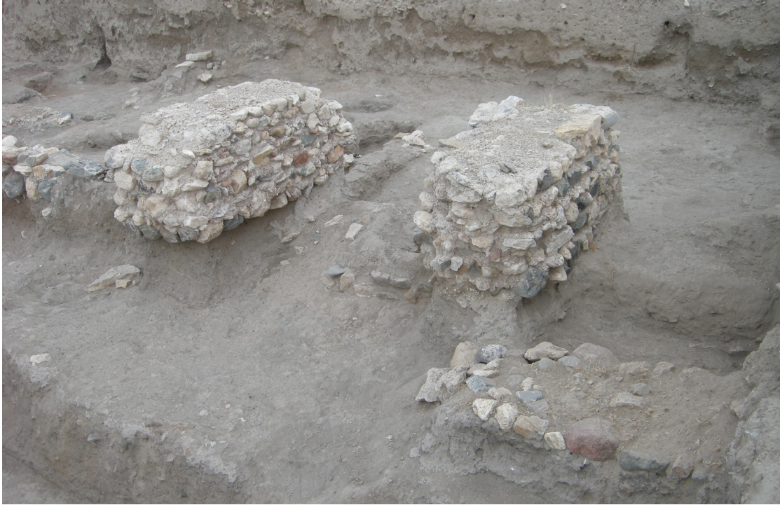
Fig. 14. Muhtemelen nartekse ait harçlı duvar kalıntıları