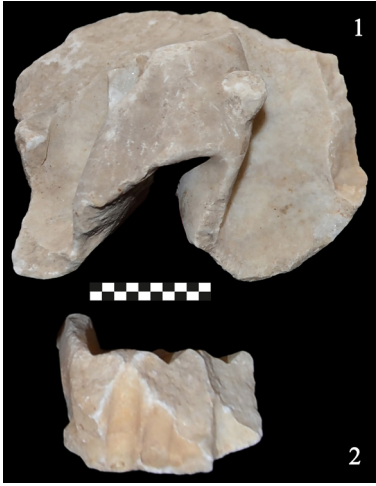
Fig. 10. Bir heykele ait elbise ve ayak fragmanı