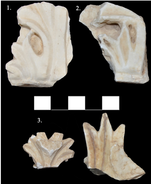
Fig. 5. Roma İmparatorluk Dönemine tarihlendirilen akanthus yaprakları