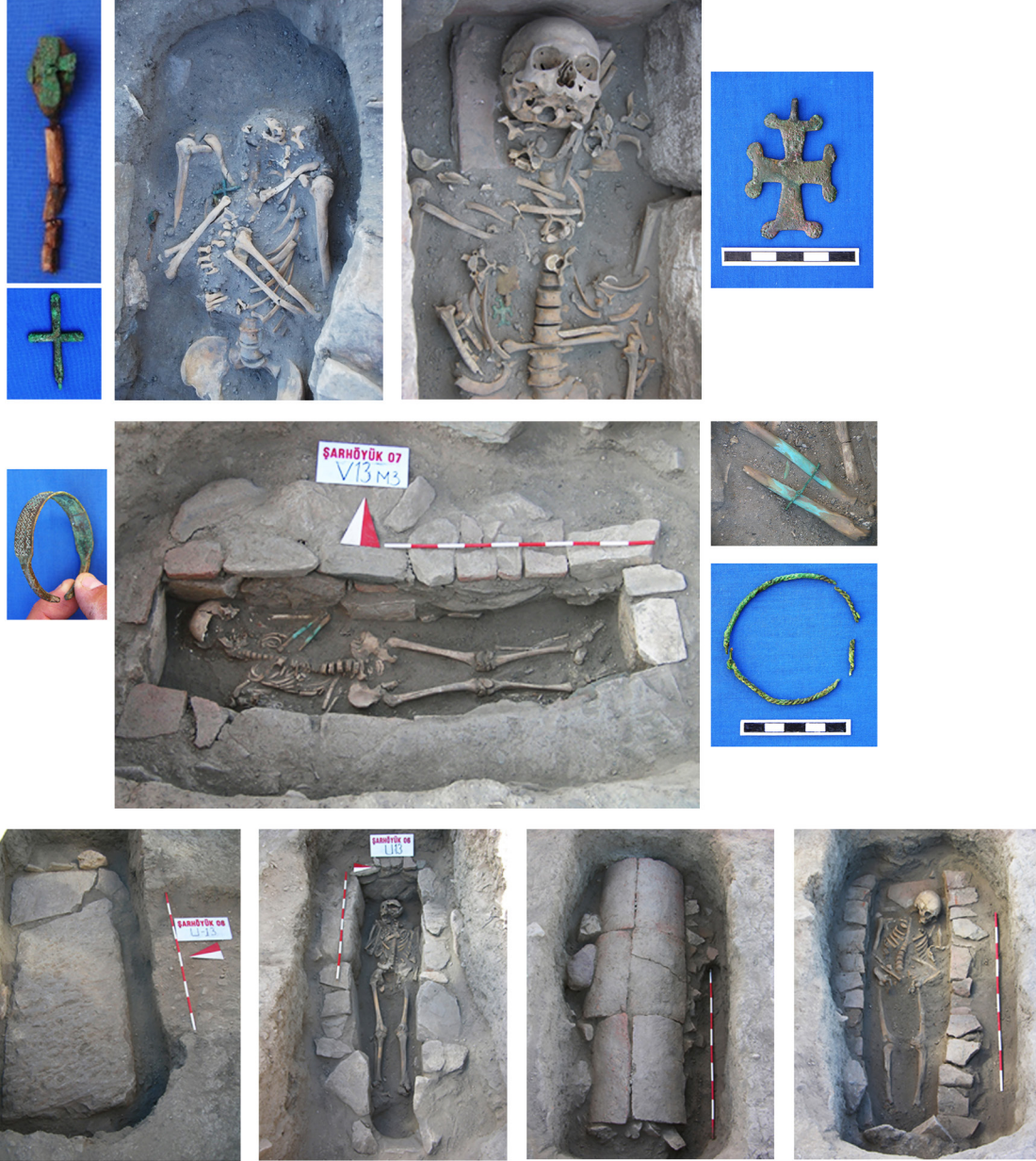
Fig. 15. Kilise bahçesi olarak tanılanan alandaki ruhban gömüleri