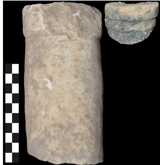
Fig. 6. Sütunçe parçaları