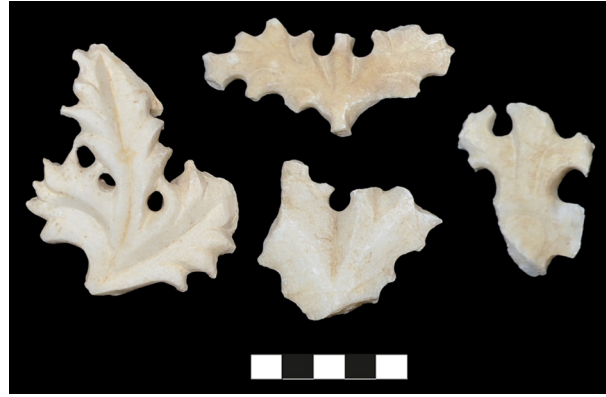
Fig. 4. Akanthus yaprak parmakları arasında yoğun kullanılan matkap yuvaları ile oluşturulmuş bezemeli elemanlar.