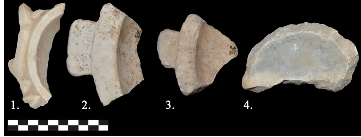
Fig. 11. Kentten ele geçmiş mortarium parçaları.