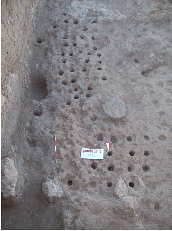
Fig. 13. Kilise temellerinde tespit edilen ahşap hatıllara ait yuva izleri