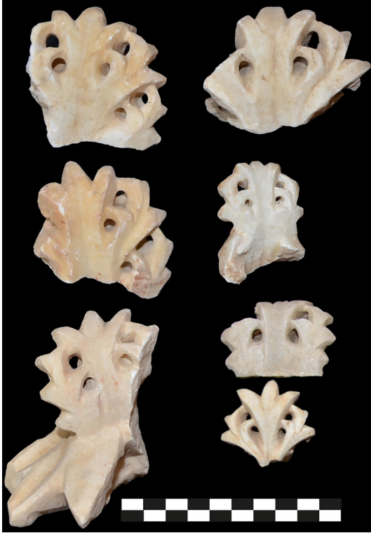
Fig. 3. Yaprak parmak uçları yuvarlatılmış akanthus yapraklarından örnekler.