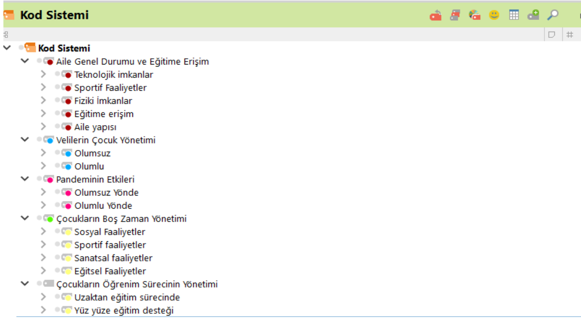
Şekil 2 Araştırmanın Kategori ve Alt Kategorileri

Şekil 2 incelendiğinde, aile genel durumu ve eğitime erişim kategorisi altında teknolojik imkânlar, sportif faaliyetler, fiziki imkânlar, eğitime erişim, aile alt yapısı alt kategorilerinin ortaya çıktığı görülebilmektedir. Velilerin çocuk yönetimi ve pandeminin etkileri kategorilerinin her ikisinde de olumlu ve olumsuz alt kategoriler oluşmuştur. Çocukların boş zaman yönetimi kategorisi altında sosyal, sportif, sanatsal ve eğitsel faaliyetler olmak üzere dört alt kategori oluşturulmuştur. Son kategori olan çocukların öğrenim süreçlerinin yönetimi kategorisi altında ise uzaktan eğitim ve yüz yüze eğitim olmak üzere iki alt kategori ortaya çıkmıştır. Görüşmelerden elde edilen kodlamaların yoğunluk durumları Şekil 3'te verilmiştir.