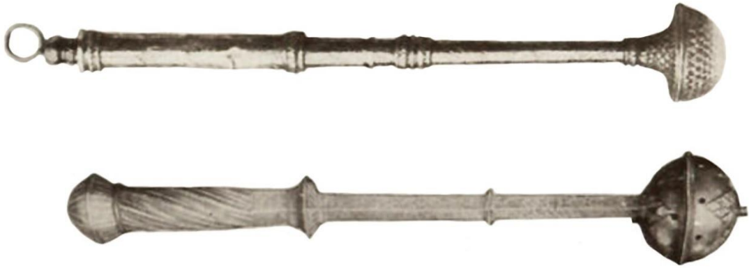
Resim 7. Agram (1496) ve Rottenburg Kathedraline (1586) ait serpme objesi (Braun, 1932)