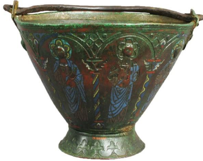
Resim 9. Metropolitan Sanat Müzesi'nde yer alan kutsal bir su kabı (M.S. 1200-1225)