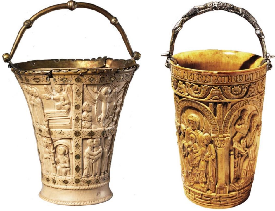
Resim 3. Metropolitan Sanat Müzesi'nde (Pierpont Morgan Situlası-M.S. 860-880) ve Milano Katedral Müzesi'nde (Gotofredo/Gotfredus Situlası-M.S. 967-983) yer alan kutsal su kapları (Schulz-Rehberg, 2006).