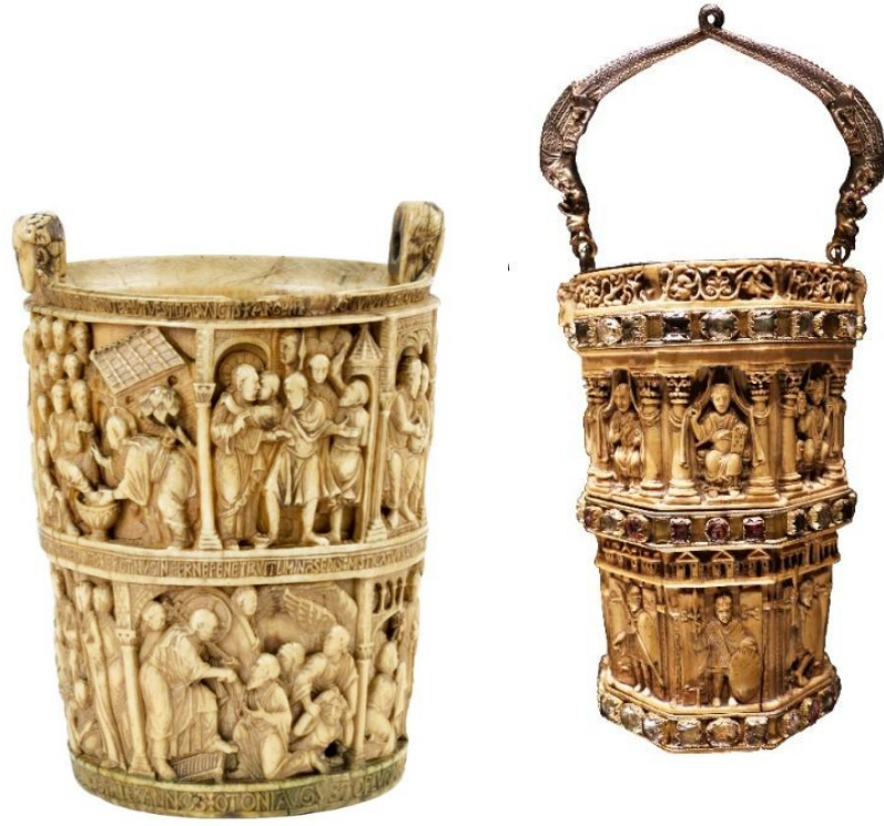
Resim 4. Londra Victoria and Albert Müzesi'nde (Basilewsky Situlası-M.S. 980-981) ve Aachen Kilise Hazinesi'nde (Aachen Situlası-M.S. 1000) yer alan kutsal su kapları (Schulz-Rehberg, 2006).