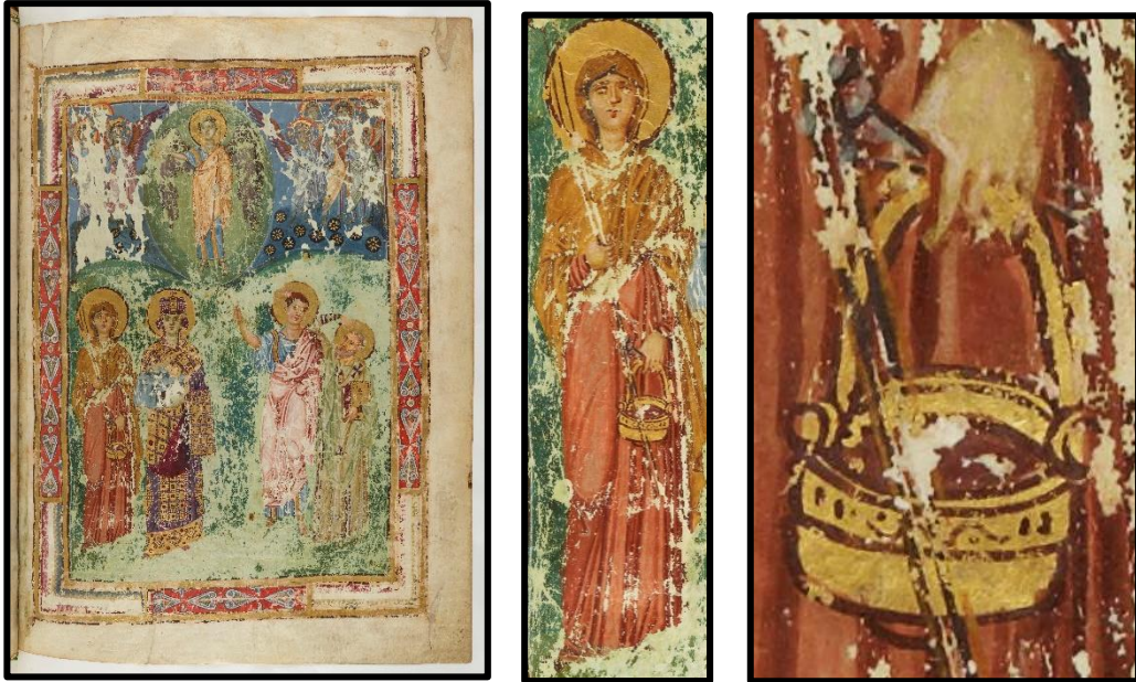
Resim 2. Paris Milli Kütüphanesi'nde yer alan bir el yazmadan detay (Gr. 510, f. 285)