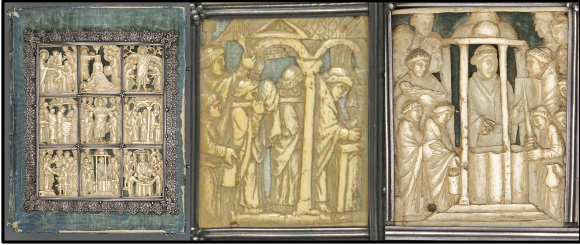
Resim 1. Drogo Sacramentary (M.S. 840-855) adlı el yazmasının ön kapağı (Calkins, 1986).