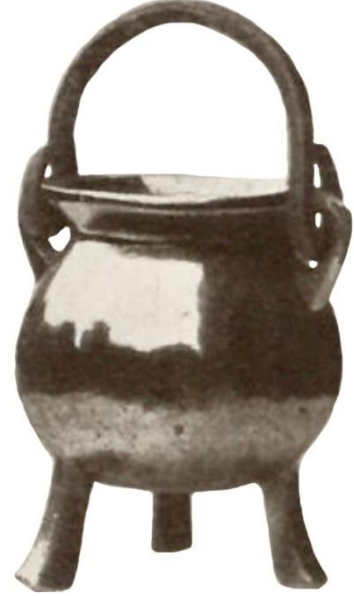
Resim 6. 15. yüzyıla ait bir el yazması ve Westfalen, Vasbach'da yer alan bir bölge kilisesinde tespit edilen kutsal su kabı (Braun, 1932).