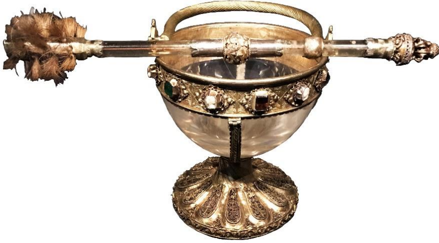
Resim 8. Machado de Castro Ulusal Müzesi'nde (Portekiz-Coimbra) kristalden yapılmış ve serpme objesi ile birlikte sergilenen kutsal bir su kabı.