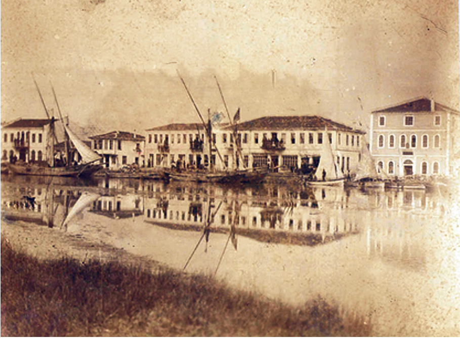
Karaağaç İskelesi