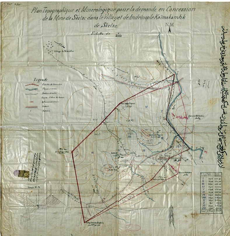
İsçeç Kazası'ndaki Bakır Madeni Haritası (İ.İMT 2/20)