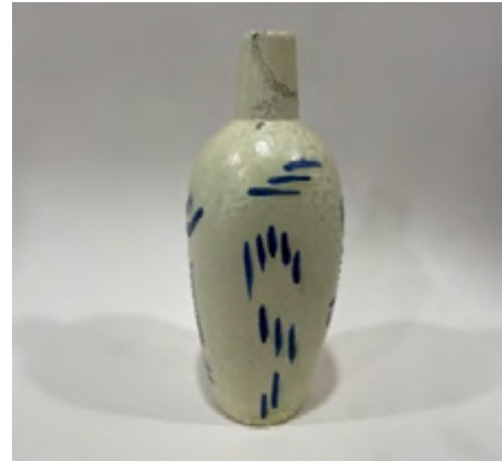
Resim 2. Hakkı İzet, Vazo Çalışması I, t.y, (Envanter No: 705).