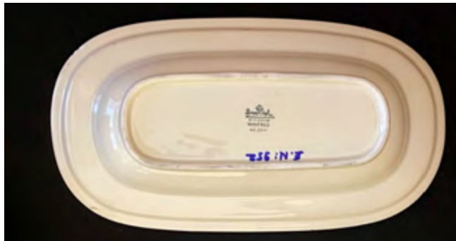
Resim 6. Rosenthal fabrikası tarafından üretilen porselen servis tabağı, (Envanter No:952).