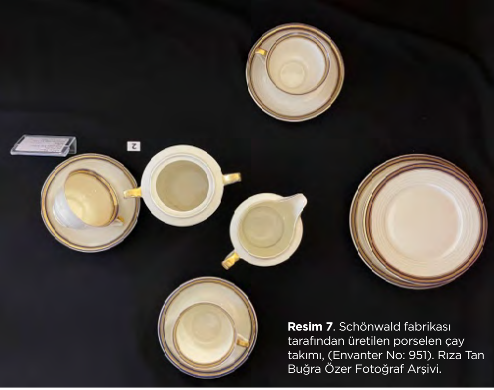
Resim 7. Schönwald fabrikası tarafından üretilen porselen çay takımı, (Envanter No: 951).