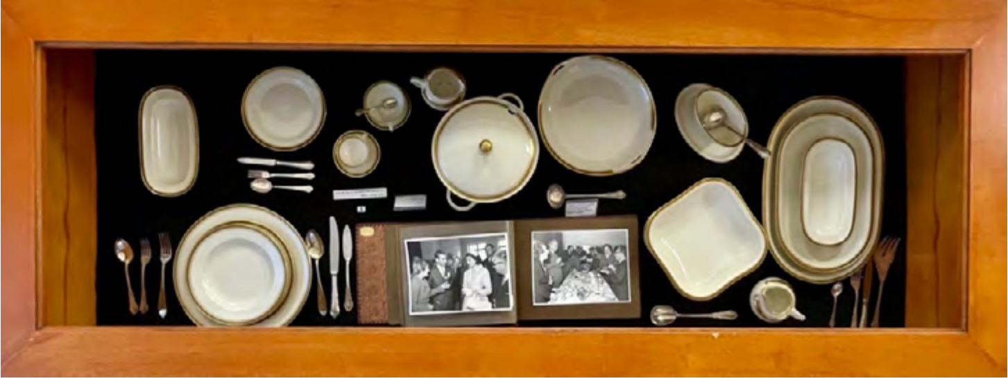
Resim 4. Hutschenreuther, Rosenthal Üretimi Porselen Sofra Eşyaları, (Envanter No:952).

onun eserlerinin sadece sanat tarihine değil, aynı zamanda Türkiye Cumhuriyeti'nin kültür tarihine önemli bir katkıda bulunduğunu göstermektedir. Hakkı İzet, birçok müze ve özel koleksiyonda da çeşitli eserleriyle bilinmektedir.