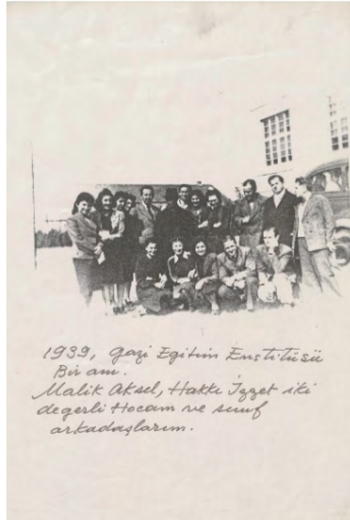
Resim 1. Gazi Eğitim Enstitüsü öğretmenleri Hakkı İzet ve Malik Aksel ve öğrencileri. (1939).

onun sanat anlayışındaki zenginliği ve çok yönlülüğünü de ortaya koymaktadır. İzet'in, çağdaş seramik sanatının öncülerinden biri olarak tanımlanması, onun sanat dünyasında bıraktığı kalıcı etkinin bir göstergesidir. Cumhuriyet dönemindeki sanatın dönüşümüne katkısı ve ekol oluşturmadaki çabaları, Türk seramik sanatının evriminde kritik bir rol oynamıştır. Hakkı İzet'in sanat anlayışı ve Prof. Ülker Muncuk Müzesi'nde bulunan seramik vazolar koleksiyonu ile Türk sanatının çeşitlenmesine ve zenginleşmesine olanak tanıyan bir miras olarak günümüze ışık tutmaktadır.