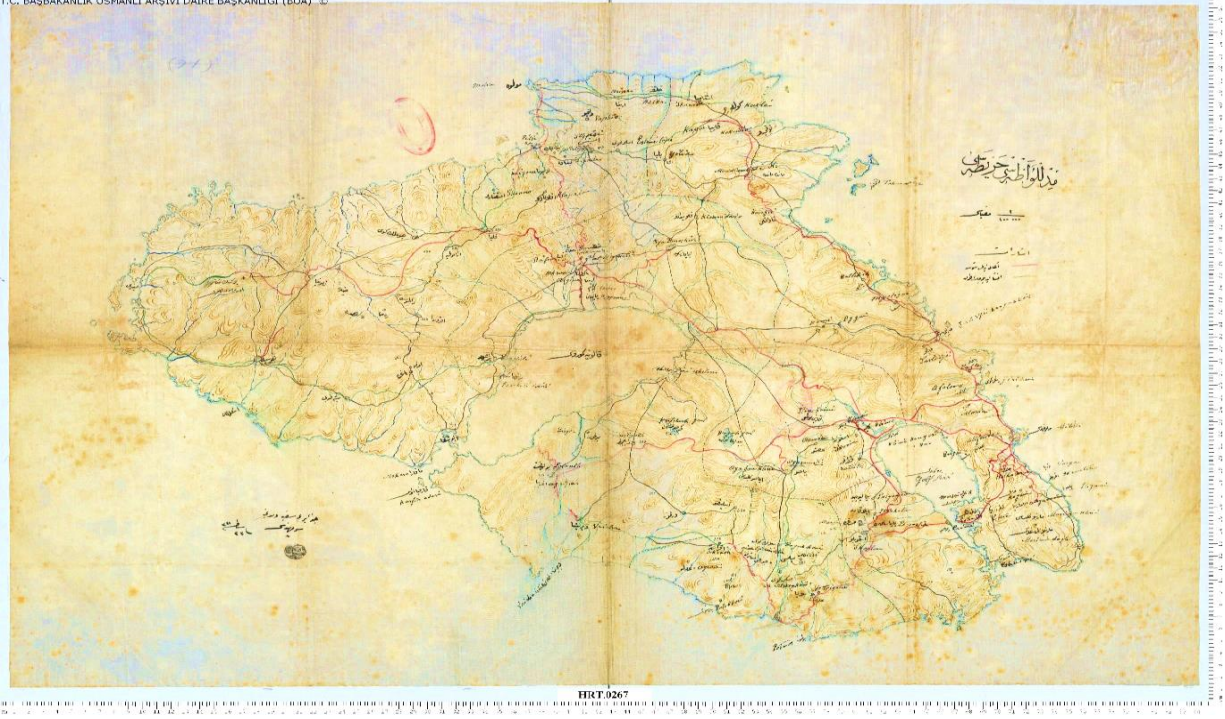
Harita 1: Midilli Adası Haritası (BOA, HRT,267)