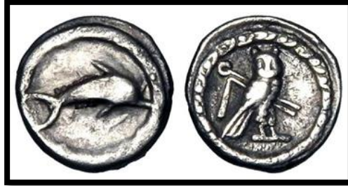
Figür 8: Tyros şehrine ait üzerinde yunus ve baykuş bulunan gümüş sikke örneği

(BMCGr Phoenicia, Pl. XXVIII. 14; Pl. XXIX. 7)