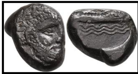
Figür 9: Arados şehrine ait üzerinde Ba'al-Arvad'ın sakallı başı, profilden gözü ile dalgaların üzerinde kadirga ve Pataikos (Mısır'ın çüce tanrısı Ptah)'ın yer alan sikke örneği

(BMCGr Phoenicia, Pl. XXVIII. 14; Pl. XXIX. 7)