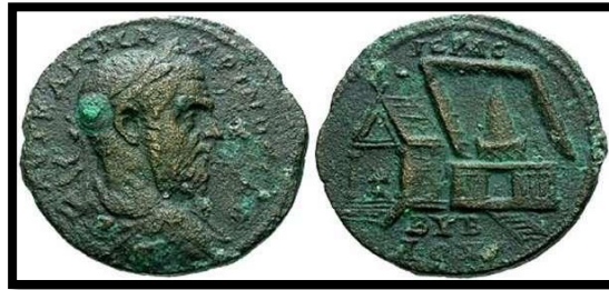
Figür 4: Roma İmparatoru Macrinus Dönemi'ne (MS 217-218) Ait Bir Byblos Sikkesi

Sikkeler yoluyla yerli ve yabancı tanrı ya da tanrıçalara ulaşmak mümkündür. Bununla birlikte sunak ve dini ritüel tasvirlerinden uygulanan ya da etkisinde kalınan inanç sistemlerine de ulaşmak mümkün olmaktadır. Keşfedilebilmiş Fenike tapınaklarına bakıldığında, iyi korunamamış durumda olsalar dahi küçük kült alanını saran tahkim edilmiş geniş bir kutsal alan bulundukları görülür. Bu tapınak tipinin, yüzlerce yıl daha yaşlı bir mabedin kopyası olduğu açıkça görülen bir örneğine, Roma İmparatoru Macrinus Dönemi'nden (MS 217-218) kalma bir Byblos sikkesinin üzerinde rastlanır (BMCGr Phoenicia, Pl. XII. 13-Figür 4) Bu tapınak, önünde basamaklar bulunan, sıra sütunlarla sarılı ve içinde bir baitylos olan kutsal bir iç alandan oluşan in antis planındaki tapınağa çok benzer. İdalion'da bulunmuş terracotta bir model ile Kıbrıs Tapınağı'nın biri altın bir levha, diğeri de bir sikke üzerindeki iki tasvirinin de Amrit Tapınağı'na çok benzediği görülür.