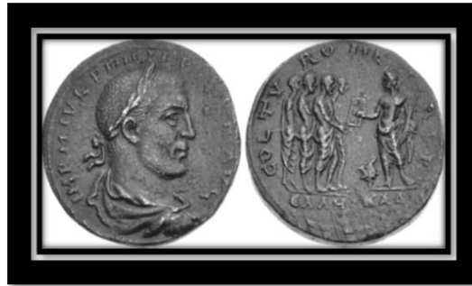
Figür 3: Tyros Bronz Sikke Örneği

(Classical Numismatic Group, LLC . Triton XXII)