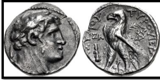
Figür 7: Tyros şehrine ait Melkart'ın başı ile pruvada duran kartal, arka planında ise palmiye yaprağı bulunduran gümüş sikke örneği

(BMCGr Phoenicia, Pl. IV. 3; SNG Cop. 31)