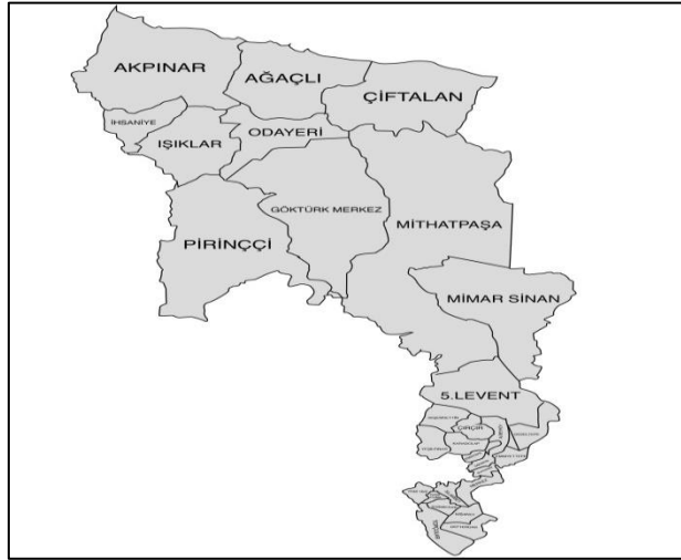
Şekil 1; Eyüpsultan Haritası (Eyüpsultan Belediyesi, 2023)

Araştırmanın amacı, Eyüp Sultan Külliyesi ve çevresi dışında kalan tarihi miras yapılarının turizm rotasıyla tanıtılması, ilginin artırılması ve farklı kültürel yapıların bilinirliğinin sağlanmasıdır. Araştırmanın temel materyalini Eyüpsultan'da kültür turizmi kapsamında değerlendirilen tarihi ve mimari yapılar oluşturmaktadır. Araştırma sürecinde kullanılan diğer materyaller ise Eyüpsultan Belediyesi ve Eyüpsultan İlçe Milli Eğitim İşbirliğiyle hayata geçen "Eyüpsultan'ı Öğreniyorum" proje çıktıları, ilçeye ait gezi rehberleri göz önüne alınarak konu ve alanla ilgili literatür oluşturmaktadır. Bu bağlamda, araştırmada literatür araştırma ve katılımcı gözlem yöntemleri izlenmiştir. Çalışmada, Eyüpsultan'da yapılan gezi rotaları örnekleri incelenerek araştırma kapsamında ortaya çıkan miras rotası önerisine cevaplar aranmıştır. Araştırmaya konu olan Eyüpsultan haritası Şekil 1'de görülmektedir.