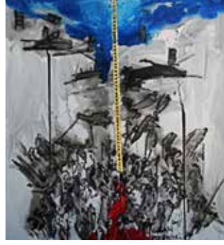
Görsel 14. Hasan Pekmezci, İnsanlarımız , 2011, T.Ü.Y.B., 110x110 cm.

Çağdaş Türk Sanat ve eğitimi açısından bir duayen olan Hasan Pekmezci bireysel üretimlerinde de yaşamı, doğayı, insanları, memleket manzaralarını resimlerinde tekrar tekrar yorumlamıştır. Sanatçının, Doğa isimli çalışmasını Kayahan'ın değerlendirmesine göre;