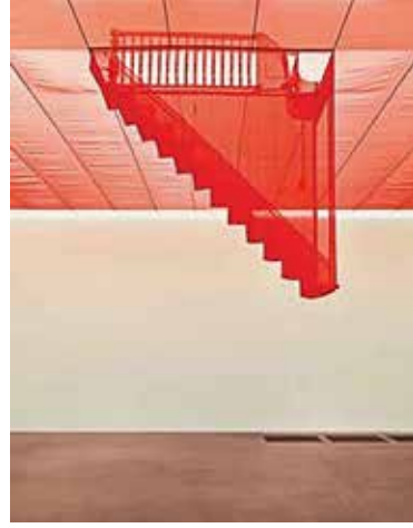
Görsel 11. Rachel Whiteread, Untitled (Stairs) , 2001.