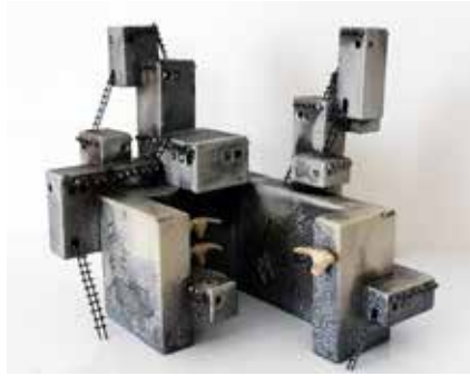
Görsel 6. Ferit Cihat Sertkaya, Form 1, Raku Pişirimi , 26x20x24 cm.