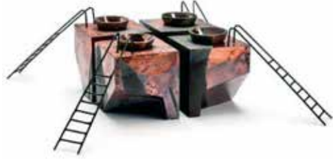
Görsel 3. Ivan Navarro, TheLadder/Merdiven , Neon Işıklandırma.