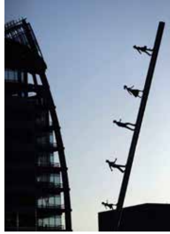
Görsel 9. Jonathan Borofsky, Walking to the Sky , 2004.