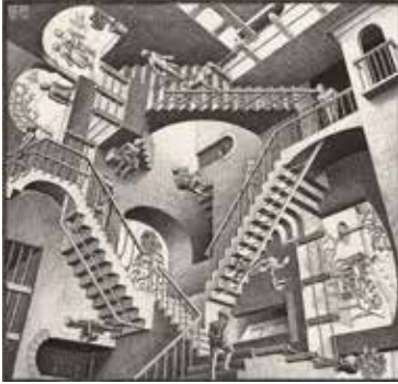
Görsel 7.M. C. Escher, Relativity/Görelilik , 1953, Litografi Baskı.

Hollandalı ünlü ressam ve grafik sanatçısı M.C. Escher'in çalışmalarında kullandığı merdivenleri de resim sanatında en etkili eserlerden biri olarak kabul edilmektedir. Escher'in Görelilik adlı eseri sanatçı tarafından ilk kez Aralık 1953'te yapılmış bir litografi baskıdır. Bu çalışma, matematiksel paradokslar, göz yanılsamaları ve illüzyon, yönü belli olmayan merdivenler ile resmedilmiştir. Kompozisyon bakımından yarattığı imkânsız figürler sürekli yukarı ya da aşağı hareket etmesine rağmen yine başladığı noktaya geri dönmektedir. Escher'in bu çalışmasında gerçek ve gerçek olmayan arasında insan beyni ikilemede kalmaktadır. Ayrıca bu resimde merdivenlerden ne çıkılabilmek ne de inilebilmek mümkün görünmemektedir ve bu merdivenler sonsuz bir döngü halindedir ve normal yerçekimi yasalarının geçerli olmadığı bir dünyayı tasvir eder (Hofstadter, 2011'den Aktr. Arık, 2019:53).