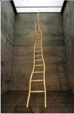
Görsel 5. Martin Puryear, Ladder for Booker T. Washington , 1996.

Gençliğinde el sanatları okuyan ve aynı zamanda heykel alanında yüksek lisans derecesine sahip olan sanatçı Martin Puryear, ahşap, taş, katran ve tel gibi farklı malzemelerden oluşan üretimlerinde minimalist bir yaklaşıma odaklanmaktadır. Sanatçı Ladder for Booker T. Washington adlı üretimini eklemli dişbudak ağacından cılız ve kıvrımlı bir merdiven olarak inşa etmiştir. Bu merdiven tepeye doğru yükseldikçe daralmaktadır ve izleyici için ulaşılamaz veya yanıltıcı bir hedefi çağırıştırır. Ayrıca bu çalışma, çarpık bir perspektif duygusu yaratarak merdivenin havada yüzüyormuş gibi algılanması ile bir yanılsamaya da neden olur. Aşağıdan yukarıya bakıldığında merdiven gökyüzünde kayboluyormuş gibi gözükmektedir. Sanatçının ifadesine göre; "Merdivenin eğriliği yol boyunca yaşanacak zorlu görevi temsil etmektedir. Ayrıca ahşabın kırılabilirliği de zirveye yapılan bu yolculuğun dengesiz olacağını ifade etmek için kullanılmıştır"(Puryear, t.y.).