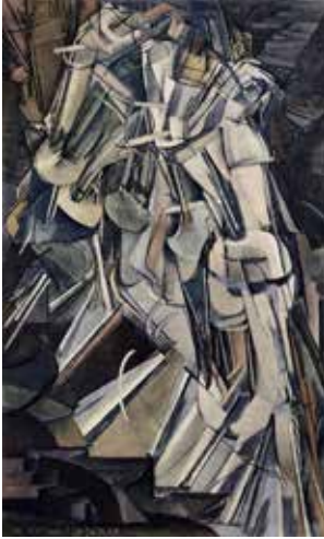
Görsel 1. Marcel Duchamp, No.2/Merdivenden İnen Nü , 1912, TüYB, 147x89.2 cm.

Merdiveni sanatsal üretimlerinin odağına alan Marcel Duchamp 1910 yılında, Kübizm'e ve kısa bir süre sonra da eserlerinde Fütürist anlayışa yaklaşmış daha sonra Kübizm ile Fütürizm birleştirilerek birçok özgün çalışmayı ortaya çıkarmıştır. Duchamp'ın Kübizm ve Fütürizm unsurlarını birleştirdiği Nude Descending a Staircase, No.2/Merdivenden İnen Nü çalışmasında, dar bir merdivenden aşağı inen hareket halindeki bir vücudu tasvir eder. Modernist bir başyapıt niteliği taşıyan tuval üzerine yağlı boya bu çalışmada merdivenden inen çıplak bir figür hareket halinde betimlenmektedir. Bu eserde, figür parçalanmıştır ve hareketin aşamalarını tasvir etmek için bir araya gelen soyut, geometrik parçalardan oluşan figür göz aracılığıyla biçimsel olarak anlaşılır. Arka planda ise daha koyu renklerle tasvir edilen merdiven dikkat çekmektedir (Cançat, 2019:185).