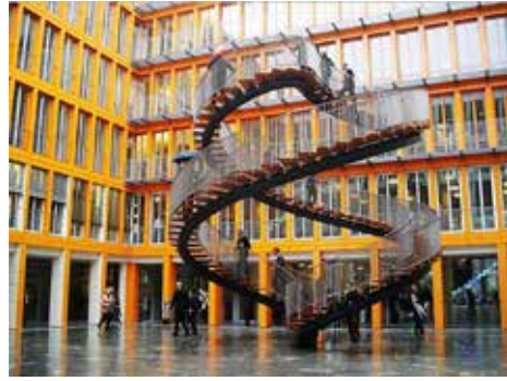
Görsel 8.Olafur Eliasson, Umschreibung/Yeniden Yazma , 2004.

Danimarkalı sanatçı Olafur Eliasson tarafından tasarlanan Umschreibung/Yeniden Yazma isimli yerleştirme çalışması fonksiyonel bir merdivenden ziyade sanatsal bir manifesto niteliği taşımaktadır. Almanca'da "yeniden yazmak" anlamına gelen Umschreibung , Münih'te kurumsal bir şirketin ofis binasının av-