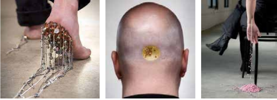
Görsel 7. Catherine Grisez, İnsanı heykel olarak tasvir eden Lick serisi, 2011

Giyilebilir sanatın değerli taşlar, buluntu nesnelere, polikarbonatfilm, yüksek teknoloji modern malzemeleri kapsaması ve son teknoloji kullanımları ile sunulması, yaratıcı düşüncede sınırsızlığın bir göstergesidir. Bazı sanatçılar ise teknolojik yeniliklerden yararlanarak, eski takıları kişiselleştirmektedir. Ürün, yeniden tasarlanmaktadır ve yeniden tasarım sırasında sınır yoktur. Petra Zimmermann tasarım ve uygulamaları, eski takıları kişiselleştirmede sanat ve zanaatın birlikteliği için örnek gösterilebilir (Görsel 8,9).