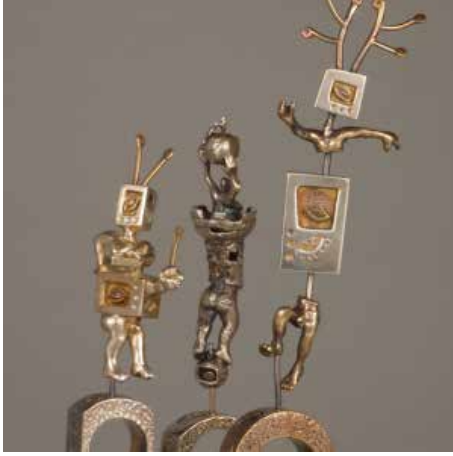
Görsel 5. Delfina Delettrez, küpe, 2012

bireyselliklerini aktarmaktadır. Sanatçının, takı parçasını giyilebilir bir nesne olarak gerçek özünden başka bir nesneye dönüştürebilme gücü, özgür tema kullanımını da sağlamıştır. Kullandığı temalar ile figüratif ve ikonografiyi bir arada yansıtan günümüz takı sanatçılarından Delfina Delettrez'in takı nesnelere ilginçtir. Çalışmalarında gerçeküstülüğün kavramsal anlamını araştırmaya daha çok yer vermiştir (Görsel5).