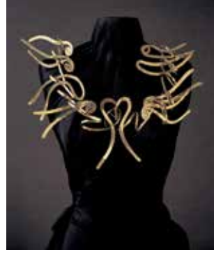
Görsel 3. Salvador Dali, telefon küpe, 1949