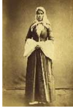
Görsel 23: Geleneksel başörtüsü takmış ve fufayka giymiş evli bir Greben Kazak kadını.

Kadınlar ayaklarına çorap, bot ve deriden yapılmış, ayağı ayak bileğine kadar saran, sivri uçlu, yüksek topuklu çereviçki giyerler (Rjevusskiy, 2014: 180).