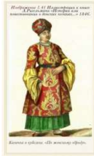
Görsel 1: Kırmızı ve sarı renkli kubelek giymiş bir Don Kazak kadını. (Kaynak: A. İ. Rigelman’ın 1846 yılında yayımlanan “Don Kazaklarının Tarihi ya da Anlatısı” adlı eseri. (URL-1)).

Don Kazak kadınlarının giyim kuşamına bakıldığında, giyim kuşamlarının genellikle Tatar, Türk ve Rus kadınlarının giyim kuşamından izler taşıdığı görülür. Aşağı Don bölgesinde yaşayan Don Kazak kadınlarının temel kıyafetini, bir nevi Tatarların giydikleri kaftana benzeyen kubelek oluşturur. Kubelek ; uzunluğu dizlerin altına kadar gelen, yakasız, kolları geniş bırakılmış, genellikle ipekli kumaştan dikilen, göğsünde gümüş ya da yaldızlı düğmeler bulunan bir üst giysisidir (Görsel 1) (Suhorukov 1891: 121). Bu giysinin adı ise “güve” veya “kelebek” anlamlarına gelen Tatarca “kobelek”, “kebelek” sözcüklerine dayanmaktadır. Kadınlar kollarını yukarıya kaldırdıklarında, kubelek ’in geniş bırakılmış kolları bir güvenin ya da bir kelebeğin kanatlarını anımsattığı için söz konusu giysiye bu isim verilmiştir. Kadınlar hem gündelik hayatlarında hem de bayramlarda giydikleri kubelek ’i 17. yüzyıldan başlayarak 19. yüzyılın sonlarına kadar yaygın bir biçimde kullanmışlardır (Gorblyanskaya, 2012: 34).