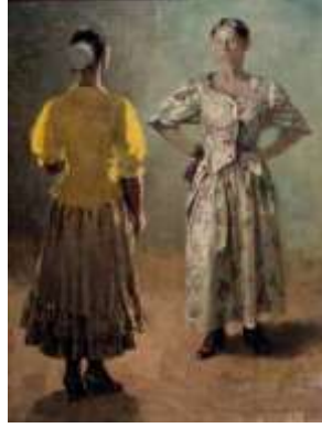
Görsel 24: Şlıçka takmış, kahverengi/ sarı renkli paroçka ve siyah renkli çereviçki giymiş bir Kuban Kazak kadını (S. A. Gavriyaçenko'nun çalışması).

Ural Kazak kadınlarının giyim kuşamına bakıldığında, Ural Kazak kadınlarının, Rusların etkisiyle rubaha ( rubaha uzun ya da kısa olabilir) ve sarafan giydikleri görülür. Ancak Ural Kazak kadınlarının giydikleri rubaha , Don bölgesinde ve Kuban'da yaşayan kadınların giydikleri rubaha 'dan farklıdır. Çünkü Ural bölgesinde giyilen rubaha , kol ( rukava ) ve gövde kısmı ( stan ) olmak üzere iki parçadan oluşur. Rubaha 'nın gövde kısmını oluşturan parçası pamuklu kumaştan ya da basma kumaştan dikilirken, kolları atlas, ipek gibi pahalı kumaşlardan dikilir. Aynı zamanda söz konusu rubaha 'nın kolları Don bölgesinde ve Kuban'da giyilen rubaha 'nın kollarından daha geniş, daha kabarık ve daha süslüdür. Sarafan ise rubaha 'nın üzerine giyilir. Göğüs kısmı kapalı olan sarafan yere kadar uzanır. Günlük hayatta giyilen sarafan 'lar basit kumaşlardan dikilir. Bu sarafan 'ların üzerinde sırma şeritler ve düğmeler yoktur. Törenlerde giyilen sarafan 'lar ise pahalı kumaşlardan dikilir. Üzerinde sırma şeritler ve yaldızlı düğmeler bulunur (Kurohtin, 2013: 5). Kadınlar sarafan 'ın üzerine ise gümüş ve altın ipliklerden yapılmış, uçları püsküllü kemer takarlar (Kalaşnikova, 2013: 10).