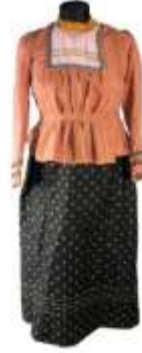
Görsel 11: Kahverengi ve siyah renkli parochka , Rus Müzesi Kültür ve Sergi Merkezi.

Don Kazak kadınları, 20. yüzyılın başından itibaren bluz ve etekten oluşan, genellikle ipekli ya da pamuklu kumaştan dikilen parochka (Görsel 11) denilen takımlar da giyerler.