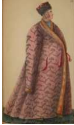
Görsel 4: Pembe kaftan giymiş bir Don Kazak kadını. (Kaynak: A. İ. Rigelman'ın 1846 yılında yayımlanan "Don Kazaklarının Tarihi ya da Anlatısı" adlı eseri. (URL-3)).

Don Kazak kadınları, genellikle ipekli kumaştan dikilen, yere kadar uzanan, geniş, uzun kollu ve işlemeli kaftanlar da (Görsel 4) giyerler. Hatta konuyla ilgili olarak Don Kazakları konusunda çalışmaları bulunan Aleksandr İvanoviç Rigelman (1720-1789), yukarı Don bölgesinde yaşayan Don Kazak kadınlarının erkek kaftanları (1846: 137); Rus general ve tarihçi Nikolay İvanoviç Krasnov (1833-1900) ise aşağı Don bölgesinde yaşayan Don Kazak kadınlarının kadifeden ya da Angora keçisinin yününden yapılmış kaftanlar giydiklerini belirtir (akt. Loginov, 2003: 74).