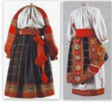
Görsel 2: 19. yüzyılın sonlarına ait bir rubaha.