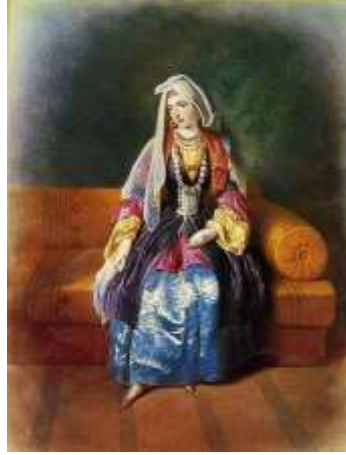
Görsel 22: Siyah renkli fufayka giymiş bir Greben Kazak kadını (G. G. Gagarin'in "Çervlyonnaya Stanitsası'ndan Bir Kazak Kadını" adlı çalışması, 19. yüzyıl). (Kaynak: URL-11).

biçimde uzanması oluşturur. Kadınlar, tıpkı beşmet gibi fufayka giyerken de siyah, mavi, kahverengi ve yeşil renkleri tercih ederler (Rjevusskiy, 2014: 179-180).