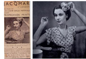
Görsel 8: Baskılı Jacqmar elbisesi ile Vivien Leigh, British Voque, Nisan 1942 (URL-24).

İngiltere 1941’de her yetişkin kişiye yıllık 66 kupon dağıtılır (5 kupon bir bluz için, 5 kupon bir çift bot için, 7 kupon bir elbise için ve 14 kupon bir ceket için kullanılabiliyordu). Bu sayı 1942’de 48 kupona, 1943’te 36 kupona, 1945’te 24 kupona düşürülür. Savaş döneminde insanların moral kaynağı olan modanın vazgeçilmez aksesuarları eşarplar, şapkalar ve başlıklar ise, karneye tabi olmayan ürünler arasında yer alır (URL-5).