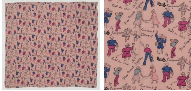
Görsel 4: "London! Alert!!", 91 cm x 91 cm, 1943 (URL-14).

"Letters to France" kadın eşarbinda, kırmızı zemin üzerine mavi, sarı, pembe ve beyaz renklerde Fransa'ya gönderilen zarflar yer almaktadır (Bkz. Görsel 3). Zarfların arka kısımlarında gönderen "From: Jacqmar London (Londra'dan Jacqmar)" yazısı bulunmaktadır (URL-7). Zarfların üstüne farklı adresler el yazısı ile yazılmıştır. Direniş ile birlikte Fransız savaş ve ticari denizcilik hizmetlerini kutlayan, çeşitli Free French (Özgür Fransız) birimlerine hitaben yazılmış zarf biçimleri serbest olarak desen içinde bulunmaktadır (URL-7).