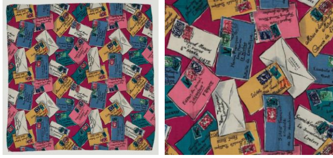
Görsel 3: "Letters to France", 86 cm x 86 cm, 1940 (URL-12).

"Letters to France" kadın eşarbinda, kırmızı zemin üzerine mavi, sarı, pembe ve beyaz renklerde Fransa'ya gönderilen zarflar yer almaktadır (Bkz. Görsel 3). Zarfların arka kısımlarında gönderen "From: Jacqmar London (Londra'dan Jacqmar)" yazısı bulunmaktadır (URL-7). Zarfların üstüne farklı adresler el yazısı ile yazılmıştır. Direniş ile birlikte Fransız savaş ve ticari denizcilik hizmetlerini kutlayan, çeşitli Free French (Özgür Fransız) birimlerine hitaben yazılmış zarf biçimleri serbest olarak desen içinde bulunmaktadır (URL-7).