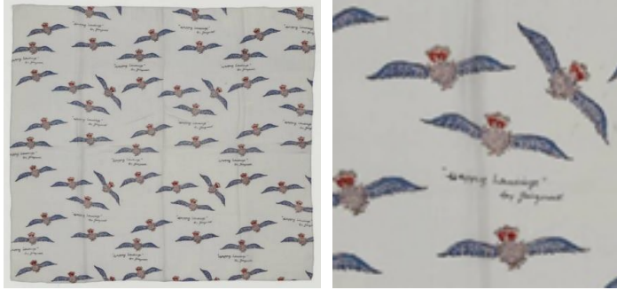
Görsel 6: "Happy Landings", 93 cm x 85 cm, 1941 (URL-16).

"8th Army Air Force" eşarp tasarımında, pembe zemin rengi üzerine siyah el yazısı ile kişi isimleri ve "8th Army Air Force (8. Ordu Hava Kuvvetleri)" yazısı bulunmaktadır (Bkz. Görsel 5). Eşarbin tüm yüzeyinde parlak renkli (kırmızı, mavi, yeşil, mor, sarı) kanatları olan Hava Kuvvetleri sembolleri yerleştirilmiştir. Köşeye "JACQMAR" yazısı basılmıştır (URL-15). 8. Ordu adına hatıra eşyası olarak tasarlanan eşarp suni ipekten üretilmiştir (URL-1).