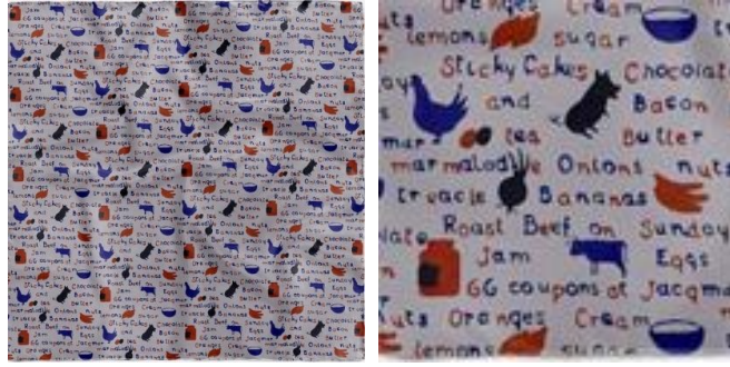
Görsel 7: “66 Coupons” replika, 91cm x 91 cm, orjinal 1942 (URL-25).

İkinci Dünya Savaşı yıllarında, birçok kadın üniformaya geri dönüş yapmıştır. Cephelerdeki beklenti ise, insanların tutumlu olmaları, geri dönüşüm yapmaları, giysileri tamir etmeleri yönünde olmuştur. Giyim, L-85 Yönetmeliği ile beraber 1941’de Britanya’da karneye bağlanır. Karne yöntemi ile, insanların alabileceği kıyafet miktarından, giysi yapımında kullanılacak kumaş çeşidi sayısına kadar sınırlama getirilir (Blackman, 2013: 155).