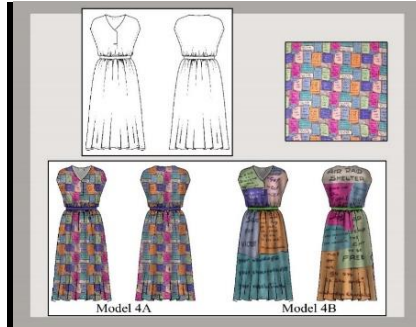
Görsel 17: Elbise modeli için hazırlanan tasarım panosu.

Model Analizi: V yakalı, ön pat ucu pileli, düşük omuzlu, kolsuz, belden büzgülü, belde ince kemeri olan ve boyu dizaltında biten elbise.