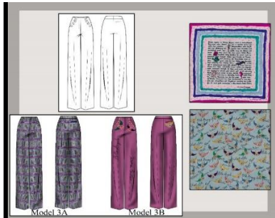
Görsel 16: Pantolon modeli için hazırlanan tasarım panosu.