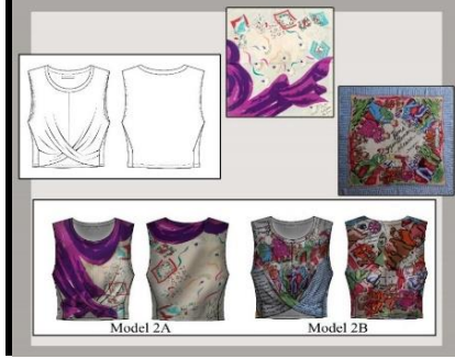
Görsel 15: Bluz modeli için hazırlanan tasarım panosu.

Model Analizi: Kolsuz, yuvarlak yaka formu takma pervaz tekniği ile çalışılmış, ön beden ve arka beden yan kuplu, ön orta dikişten pileli bluz.