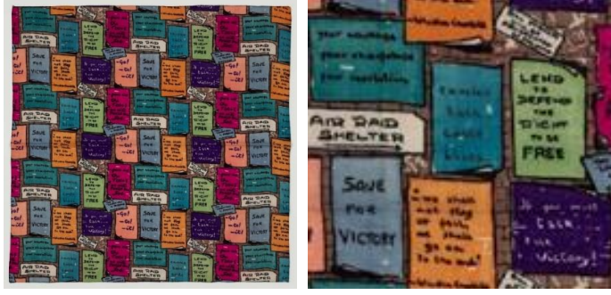
Görsel 11: “London Wall”, 87 cm x 87 cm, 1941 (URL-21).

“London Wall”, Jacqmar’ın en ünlü ve oldukça nadir bulunan eşarplarından biridir (Bkz. Görsel 11). “London Wall (Londra Duvarı)” eşarbında, zemindeki tuğla duvar tasviri üzerinde popüler sloganların yer aldığı renkli pankartlar görülmektedir (URL-1).