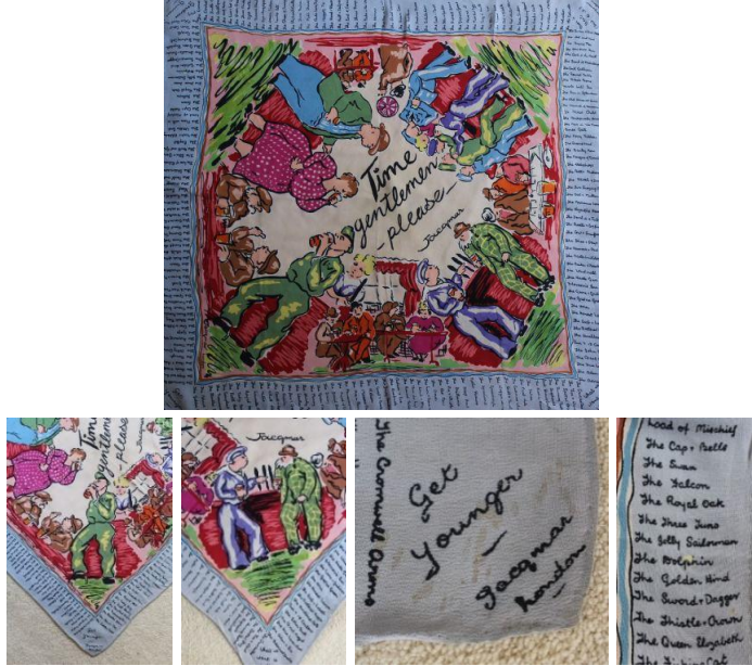
Görsel 12: “Time Gentlemen, Please”, 89 cm x 86 cm, 1944 (URL-23).