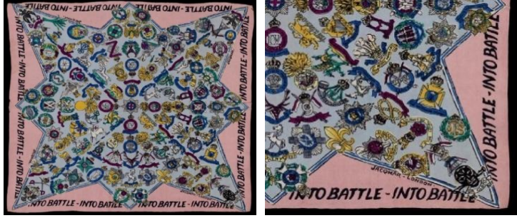
Görsel 1: "Into Battle", 83 cm x 91 cm, 1942 (URL-11).

Sonraki kısımda, Jacqmar tasarımlarından, üzerinde savaş dönemi uygulamalarının, sloganlarının ve sembollerinin yer aldığı seçilmiş tematik eşarp örnekleri özellikleriyle açıklanmıştır.