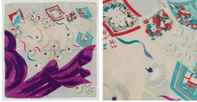
Görsel 9: “Le Ballet des Echarpes”, 90 cm x 87 cm, 1945 (URL-17).

yıllarında bile kadınlar üzerindeki etkisini kaybetmeyen moda dergisi Voque dahi, toplumun moda ile dönüşümünde söz sahibi olur.