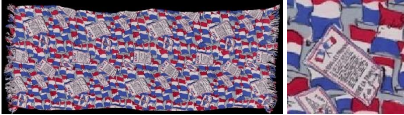
Görsel 2: "Free French", 103 cm x 41 cm, 1940 (URL-13).

"Into Battle", genişlik ölçüsü 83 cm, uzunluk ölçüsü 91 cm olan eşarp, pembe zemin rengine sahiptir (Bkz. Görsel 1). Kenarlarına "INTO BATTLE" sloganı yerleştirilmiş, İngiliz ve Güney Doğu Asya askeri birlikleriyle ilgili işaretler sekiz köşeli bir yıldız üzerine basılmıştır (URL-11). Askeri bir model ve en eski üretilen tasarımlardan biri olan bu çalışmada Brunswick yıldızı çarpıcı bir şekilde merkeze yerleştirilmiştir (URL-1).