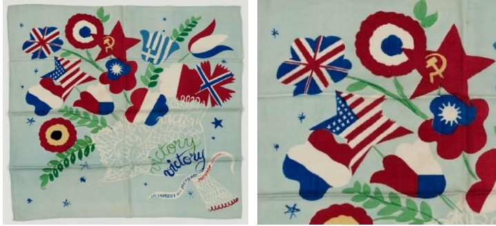
Görsel 10: “Victoire”, 88 cm x 83 cm, 1945 (URL-6).

Görsel 9’da sağ alt köşesinde “Le Ballet des Echarpes (Jacqmar’ın Eşarp Balesi)” yazısı bulunan eşarpın görüntüsüne, Boston Güzel Sanatlar Müzesi (MFA Boston) koleksiyonlarına ait dijital arşivden ulaşılmıştır (URL-17). Açık gri-mavi zemin üzerinde uçan yelpazeler dans eden balerinlerin eteklerine dönüşmüş, balerinlerin arasına renkli kurdeleler yerleştirilmiştir. Eşarpın alt kısmında dalgalanan mor perde ve üst kısmındaki savaş dönemine ait Jacqmar eşarp tasarımları dans eder gibi görünmektedir. 1945 yılına ait bu tasarım aynı zamanda savaşın biteceğinin müjdesini vermek ister gibi hazırlanmıştır.