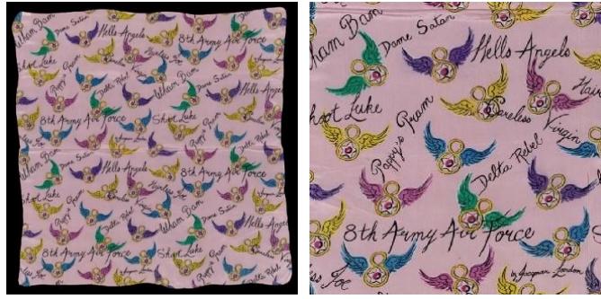
Görsel 5: "8th Army Air Force", 85 cmx 88 cm, 1940 (URL-15).

"8th Army Air Force" eşarp tasarımında, pembe zemin rengi üzerine siyah el yazısı ile kişi isimleri ve "8th Army Air Force (8. Ordu Hava Kuvvetleri)" yazısı bulunmaktadır (Bkz. Görsel 5). Eşarbin tüm yüzeyinde parlak renkli (kırmızı, mavi, yeşil, mor, sarı) kanatları olan Hava Kuvvetleri sembolleri yerleştirilmiştir. Köşeye "JACQMAR" yazısı basılmıştır (URL-15). 8. Ordu adına hatıra eşyası olarak tasarlanan eşarp suni ipekten üretilmiştir (URL-1).