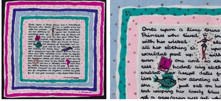
Görsel 13: “Once Upon a Time”, 91 cm x 88 cm, 1947 (URL-20).

Londra barlarının adlarının dört kenarda el yazısı ile sıralanmış olduğu, cesur ve klasik bir tasarım yaratmıştır(URL-19). Suni ipekten yapılan kare eşarbin dört köşesinde farklı bar sahnelerinin yer aldığı, ortasında “Time Gentlemen, Please” ve köşesinde “Jacqmar London” yazısı bulunduğu görülmektedir.