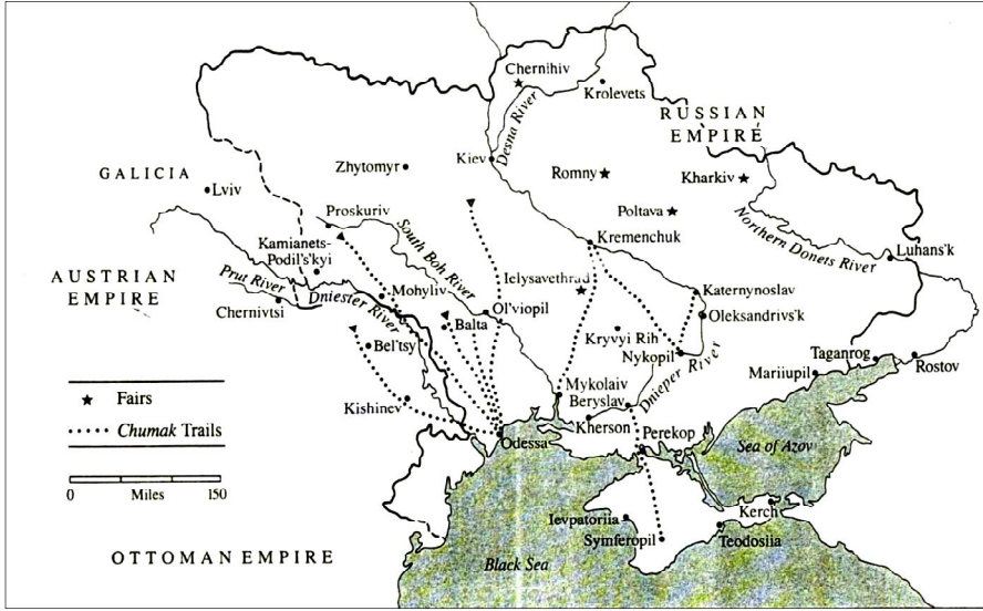
Harita 2: 18. Yüzyıl sonlarında Rusya'nın Kuzey Karadeniz'de Ticaret Ağları 53