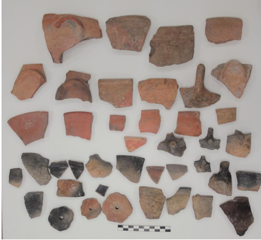
Resim 8. Killi Höyük İTÇ Çanak Çömlek Buluntuları