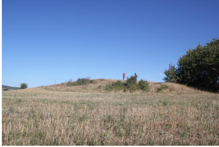
Resim 4. Hüsümler Höyük, güneyden

İlk kez 2016 yılı Bilecik İli yüzey arařtırmalarımız sırasında saptanan höyük tarafımızdan Hüsümler Höyük olarak adlandırılmıřtır. Hüsümler Höyük, Bozüyük Yeni Mahalle (4 Eylül Mahallesi), Gerençayırı mevkiinde, Hüsümler ovasında, Koca Dere ile onun bir kolu olan Ana Dere'nin birleřtiđi noktanın hemen doğusunda yer alır ( Resim 1 ). 100 x 125 m boyutlarında olan höyüğün ova seviyesinden yüksekliđi yaklaşık 8 metredir ( Resim 4 ). Höyük üzerinden gelen malzeme yoğun olarak İTÇ II ve III Dönemlerini içermektedir ( Resim 5 ). Kahverengimsi kırmızı astarlı ve ačkılı mallarla temsil edilen çanak çömlek parçaları yüzeyden toplanan malzeme içinde yoğun grubu oluřtırmaktadır. Formların çođunluđu ise basit profilli kase parçalarına aittir; bunun yanı sıra ilmik kulplu kaseler, basit ve keskin 's' profilli kaseler, kesik gaga ađızlı testiye ait bir parça, üç ayaklı mutfak kabına ait ayaklar, omfolos dip parçaları Geç İTÇ II'ye tarihlendirilen ve Frigya kültür bölgesi içinde yer alan Demircihöyük çanak çömlek grubu özelliklerini yansıtan Küçük Höyük mezarlık buluntuları ile çok yakın iliřkilidir. Bununla beraber, höyük üzerinden toplanan çanak çömlek parçaları içinde Demircihöyük için karakteristik olan siyah ađız kenarlı mal ( Black topped ) yok denecek kadar az sayıda bulunması, diđer mal ve form grupları burada ele geçen çanak çömleđin İTÇ II sonları ve İTÇ III'e tarihlendirilmesinde en önemli etkindir.