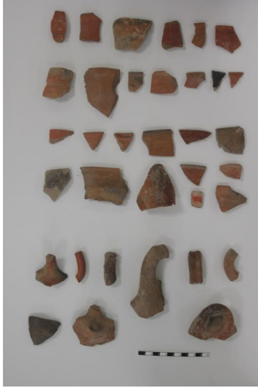
Resim 5. Hüsümler Höyük İTÇ Çanak Çömleği