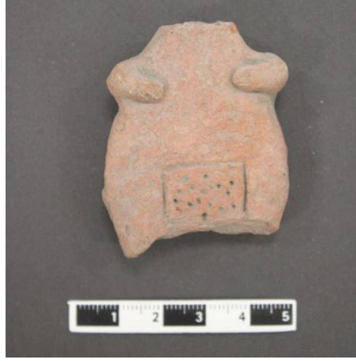
Resim 9. Killi Höyük İTÇ pişmiş toprak idol parçası