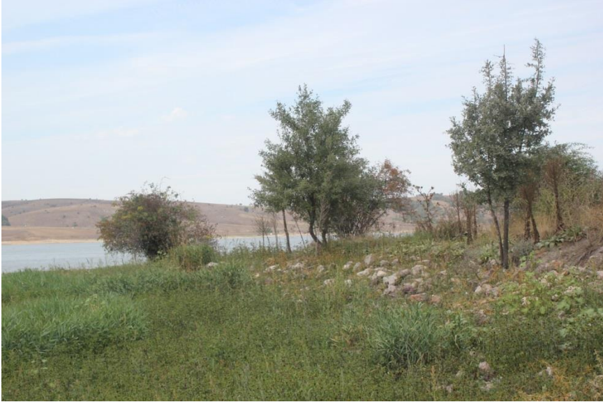
Resim 7 . Höyüğün kuzeyinde oluşan kesit ve glacis