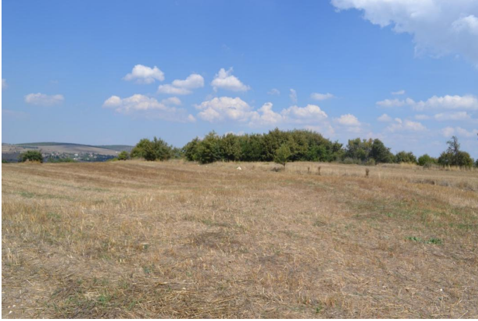
Resim 6. Mantarlık Höyük, doğudan

Mantarlık Höyük, 180x250 m boyutlarındadır; bununla beraber höyüğü çevreleyen tarlalara dek arkeolojik malzeme yayılmıştır. Özellikle bu tarlalarda yoğun olarak bazalttan ezgi taşı parçalarına rastlanmıştır. Höyük üzerinde bir adet yeni çeşme yer almaktadır; olasılıkla su taşımak için höyüğün kuzeydoğusunda bir kanal açılmıştır. Höyük üzerinde ve çevresinde İlk Tunç Çağı II, Orta Tunç Çağı'na Geçiş (Geç İTÇ III) ile çok az sayıda Neolitik ve Kalkolitik Dönemlere tarihlenen çanak çömlek parçaları ile yontmataş alet parçalarına rastlanmıştır .