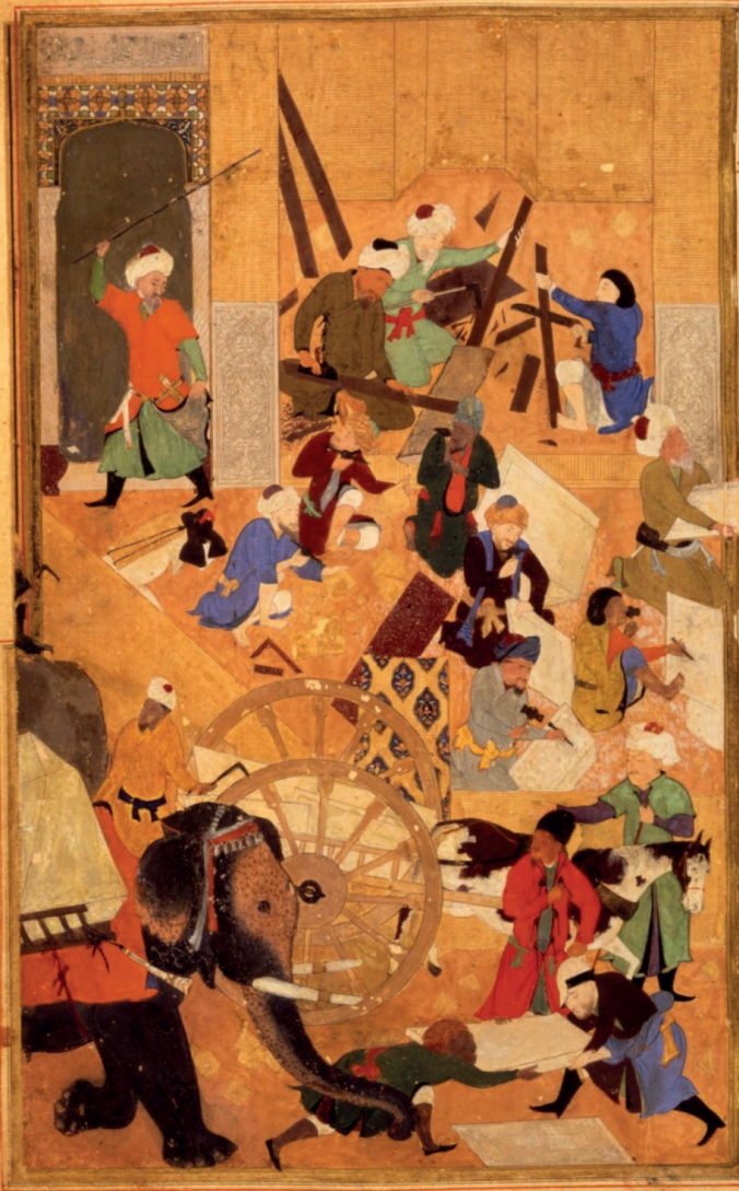
Şekil 5. Semerkand'da Bibi Hanım Camisi'nin inşasında fillerin kullanımı, resimleyen: Behzad. (Şerefüddin Ali Yezdi, Zafarnâme , 1467/1468, John Work Garrett Library John Hopkins University, Baltimore, Maryland).

uğrayarak kendisini ziyaret eden Fatih Sultan Mehmed'den Kızılırmak üzerine bir köprü yaptırmasını isteyen Koyun Baba, Sultan'ın sözünü yerine getiremeden vefat etmesi üzerine oğlu II. Bayezid'in rüyasına giderek babasının verdiği sözü hatırlatmış ve köprü'nün inşasına bu kerameti ile aracı olmuştur. 164