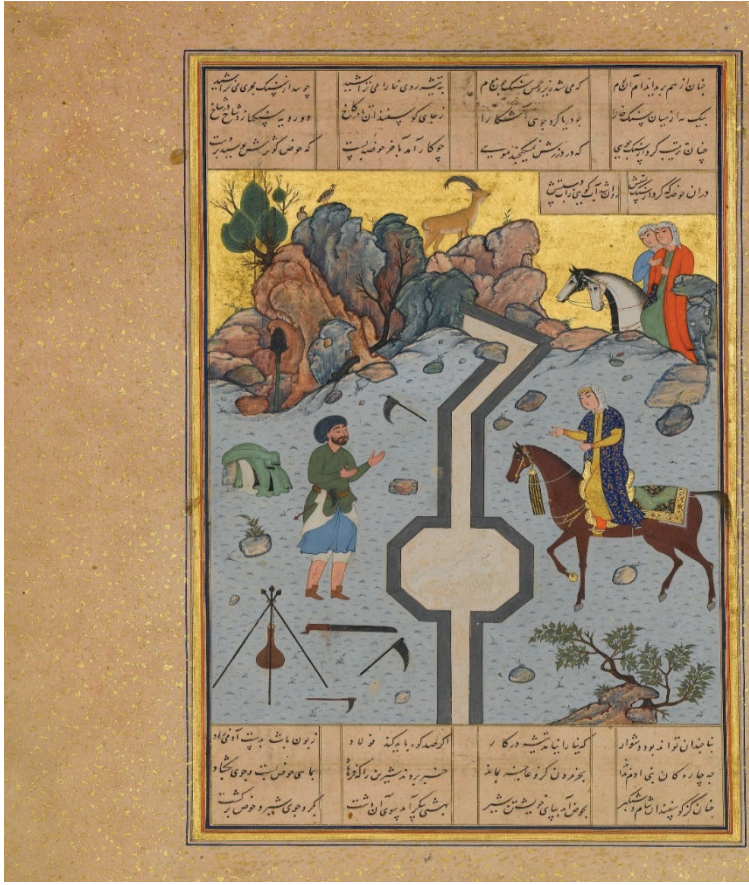
Şekil 4. Ferhad, Şirin için bir süt kanalı kazıyor (Nizami-i Gencevi, Hamse, 931/1524-1525 Safevi Yazması) (Metropolitan Museum, 13.228.7.5).