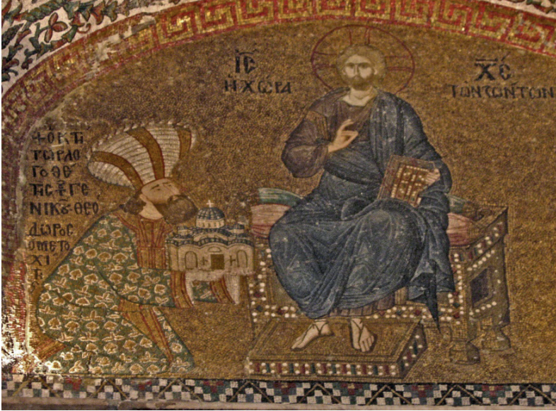
Şekil 9. Theodoros Metokhites'in Khorra Manastırı'nın modelini Hz. İsa'ya sunduğunu sahneleyen mozaik, Kariye Müzesi.

Türk hükümdarların da mimarlığa ilgi duyduğu, mimariye yön verdiği hatta bizzat yapı tasarımını üstlendikleri bilinir. Ahmed ibn Tolun'un (ö.884) Kahire'deki cami inşası sırasında elindeki kağıda spiral şeklini vererek minarenin böyle olmasını istediği kayıtlara geçmiştir. 202 Gazneli dönemi tarihçilerinden Beyhakî (ö.1077), Sultan I. Mesud'un (ö.1040) Belh, Nişabur ve Leşker-i Bazar'da bulunan sarayların tasarımını yaptığını bildirir. 203 Anadolu Selçuklu müelliflerinden İbn Bibi (ö.1296?), Alaeddin Keykubad'ın (ö.1237) Beyşehir Gölü civarındaki Kubadabad Sarayı'nın yerini kendi seçerek tasarımını da bizzat yaptığını, binanın inşasını ise daha sonra Selçuklu tahtında hak iddia ettiği için öldürülen emir-i mimar Sadeddin Köpek'in (ö.1239?) üstlendiğini bildirir. 204 Diyarbakır'da bulunan Yedi Kardeş Burcu'nun kitabesi, yapının planının Artuklu hükümdarı Melik Salih (ö.1364) tarafından yapıldığı ilan eder. 205