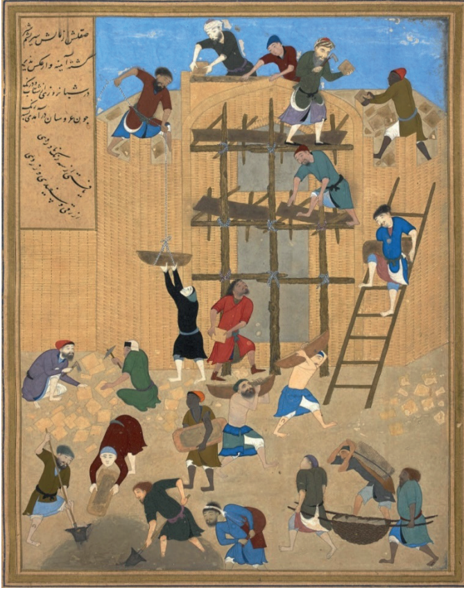
Şekil 2. Havarnak'ın inşası, resimleyen: Behzad (Nizami-i Gencevi, Hamse , Herat, 1494/1495, British Library, OR. MS. 6810 fol. 154b).