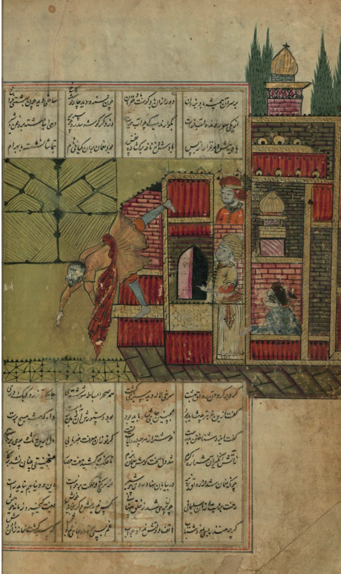
Şekil 3. Nu'man, Sinimmar'ı Havernak köşkü burçlarından aşağı atıyor (Nizâmî-i Gencevî, Hamse , XVII. Yüzyıl Safevî Yazması, The Walters Art Museum, W612.186B).

Anlatının gerçekliği ve kahramanı Sinimmar'ın kim olduğu konusu, çeşitli araştırmalara konu edilmişse de bir sonuca ulaşılamamıştır. 33 Ancak Sinimmar anlatısı, özellikle mimarlar