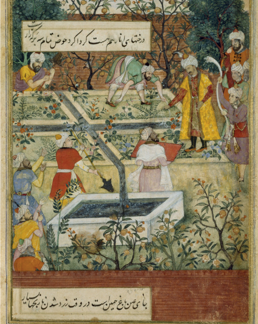
Şekil 10. Babür Şah, Kabil’de bulunan Bağ-ı Vefa’nın inşasına nezaret ediyor ( Babürnâme , 1590, Victoria and Albert Museum IM.276-1913).

Anlatıların merkezinde her zaman bir yapı bulunur. Yapı hem dekor, hem de anlatının ana aktörüdür. Çoğu zaman, mimar/usta ile ilgili motifler ekseninde şekillenen anlatılar, İstanbul’da Ayasofya ve Süleymaniye, Edirne’de Selimiye, Divriği’de Ulu Cami gibi yapılar hakkında türetilmiş onlarca efsanede çeşitli farklılıklarla tekrarlanır. Özellikle, Ayasofya ve Selimiye’nin, Türkiye’de çeşitli yapılar için anlatılagelen çoğu efsanenin bir uyarlamasına konu edildiği,