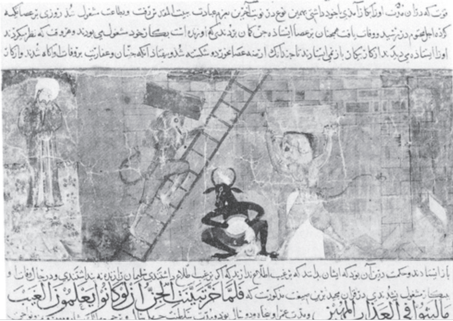
Şekil 6. Doğaüstü varlıklar, Hz. Süleyman’ın emrinde inşa faaliyetlerinde görev alıyor (Sarit Shalev-Eyni, “Solomon, his Demons and Jongleurs: the Meeting of Islamic, Judaic and Christian Culture”, Al-Masâq 18/2 (2006)).

(ö.1503?), Ayasofya’da bulunan sütunların Hz. Süleyman’ın emrinde çalışan devler, cinler ve perilerin Kaf Dağı’ndan çıkardıkları sütunlar olduğunu söyler. 177 Sütunları Ayasofya’ya taşıyan devlerden birinin kendinden bir işaret kalması için sütunlardan birine vurarak el izini bıraktığı rivayet edilir. 178 Yapının inşası sırasında bir meleğin ustaların başına bir şey gelmemesi için onlara nezaret ettiğine inanılır. 179 Celâl-zâde Mustafa, Târih-i Kala-ı İstanbul ve Ma’bed-i Câmi-i Ayasofya adlı eserinde inşa süreci maddi nedenlerle yarıda kalınca, bir meleğin mimara yapının tamamlanması için gerekli olan hazineyi teslim ettiğine dair bir efsaneyi aktarır. 180