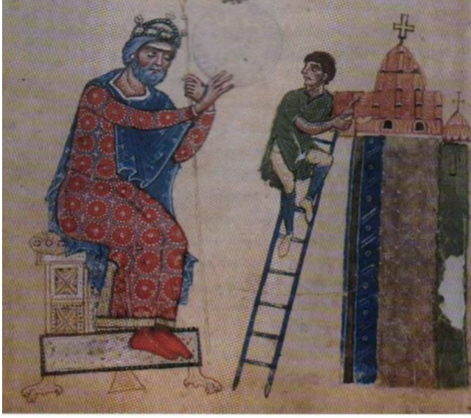
Şekil 7. Mimara kıyasla devasa boyutlardaki imparator İstünyanos, Ayasofya'nın inşasını yönetiyor ( Chronicon Sanctae Sophiae , (Cod. Vat. Lat. N. 4339), Roma, Biblioteca Vaticana.)