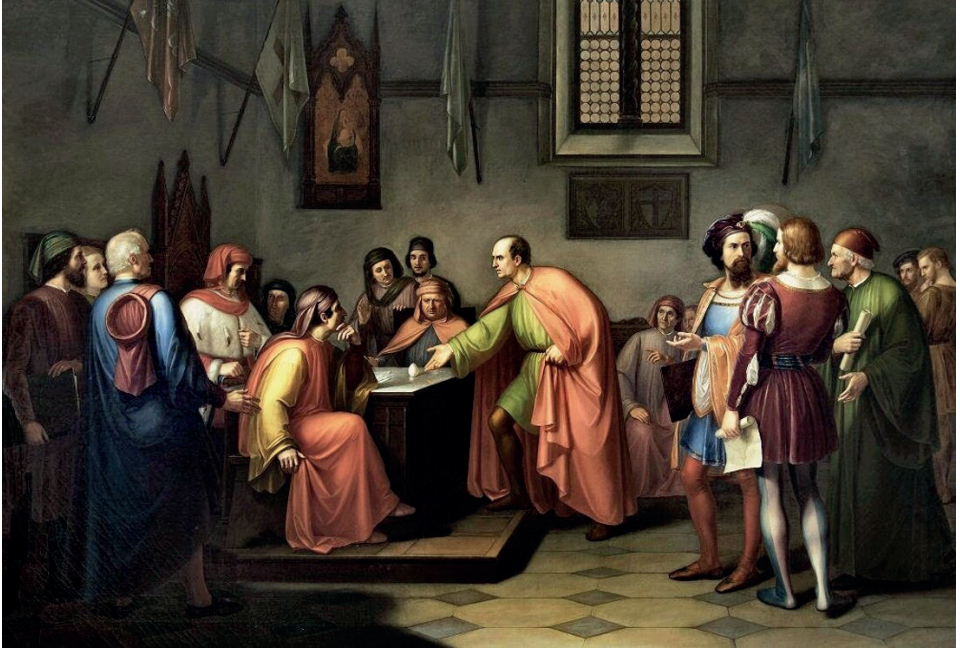
Şekil 1. Filippo Brunelleschi yumurtayı dik tutarak teorisini kanıtlıyor (Giuseppe Fattori, 1878).