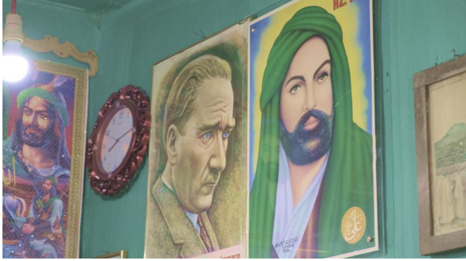
Görsel 4. Dikmen Baba Tekkesi

Anadolu'nun en doğusunda bulunan bir Alevi köyü ile Balkanlardaki bir Bektaşî Türkmen köyünde icra edilen nefes ve deyişlerin sözleri aynı havuzdan seçilmektedir. Şiirleriyle bu havuzu besleyen aşık, ozan, baba, dede, Abdal vb. adlarla andığımız şairlerin hemen hepsi Anadolu'da yaşamış ya da doğmuştur ve istisnasız hepsinin ve eserlerinin dili Türkçedir. Pek çoğu sadece şair değil Bektaşilik yolunda temsil kabiliyetine sahip olmuş birer yol ulusu olarak da görülmektedir ve bu nedenle şiirlerine de kutsallık atfedilmektedir. Söz varlığı, Türkiye sahasında da hem Alevi-Bektaşî nefes ve deyişleri arasında hem de farklı yörelerde bulunduğu için farklı müziksel dokuya sahip olan Alevi deyişleri arasında türdeşlik yaratmaktadır (Özdemir, 2021: 77). Türkiye'de icra edilen Bektaşî nefeslerinin sözlerinin Alevi deyişleriyle aynı olmasına karşın üslup, form ve çalgısal tercih neticesinde iki farklı müzikal yapı ortaya çıkmaktadır. Söz yapısının benzer olmasına rağmen özellikle Orta ve Doğu Anadolu Alevi deyişleriyle, Akdeniz ve Ege kıyılarında yaşayan bir diğer Alevi Türkmen grup olan Tahtacıların müzikleri de belirgin farklılık içermektedir. Sonuç olarak Bektaşî edebiyatı başlığı altında ele alabileceğimiz bir söz dağarının varlığından bahsedilebilir. Müziksel açıdan ise durum farklı işleyebilmektedir.