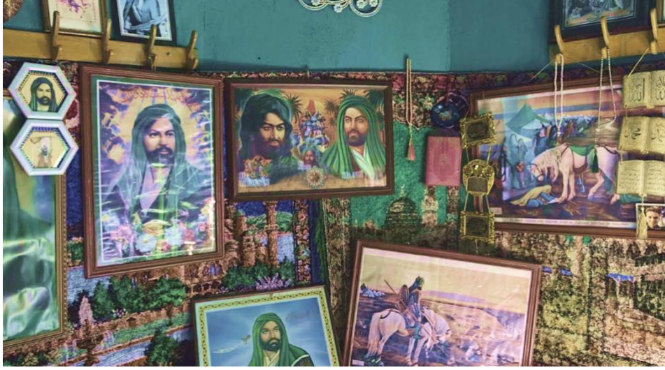
Görsel 6. Dikmen Baba Tekkesi

Herhangi bir milli kültür dairesinde varlık gösteren herhangi bir zümre, adları ve temel doktriner kaynakları ne olursa olsun yaşadıkları kültür evreninin birer parçası ve tamamlayıcısıdır. Örneğin Aşık müziği olarak adlandırdığımız icra üslubu ve ezgi dağarı, aşıkların bulunduğu yörelerin müziklerinin bazen sözel doku bazen de performans türüyle özellik kazanmış bir alt grubudur. Benzer şekilde Erzincan Alevi Türkmenlerinin müziği de Erzincan'ın genel müziksel yapısından farklı değildir. Bu bağlamda Balkanlarda Bektaşi Türkler tarafından icra edilen müzik de Rumeli ya da Balkan Türk müzikleri genel başlığının altında değerlendirilmesi gereken kültürel unsurlardır. Yani Makedonya Türklerinin müziklerini ele aldığımızda Kanatlar Köyünde icra edilen nefeslerle, İştîp'in Şaşvarlı köyünden bir Yörük (Sünni) kadın kaynaktan derlediğimiz türkülerin müziksel benzerliğinin olması bizi şaşırtmadığı gibi müziğin coğrafi olmaktan öte milli kültür ile ilgili bir yapı olduğu yönündeki düşüncelerimizi de pekiştirdi. Ancak elbette Bektaşilik Türk kültürü içerisinde ve de müziğin etkin rol oynadığı ayrı bir kültürel koridor olduğu için çeşitli farklılıkların olmaması da düşünülemez.