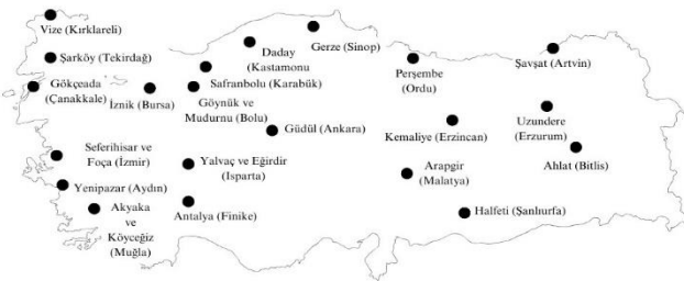
Şekil 2. Türkiye'deki sakin kentler haritası

2024 yılı itibarıyla, Türkiye'deki sakin kent sayısı, 25'e yükselmiştir. Türkiye'deki mevcut sakin kentler ve buldukları iller şu şekildedir: Vize (Kırklareli), Gökçeada (Çanakkale), İznik (Bursa), Seferihisar (İzmir), Foça (İzmir), Yenipazar (Aydın), Akyaka (Muğla), Köyceğiz (Muğla), Gerze (Sinop), Gönük (Bolu), Mudurnu (Bolu), Yalvaç (Isparta), Eğirdir (Isparta), Finike (Antalya), Güdül (Ankara), Perşembe (Ordu), Kemalîye (Erzincan), Uzundere (Erzurum), Şavşat (Artvin), Arapgir (Malatya), Ahlat (Bitlis) ve Halfeti (Şanlıurfa). Şarköy (Tekirdağ), Safranbolu (Karabük), Göynük ve Mudurnu (Bolu), Güdül (Ankara), Arapgir (Malatya), Ahlat (Bitlis) ve Daday (Kastamonu). Sakin kentlerin ülkenin farklı bölgelerinden seçilmesi, ülkedeki doğal, tarihi, kültürel zenginliğin tanınmasına da katkıda bulunmaktadır. Aşağıda Şekil 2.'de gösterilen ve farklı bölgelerden seçilen sakin kentlerin bazılarını, sakin kentleri daha iyi anlayabilmek adına açıklamakta fayda vardır.