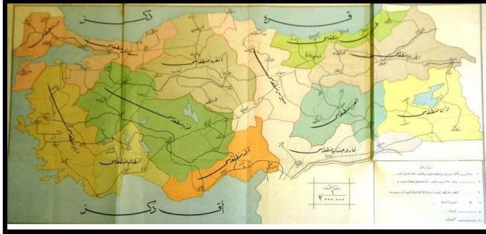
Harita 1. Maarif Vekaleti Mıntıka Eminlikleri