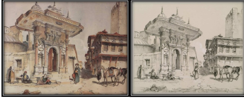
Resim 1: İngiliz Ressam Lewis'in 1836 yılında basılan albümünde yer alan Soğukçeşme Sokağı'na ait gravür. Sağdan ilk konak Nâzikî Tekkesi'dir. [URL1]. (O tarihlerde tekke, Mudanyalizâde Tekkesi olarak bilinmektedir.)