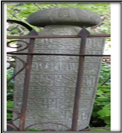
Resim 3: Ahmed Nâzikî'nin Mezar Taşı (Yaman, 2019: 176)

Ahmed Nâzikî Efendi, 1272 Ramazan/14 Mayıs 1855 yılında vefat etmiştir. Kabri Mehmed Nasûhî Dergâhı haziresindedir. Mezar taşının hattatı ortanca oğlu Hattat Mehmed Hamdi Efendi'dir (Köseoğlu, 2022: 201). Mezar taşında şunlar yazılıdır: