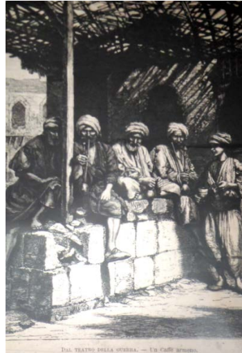
Fig. 7. Ermeni Kahvesi