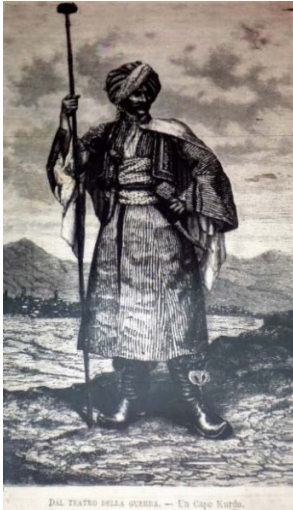
Fig. 6. Kürt Lideri