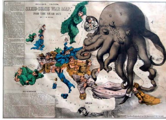
Fig. 2. 1877 Yılı'nın Yarı Şaka Yarı Ciddi Savaş Haritası (İngiltere)