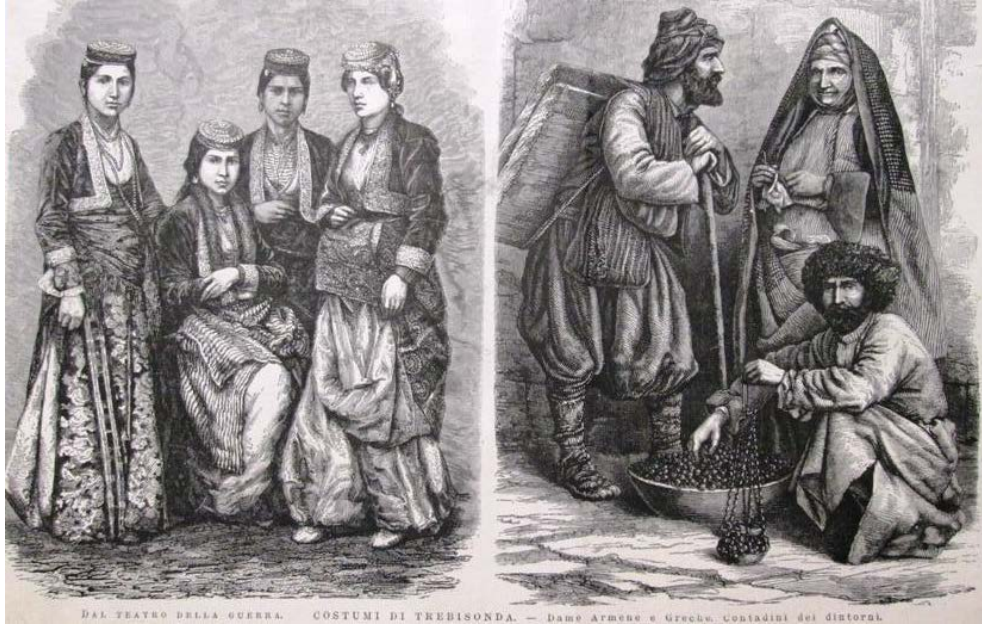
Fig. 5. Trabzon Kostümleri - Ermeni ve Yunan Kadınları - Yerel Çiftçiler (İtalya)