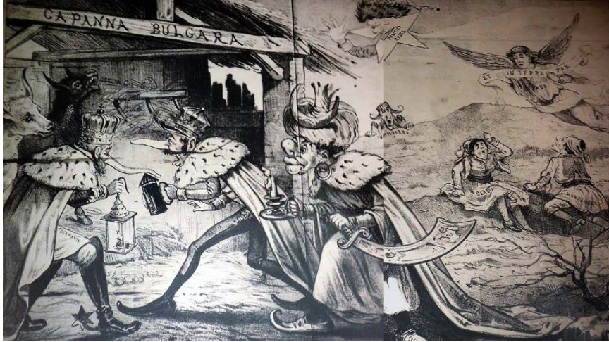
Fig. 12. Münecimler Hakkında / Bulgar Kulübesi

fiziksel görünüşleri özellikleri üzerinden oluşturulmuş; figürlerin yüz ve beden yapısı, fiziksel görünüşleri, giyim tarzları, yaşam alanları, ibadethaneleri vb. sahip oldukları nitelikler onların kültürlerini göstermiş, böylelikle çok uluslu olan Osmanlı İmparatorluğu'nda yaşayan tüm millet ve etnik kökene sahip halkların kültürel kodları görsel olarak tanımlanmıştır.