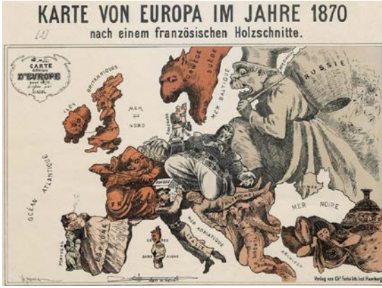
Fig. 1. 1870'de Avrupa Haritası (Almanya ve Fransa)