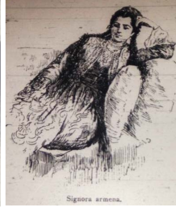
Fig. 11. Ermeni Kadın