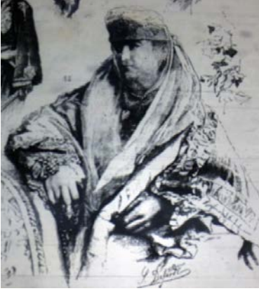
Fig. 9. Çerkez Kadın