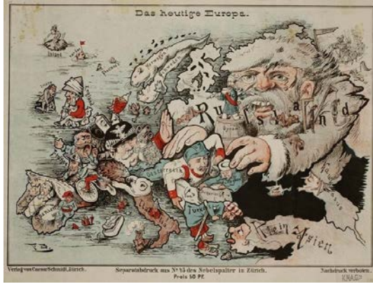
Fig. 3. Bugünkü Avrupa, 1887 (İsviçre)