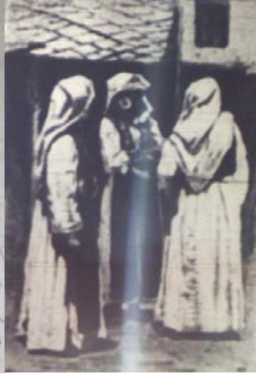
Fig. 10. Bosnalı Kadınlar