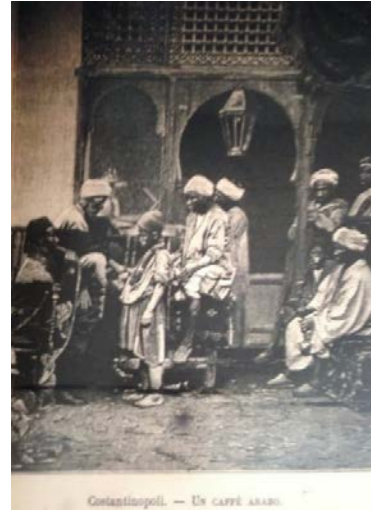
Fig. 8. Arap Kahvesi

Avrupa basınında sıklıkla karşılaşılan görsel metinler arasında Osmanlı imgesi (genellikle Türk, Ermeni, Mısırlı, Arap, Balkan halkları ve Kürt olarak milli ya da etnik kimlikleri üzerinden adlandırılmış ve tanımlanmış biçimde) içerikli millet veya etnik kimlikleri tanıtıcı nitelikteki haberler de bulunmaktadır. Bu tarz haberler yalnızca resimli gazeteler olan illüstrasyon gazetelerinde değil, yazılı basın olarak değerlendirilebilecek gazetelere de konu olmuştur. Kendi içinde siyasi, kültürel ve karikatür nitelikli olarak sınıflandırabileceğimiz bu çizimlere sadece ulusal ve yerel gazetelerde değil, çocuklara yönelik masalların ve hikâyelerin yer aldığı yayınlarda dahi rastlamak mümkündür. Gerek siyasi ve askeri konuları ele alan gerekse imparatorluğun günlük yaşam pratiklerini içeren haber içeriklerinde; söz konusu içerikleri görsel olarak da pekiştirmeyi amaçlayan kent görünümünün, dinî konuların ve sanat eserleri içerikli haberlerin de Osmanlı İmparatorluğu'ndaki etnik milliyetçilik ayrıştırmasının altını çizen niteliklerde karşımıza çıktığı görülmektedir (Figür 9, 10 ve 11. Figür 9, L'illustrazione Italiana, 23 Eylül 1877, Yıl: 4, Sayı: 38, Sayfa: 197; Figür 10, L'illustrazione Italiana, 3 Aralık 1905, Yıl: 32, Sayı: 49, Sayfa: 550 ve 553; Figür 11, L'illustrazione Italiana, 17 Kasım 1895, Yıl: 22, Sayı: 46, Sayfa: 308 ve 315).