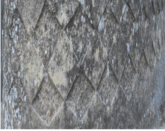
Foto 119. 1913 tarihli ayak taşı