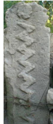
Foto12-13-14.Ravanda köyü sandık mezar. Tarihi yok