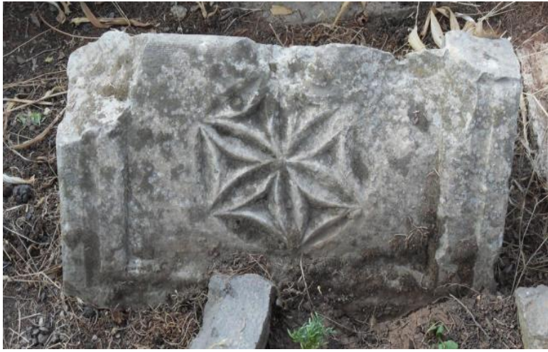
Foto 84. 6 yapraklı çiçek. M.1956 Asri mezarlık