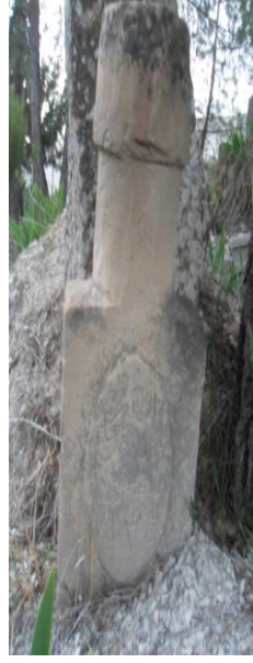
M.1935 ( Ravanda köyü)