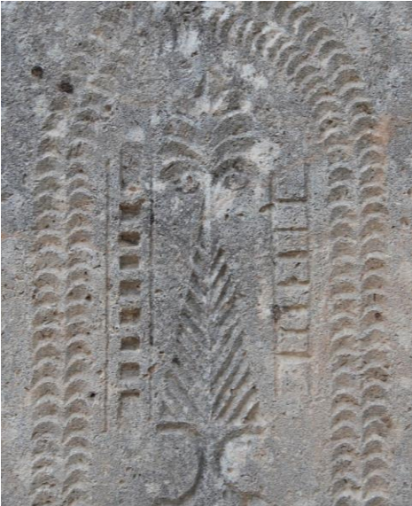
M.1916 (Asri mezarlık)