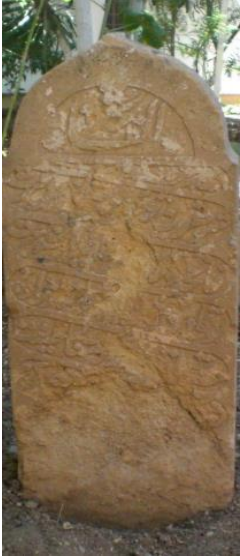
Tarihsiz Şeyh Efendi Dergahı ayak taşı