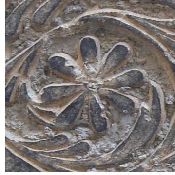
H.1340/M.1921 (Tekke cami)