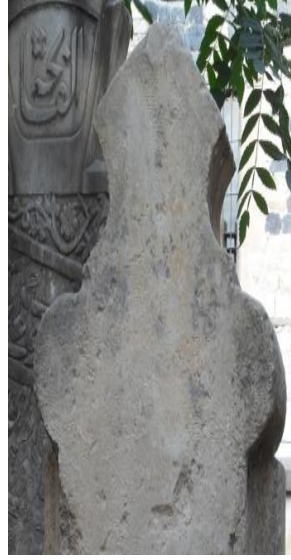
M.1906 (Tekke cami) ayak taşı