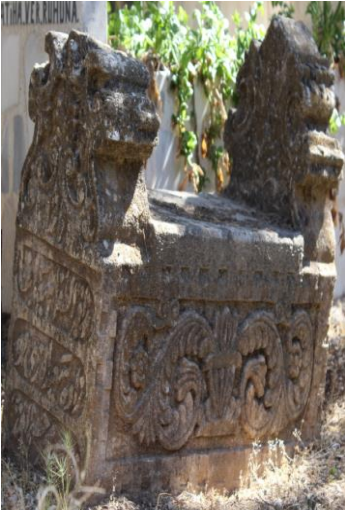
H.1330/M. 1911 (Asri)

3.Sanduka tipli mezarlar, genelde tek parça taştan oyulan mezarlardır. Mezarlar baş ve ayak şahide' li(Foto113-15) ve şahide' si olmayan(Foto 16-17) biçiminde iki grupta incelenmiştir. 4 tane Asri mezarlıkta, 1 tane ise Tekke cami haziresinde bulunmaktadır. Sanduka tipli mezar yapılarının en erken tarihlisi Tekke cami haziresin de bulunan M.1904 tarihli mezardır. Asri mezarlıkta bulunan en geç örnek M.1956 tarihini göstermektedir. Diğer iki örnek M.1935 tarihine aittir. Kastamonu Atabey Gazi cami ve türbe haziresin de ki 16 mezar (Çal,2008:5), Samsun merkez ve kıyı şeridindeki mezarlardan 50 tanesi bu biçimdedir (Nefes,2002:173-176). Ayrıca Edirne Üç Şerefeli cami haziresinde 4 adet mezar (Arslan,2007:471), Kozan mezarlarından 2 adet mezar (Demir,2010: 22) sanduka tipli mezar biçimdedir.