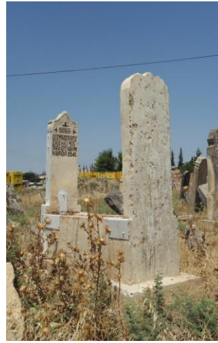
Foto15-16. Eski mezarlık sandıklı mezar. M.1941

2.Kapak taşlı mezar , farklı yapılaş biçimleri olsa da kendi içerisinde iki gruba ayrılır. Birinci grupta yer alan mezarların ortasında oval bir çukur ya da açıklık bulunmaktadır(Foto7-9). İkinci grup ise baş ve ayak taşlarının arası yaklaşık 10-20 cm blok taşlarla düz bir biçimde kapatılarak bir platform meydana getirilmiştir(Foto10-12) örneklerden oluşmaktadır. Toplamda 23 örnekten oluşan bu grup mezar taşlarının 11 tanesi asri mezarlıkta, 9 tanesi Tekke cami haziresinde, 2 tanesi Eski mezarlıkta, 1 tanesi Belenözü Ravanda köyü'n de yer almaktadır. Tekke cami haziresinde yer alan mezar taşlarının en erken tarihli M.1828, en geç tarihli M.1927 yılına aittir. Diğer mezarlıklarda yer alan taşların tarihi bulunmamaktadır. Kilis'te kapak taşlı mezar yapım oranı yüksektir. Genellikle kapak taşının ortasında bir açıklık bulunurken, Kilis'teki örneklerde bu açıklık çukur bırakılmış ve kuşların su içmesi için yapılmış izlenimi vermektedir. Kullanılan malzeme ve yapılaşları bakımından farklılıklar bulunsa da işlevleri itibariyle, Kastamonu Atabey Gazi cami ve türbesi mezar taşlarından 2 örnek (Çal,2008:5), Kastamonu'daki mezarlardan 17 tanesi (Canyurt,2007:158) bu şekilde mezarlardan oluşmuştur. Yine Bursa Emir Sultan mezarlığında ki 18 ve 19 yüzyıl mezar taşlarından 36'sı (Çakar,2007:462), Kozan mezar taşlarından 2 örnek (Demir,2010: 21) kapak taşlı mezar biçiminde yapılmıştır.