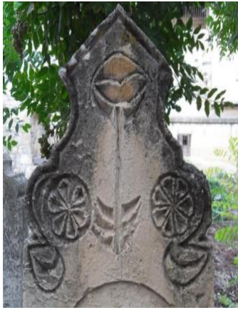
H.1244/M.1828 (Tekke cami)