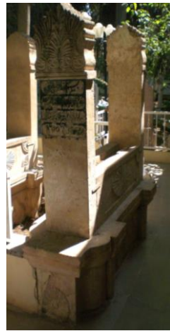
H.1300/M Şeyh Efendi dergahı