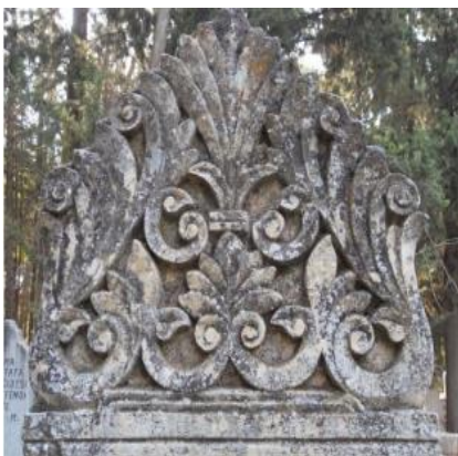
Tarihsiz (Asri mezarlık)

En yoğun kullanılan bitkisel motif kenger yaprağıdır(Foto94-96). İncelenen mezar taşlarında 14 tanesinde bu motif görülmüştür. Akantüs olarak da bilinen bitkinin 200'den fazla çeşidi bulunmaktadır. Türkçe 'Ayı Pençesi' olarak adlandırılan bitkinin yaprakları geniş ve çiçekleri asimetriktir. 4-5 dilimli çanak ve 5 dilimli taç kısmından oluşur. Genellikle palmet motifiyle birlikte ve bitkisel süslemeye yoğunluk kazandırmak amacıyla yapılmış olmalıdır. Tek başına kullanıldığı örnek yoktur. Neredeyse tamamı baş ve ayak taşı tepeliklerinde bulunmaktadır. Bursa Emir Sultan mezarlığında ki 18-19. yüzyıl mezar taşlarından 89 (Çakar,2007:494), Edirne Üç Şerefeli cami haziresi mezar taşlarından 27 (Arslan,2007:450)örnekte kenger yaprağı mevcuttur. Samsun mezar taşlarından 20 (Nefes,2002:191) Kastamonu Atabey Gazi cami ve haziresinde 15 (Çal,2008: 34)mezar taşında kullanılmıştır. Çorum mezar taşlarından 9 (Sevin,2008:255), Giresun ili sahil şeridindeki Osmanlı mezar taşlarından 8 (Çal-İltar,2011:382), Kastamonu Ferhat Paşa cami haziresi mezar taşlarından 10 (Gündoğan,2007:280) örnekte kenger yaprakları görülmektedir. Motifin yer aldığı mezar taşlarının tamamı 1910 sonrasına aittir. En eski tarihli 1912, en yenisi ise 1954 tarihli dir.