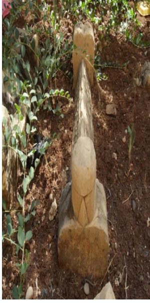
M.1904 ( Tekke cami)