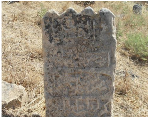
Foto 66. Testere dişli tepelik

Gövdesi dikdörtgen yatay kesitli başlıksız testere dişi tepelikli (Foto 66), Kilis'te 1 örneğine Eski mezarlıkta rastlanılan bu tip mezar taşları Kilis'te en az kullanılan tiptir. Aslında Kilis Kültür Envanteri adlı kitapta bir örneği daha vardır; ancak bulunamamıştır.