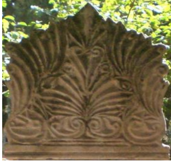
M.1936(Şeyh efendi dergahı)