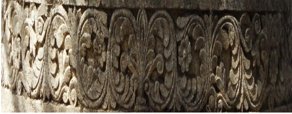
Foto 97. Kıvrım dal uygulaması

boş yer bırakılmaksızın kullanılmıştır. Tekke Camisi Haziresindeki 6 örnekte, Yeni Dünya Mezarlığındaki 2 örnekte ise kitabe altında ve üstünde boş kalan kartuşları doldurmak için kıvrım dal uygulamıştır. İncelenen örneklerden en eskisi 1896 tarihli kadın, en yenisi ise 1927 tarihli erkek mezar taşında yer alır. Genellikle 1900-1920 yılları arasında kıvrım dal yoğun olarak kullanılmıştır. Kıvrım dallar Kilis'teki bütün örneklerinde yatay olarak uygulanmış ve kendine özgü bir tarz oluşturmuştur.