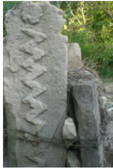
Foto 143. Yılan motifi

Figürlü süsleme örneği ise Ravanda köyündeki toplama mezarın ayak tarafına konulan taşta yılan benzer bir motifte görülmüştür(Foto 143). Burada kesin sonuç elde edilememiştir. Yaptığımız değerlendirmelerde motifin uç kısmındaki daire, güneş; alt kısım zik-zak olarak da düşünülmüştür. Ancak bu motifin tepeden aşağıya doğru incilmesi yılan olabileceği fikrini de doğurmaktadır.