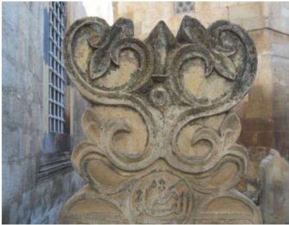
Foto103. Lotus. M.1902 (Tekke cami haziresi)

Lotus, 1902 tarihli bir erkek mezarına ait baş taşı tepeliğinde yer alır(Foto 103). Barok tarzda; yüksek kabartma ve eğri kesim teknikleri kullanılarak oluşturulmuştur. Burada motif karşılıklı S- C kıvrımlarıyla ve bunları palmet ile birleştirerek ortaya çıkarılmıştır. Kilis'te kullanım oranı düşüktür.