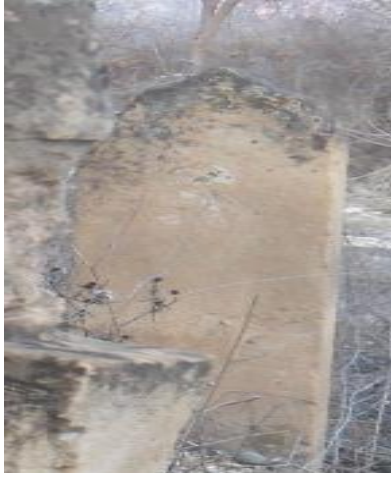
Foto55. M.1911 tarihli taş

tepelikler kullanılmıştır. Anadolu'da ki örneklerde yaygın kullanımı söz konusu iken Kilis'te sadece iki örnek görülmektedir.