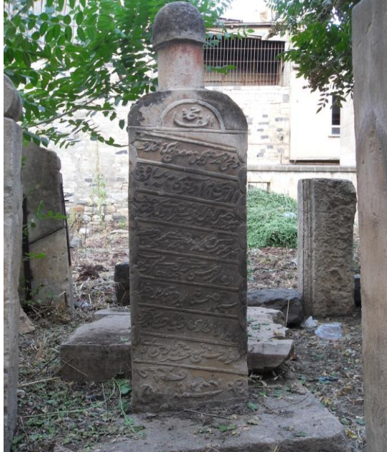
Foto80. Azizi başlıklı mezar taşı

Üçüncü grubu ise üst kısmı dar, boyu kısa ve alt çapı üst çapına göre daha geniş yapılmış, takke görünümlü fes oluşturmaktadır. Sultan Abdülaziz döneminde kullanıldığı için Azizi adı verilmiştir. Burada sarık yoktur. Çok benzer olmasalar da Kastamonu Atabey Gazi cami ve türbe mezar başlıklarından 3 tanesi (Çal,2008: 19) bu tipe yakındır. Bir örneği bulunan bu tip 1870 tarihli bir mezar taşındadır(Foto80).