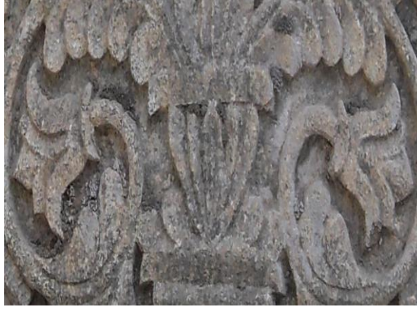
Foto 104. Palmet motifi Asri mezarlık

Palmet, Kilis'te 29 mezar taşıyla uygulanma oranı en yüksek süsleme motifidir(Foto 104). Kilis mezar taşlarında palmet hemen bütün örneklerde S-C kıvrımlarıyla ve akant yapraklarıyla birlikte işlenmiştir. Barok tarzda oyma ve eğri kesim teknikleriyle yapılan palmetler özellikle mezar taşlarının tepelik kısmında yer alır. 3, 5 ve 7 yapraklı