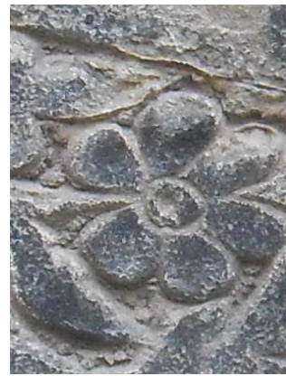
Foto85-91. Altı ve sekiz yapraklı çiçek uygulamaları

Gül bezek( Gülçe-Rozet) motifi(Foto92-93) 2 örnekte bulunmaktadır. Her iki örnekte eğri kesim tekniği ile yapılmıştır. M.1912 tarihli erkek, M.1916 tarihli çocuk mezarına aittir. Bursa Emir Sultan mezarlığında ki 18-19 yüzyıl mezar taşlarından 33 tanesinde (Çakar,2007:494), Samsun mezar taşlarından 1 tanesinde (Nefes,2002:192) gül bezek motifi yer alır.