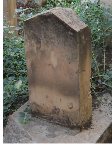
Foto56. M.1920 tarihli taş

Üçgen prizma gövdeli, üçgen kesitli piramidal tepelikli , mezar taşından 5 örnek(Foto57-61) bulunmaktadır. Burada dikkat çeken unsur dikili taşların herhangi bir mezar yapısı olmaksızın sadece kaideler üzerinde yer almasıdır. Kaidelerin oval yapılmaları da burada dikkatimizi çekmektedir. Bu tipin en eski tarihli 1911 en geç tarihli ise 1942 tarihli. Bu tipin 1930 yılından sonra yapılmaya başladığını, 1911 tarihli taşın üstünde bulunduğu sandukaya sonradan yerleştirildiğini düşünülmektedir.