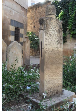
H.1320/M.1902 (Tekke cami)

Foto10-12.Arası düz olarak kapatılmış Kapak taşlı mezarlar(Tarihsiz olan mezarlar Asri mezarlıkta)