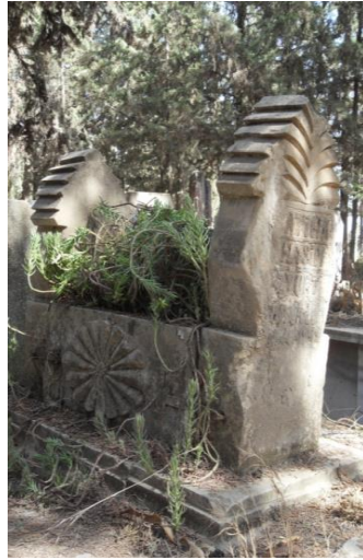
M. 1935 (Asri)