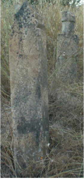
Tarihsiz ( Ravanda köyü)

Erkek Başlıkları, kendi içerisinde üç grupta incelenmektedir. İlk grupta yer alan başlıklar II. Mahmud döneminde kullanılan fes biçimi başlıklardır. Mahmudi adı ile anılır. Alt çapı üst çapına eşit olan feslerdir(sıfır fes). Bu tip başlıklardan 4 örnek yer almaktadır(Foto74-77). Bunlardan en eski tarihlisi M.1853, en geç tarihlisi ise M.1935 yılına aittir. Mahmudi başlıklar, Kastamonu Atabey Gazi cami ve türbe hazirelerindeki mezar taşlarından 1 (Çal,2008: 21),İzmit bağ çeşme namazgah şehitliğin de ki mezar taşlarından 1 örnek de görülmektedir.