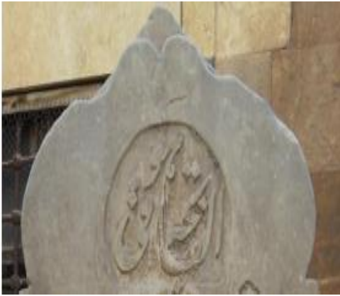
H.1136/M.1917 (Tekke cami)

Daire/Yarım Daire olarak kullanılan motifler 19 mezar taşında kullanılmıştır. Yarım daireler(Foto121) genellikle kitabede başlangıç ifadelerini ve kitabe alt bölümde yer alan tarihleri çerçevelemek için uygulanmıştır. Daire motifleri(Foto 122) ise çerçeve görevi üstlenmişlerdir. Kilis mezar taşlarında kullanım oranı yüksektir.