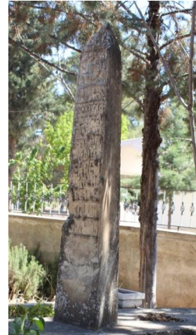
Foto 62-65. Üçgen piramidal tepelikler

Gövdesi dikdörtgen yatay kesitli başlıksız testere dişi tepelikli (Foto 66), Kilis'te 1 örneğine Eski mezarlıkta rastlanılan bu tip mezar taşları Kilis'te en az kullanılan tiptir. Aslında Kilis Kültür Envanteri adlı kitapta bir örneği daha vardır; ancak bulunamamıştır.