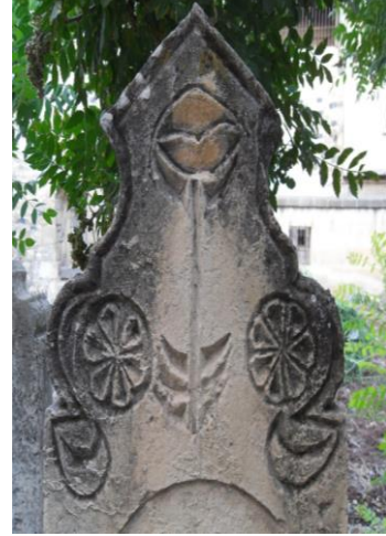
M.1828 Asri mezarlık Foto102.Basit uygulama

Lotus, 1902 tarihli bir erkek mezarına ait baş taşı tepeliğinde yer alır(Foto 103). Barok tarzda; yüksek kabartma ve eğri kesim teknikleri kullanılarak oluşturulmuştur. Burada motif karşılıklı S- C kıvrımlarıyla ve bunları palmet ile birleştirerek ortaya çıkarılmıştır. Kilis'te kullanım oranı düşüktür.