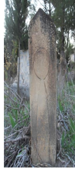
M.1946 Ravanda köyü ayak taşı