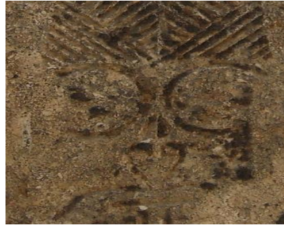
Foto 116-118. Ay, ay yıldız ve yıldız motifi

Çarkı felek motifi(Foto 119-120), 1913 ve 1915 yıllarına ait olan erkek mezarlarının ayak taşında yer alır. Üçlü ve tekli olmak üzere iki farklı uygulaması vardır. Ancak her iki örnekte de servi ağacının uç kısmında resmedilmiştir. Dünyanın geçici olduğunu simgeleyen motif sanat tarihinde sıklıkla görülmektedir.