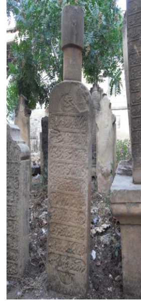
M.1853 ( Tekke cami)

Foto74-77. Mahmudi başlıklı mezar taşları