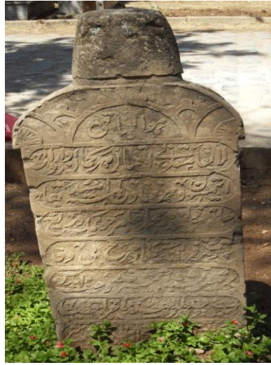
Foto78-79. Hamidiye başlıklı mezar taşları