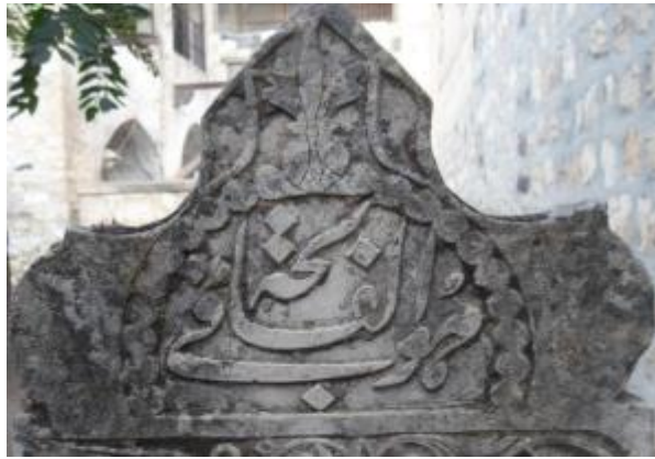
H.1323/M.1905 (Tekke cami)