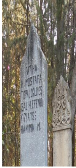
Tarihsiz(Asri) Baş taşı