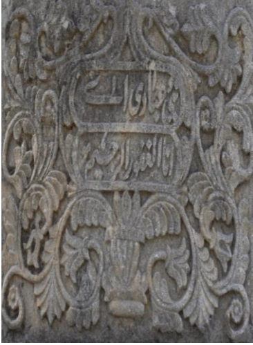
M.1913 Asri mezarlık Foto100.Saksıdan çıkan

kullanılarak oluşturulmuştur. M.1828 tarihli kadın mezar taşına ait örnekte ise eğri kesim tekniği ile yapılmış daha basit bir uygulaması görülür(Foto 102). Bursa Emir Sultan Mezarlığında ki 18-19. yüzyıl mezar taşlarından 2 tanesinde (Çakar,2007:496), Edirne Üç Şerefeli cami haziresi mezar taşlarından 11 tanesinde (Arslan,2007:453), Samsun mezar taşlarından 5 tanesinde (Nefes,2002:194), Giresun ili sahil şeridindeki Osmanlı mezar taşlarından 17 tanesinde (Çal-İltar,2011:375), Kastamonu Ferhat Paşa cami haziresi mezar taşlarından 6 tanesinde (Gündoğan,2007:257) lale motifi yer almaktadır.