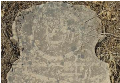
Tarihsiz(Yeni dünya mezarlığı)