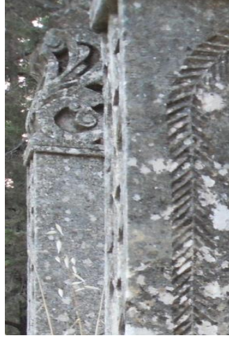
M.1915 Asri mezarlık Foto 101.Kıvrıkdal ucu