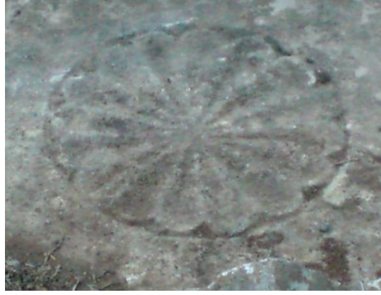
Tarihsiz (Asri mezarlık)