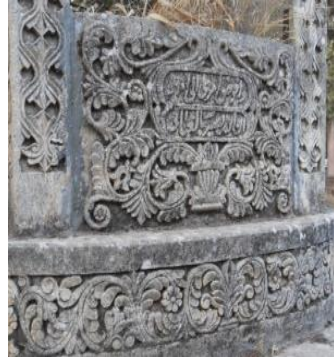
Tarihsiz ( Asri )