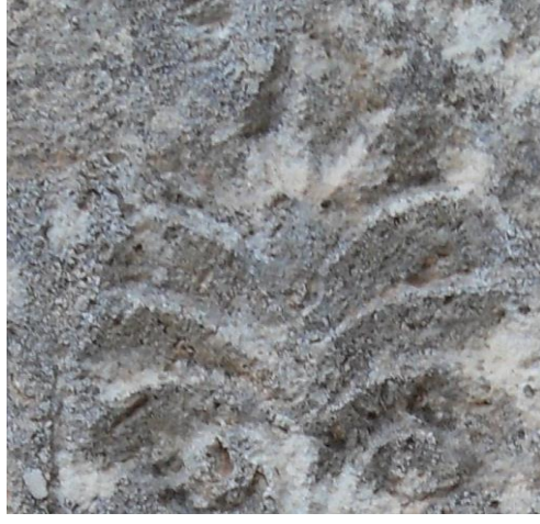
Tarihsiz (Asri mezarlık)