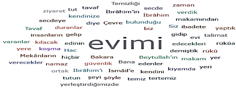
Şekil 2. Mekân ve Çevre Temizliği Kelime Bulutu

Mekân temizliği deyince akla ilk gelen, her Müslümanın iyi bildiği konu olan namaz kılınan yerin, maddî yönden temiz olması zorunluluğudur. Herhangi bir maddî necasetle kirlenmiş yerde namaz kılınmamasının yanı sıra genel itibariyle pis olan yerlerde de Allah’ın zikri yasaklanmıştır. Hadislerde “mezbaha, hamam, mezbele, deve ağılı ve makbere” özellikle namaz kılınmayacak yerler olarak belirtilmiştir (Bulut, 2011).