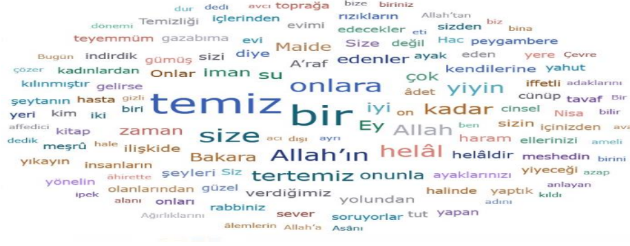
Şekil 6. Maddi Temizlik Ayetlerinin Tümüne Ait Kelime Bulutu

ithafen seslenerek “konunun muhatapları oldukları” aktarılmaktadır. “Allah’ın ve helal (f=7)” kelimeleri ise, Allah’ın dinen yasaklamadığı, izin verilen gıdalar, eşler, mekânlar vb. anlamında helal ve temiz yaşamları emretmektedir. Genel olarak değerlendirildiğinde maddi temizlik ayetlerinde en sık geçen kelimelerden şu anlam çıkarılabilir: Allah tekdir, onun kuralları size, onlara en iyiyi ve doğruyu emreder. Temiz, tertemiz olun, helal yiyeğin, giyin ve ibadete de bu şekilde yaklaşın. ” Tüm bu açıklamalar, maddi temizlik unsurları olan kişisel temizlik, mekan ve çevre temizliği ile yiyecek ve içecek temizliğine yönelik emirleri iletirken, temizlik ve hijyenin önemine de vurgu yapmaktadır.