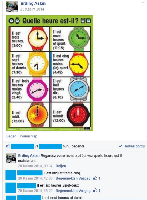
Figure 2. Les activités liées horloges

Dans une autre activité les apprenants observent des heures en image et à l'écrit. Ils doivent écrire quelle heure est-il. Une autre activité propose aux apprenants d'écrire leurs portraits à l'aide des mots donnés tel la couleur de cheveu, des yeux, du teint. Avec ces activités on vise que les apprenants construisent des simples phrases.