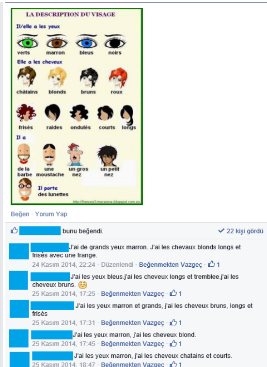
Figure 3. Les propriétés physiques des gens