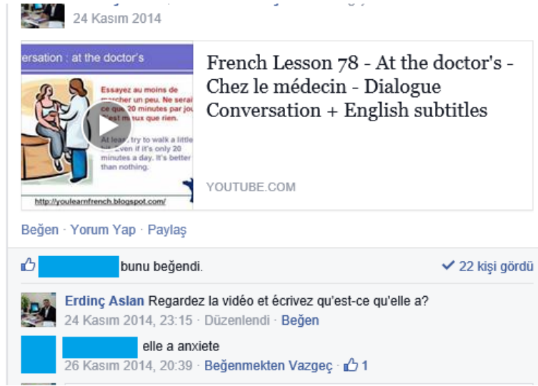
Figure 1. Le partage de vidéo

Dans une autre activité les apprenants observent des heures en image et à l'écrit. Ils doivent écrire quelle heure est-il. Une autre activité propose aux apprenants d'écrire leurs portraits à l'aide des mots donnés tel la couleur de cheveu, des yeux, du teint. Avec ces activités on vise que les apprenants construisent des simples phrases.