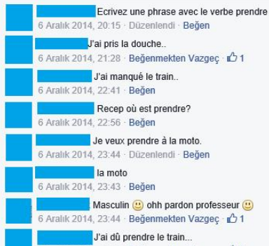
Figure 4. Activité de trouver les mots