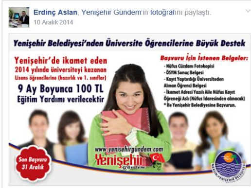
Figure 5. Écran d'annonce