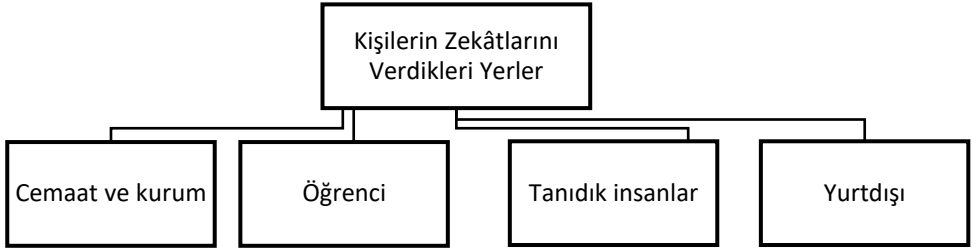
Şekil 2: Kişilerin Zekâtlarını Verdikleri Yerler

Konuya ilişkin olarak katılımcı 2, “Ben genelde öğrencileri tercih ediyorum, sonra akrabaları, daha sonra da hakikaten ihtiyaç sahibi olduğunu bildiğim ve kimseye söylemediğim insanlar var, onlara veriyorum. Yani bizzat tanıdığım insanlara veriyorum, kurumlara vermeyi tercih etmiyorum” şeklinde görüşünü ifade etmiştir. Katılımcı 4 de katılımcı 2 ile benzer şekilde düşüncelerini ifade etmiştir: “Bildiğimiz, tanıdığımız, güvendiğimiz kişilere, öncelikle fakirlere veriyoruz”. Katılımcı 1 ve katılımcı 3 ise, katılımcı 2 ve 4’ün aksine zekâtlarını ülkemizde faaliyet gösteren herhangi bir kurum veya cemaatin elektrik vb. gibi faturalarını ödeyerek verdiklerini ifade etmişlerdir. Katılımcı 3’ün konuya dair görüşü şöyledir: “Kurum aracılığı ile zekâtımı veriyorum, kurum elektrik faturasını, talebelerin ekmeğini, yemeğini, yatacak yerini, suyunu, bütün masraflarını zekât ve hayırlardan karşılıyor.” Katılımcı 6 ve katılımcı 7 ise Afrika ve savaş ülkelerine göndermenin daha uygun olacağını düşünmektedir. Katılımcı 6’nın konuya dair görüşü şöyledir: “Gazze, Suriye ve Afrika’ya biz daha çok öncelik veriyoruz.”