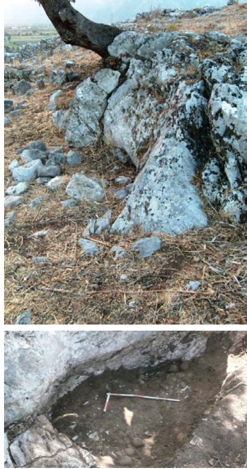
Fig. 3-4. Kazı öncesi ve sonrası: Anakaya bloğu, ocağın bulunduğu alan ve hydrialar

Bu kap formunun genel form gelişimleri Kaunos'da ele geçen örnekler yoluyla şöyle olmalıdır: En erken örneklerin şişkin karınlı vardır ve kaplar genel olarak daha kaba ve estetikten uzaktırlar. Boyun kalın, kaide geniştir. Ağız kenarları güçlü bir şekilde dışarıya doğru çıkıntı yaparlar. Zaman içerisinde gövde önce ovalleşir ve daha sonra ise konik bir gövdeye sahip olur. En geç kapların omuz gövde geçişleri ince bir çizgiyle vurgulanmıştır ve üzerlerinde az da olsa beyaz astar boya korunmuştur. Son dönem örneklerinin diğer ortak özellikleri ise, küçülmüş