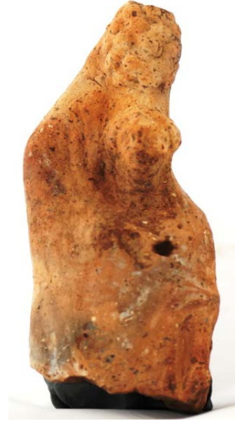
Fig. 12. Çok katlı hydria kernosu taşıyan kadın figürünü

Kernoslar Yunanistan'da ve Anadolu kıyılarında Demeter kültleri içerisinde önemli bir role