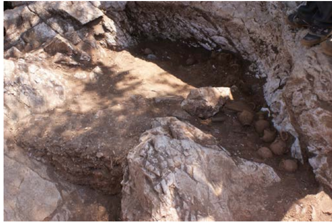
Fig. 5. Alt tabakalarda, ocağın hemen üzerinde ele geçen hydrialar

Bu gruba dahil olan hydrialar ya bezemesiz ya da yatay düz ve dalgalı bantlarla basit bir şekilde bezemelidir. Az sayıda örnekte kulplar arasında kalan bölgede bitkisel motif olarak zeytin dalı süslemesi karşımıza çıkar. Ayrıca aynı noktadan çıkarak sağdaki ve soldaki çizgilerin dışa doğru genişlediği, ortadaki çizginin ise dik olarak aşağı indiği bir süsleme de karşımıza çıkar. Aynı süslemeyi bu kutsal alandan elen geçen bazı terrakotta figürinlerin kollarında da görmekteyiz. Seyrek olarak nokta dizisi de süsleme olarak görülmektedir. Süsleme rengi olarak koyu kırmızı kahverengiden siyaha kadar değişen renk tonları karşımıza çıkar.