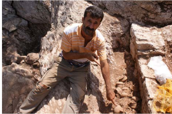
Fig. 2. Sol tarafta üzerlerinde hydriaların ele geçtiği ocak sağ tarafta ise terasın en geniş haline geldiği dönemde yapılan duvara bitişik olarak bırakılmış olan khytralar