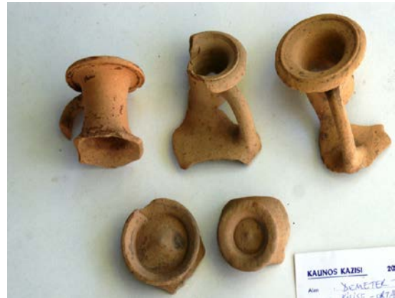
Fig. 6. 1. Grup ağız ve kaide parçaları

Dikey kulbunda, gövde üzerine inen süslemeler bulunan, gövdesi yatay çizgilerle bezeli, düz ve geniş ağızlı, silindirik geniş boyunlu, geniş karınlı benzer bir hydria Ephesos'da ele geçmiştir. Ele geçen diğer buluntularla birlikte kuyu dolgusundan ele geçen kap kuyu diğerleriyle birlikte MÖ IV. yüzyıl başlarına tarihlendirilmektedir. Kuyudan ele geçen hydriaların boyutları 40-45 cm arasındadır (Trinkl 2006, 84-87). Bunların içerisinde minyatür bir hydria yoktur, ancak süsleme ve form olarak bahsi geçen hydria Kaunos minyatür hydrialarıyla benzerlik göstermektedir. Bu eserlerin tarihi Kaunos'da ele geçen eserlerin dönemine uymaktadır. Genel olarak başlangıçtan itibaren bu gruba dahil hydrialarda hatların yumuşadığını, gövdenin inceliyor uzayarak oval bir hal aldığı görülmektedir. Boyun ve ayaklar da bu gelişime ayak uydurmuş, boyun inceliyor uzamış, ayaklar ise daralarak daha narin bir hal almışlardır. Bu dönemde geniş karınlı hydriaları