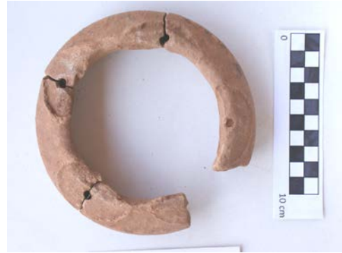
Fig. 11. Kernos kaidesi ve hydriaların bağlantı noktalarındaki delikler

Kaunos örneklerinin kendi içlerinde değişik tipleri mevcuttur. Halka biçimli simit üzerindeki sayıları 3-5 arasında değişmektedir. Hydriaların kaidelerinin kaideye bağlandığı kısımda bazı örneklerde sıvıların dolaşabileceği boşluklar mevcut iken bazı durumlarda böyle bir boşluk karşımıza çıkmaz. Bu nedenle Kaunos örneklerinde başta su olmak üzere sıvıların taşındığı anlaşılmaktadır. Bir tablet üzerinde karşımıza çıkan arpa/buğday, susam kırıntıları, incir, nar yufka ekmeği, hamurdan yapılmış phallos ya da yılanlar (Işık 2000, 238 Fig. 12) gibi sunuların bu kernoslar içerisinde bırakılma ihtimalleri çok zayıftır. Bu tablet aynı zamanda bu sunuların bırakıldığı bir masayı ya da tablayı betimliyor olmalıdır. Deubner'in (1966, 57) vurguladığı gibi bu kadar az besin bir yemeği değil bir sunuyu simgeliyor olmalıdır. Kernosların çok sayıda ele geçmesinden dolayı Kaunos'daki Demeter Kutsal Alanı'na bırakılan geleneksel sunulardan biri olduğu kabul edilebilir.