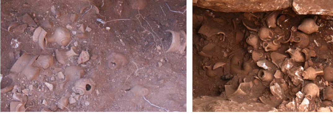
Fig. 9-10. Kernosların buluntu durumu

Kernoslar yoğun olarak kilisenin orta nefinin içerisinde bulunmuşlardır. Aynı diğer buluntular gibi bunlar da bir grup halinde ancak diğer buluntulardan bağımsız olmayacak şekilde atılmışlardır. Bunlardan çok azı minyatür kandillerin yan yana dizilmesiyle yapılmışken büyük bir bölümü ise üçlü-dörtlü ya da daha fazla sayıda minyatür hydriyanın yan yana dizilmesiyle oluşmaktadır. Alt bölümde birleştirici olarak halka formu altlık yer almaktadır. Hydrialar alt kısımlarındaki delikler yoluyla içindeki sıvıları bu halka bölüme aktarmaktaydılar.