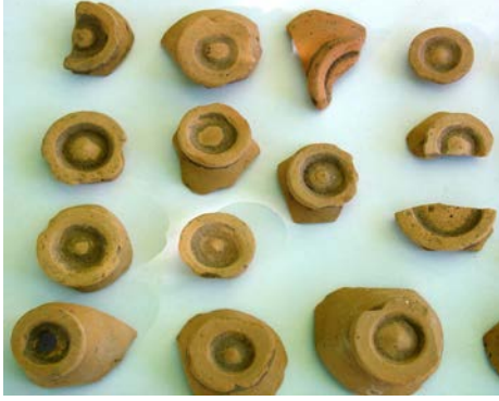
Fig. 7. 2. grup hydriaların kaide parçaları

taşımak için, diğer gruptakilere göre daha geniş ayak formları karşımıza çıkmaktadır. Ayak profilleri dışarıya doğru güçlü bir şekilde açıldıktan sonra yumuşak bir dönüşle içeriye yönelmektedirler. Kaide orta kısımda aşağıya doğru nokta oluşturacak şekilde alçalmaktadır. Boyun silindirik biçimli olup yukarıda dışarıya doğru yumuşak bir şekilde genişlemektedir. Dudakların en üst kısmında çepçevre ince bir hat bulunmaktadır.