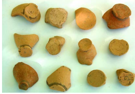
Fig. 8. 3. gruba ait hydriaların ayak parçaları

2. Grup (Levha 5): Bu dönemde hydria formlarında önemli değişiklikler olur. Aynı zamanda 3. Grup olarak da niteleyebileceğimiz kaplarla benzer bir görünüm karşımıza çıkar. En önemli farklılık gövdelerdeki incelik uzamadır. Genel olarak kapların incelik uzadıkları, belirgin bir şekilde ovalleştikleri ve en önemlisi de omuz kısımlarında belirgin ve sert bir hat oluştuğu izlenmektedir. Ayrıca, bu grubu oluşturan hydrialar genel olarak daha dar ayaklara sahiptir. Ancak asıl farklılık kaidelerde karşımıza çıkar. Artık kaideler 1. Gruptakiler gibi yumuşak bir dönüşe sahip olmayıp yukarıya dönüş yapmadan önce düz bir şekilde zemine basmaktadırlar. Daha sonra keskin bir şekilde yükseldikten sonra yine nokta yapacak şekilde alçalmaktadırlar. En büyük farklılık ise kulplarda karşımıza çıkar. Bu evreden itibaren üçüncü gruptakiler de dahil olmak üzere gövde üzerinde sadece sembolik olarak yapılmış yalancı kulplar karşımıza çıkar. Plastik bantlar gövde üzerine yapıştırılmışlardır ve kapların taşınmasında herhangi bir fonksiyona sahip değildirler. Ağız kenarlarında da önemli değişiklik karşımıza çıkar: dışa ve aşağıya açılma daha belirgindir. Bir başka önemli farklılık da boyun kısımlarında görülür. Artık silindirik boyunun yerini orta kısımlarında daralmanın görüldüğü daha küçük boyunlara sahiptirler.