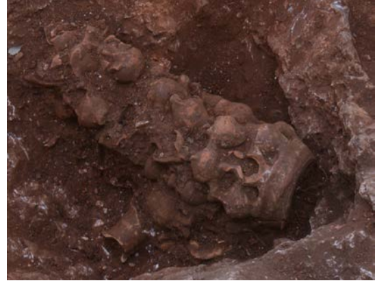
Fig. 13. Çok katlı hydria kernosu