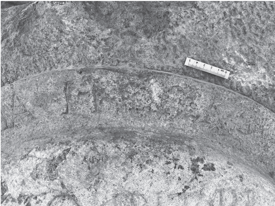
Abb. 3) Beispiel für die „sorgfältige“ Rasur: Während bis zum Alpha (von Νείκαια) die Randbeschriftung voll erhalten ist, weist das Eta, das mit dem Ny von νεωκόρος in Ligatur steht, sowie die folgenden Buchstaben entlang der Buchstabenhas- ten punktierende Rasuren auf, die die Buchstaben sehr deutlich markieren: es handelt sich um keine flächige Rasur