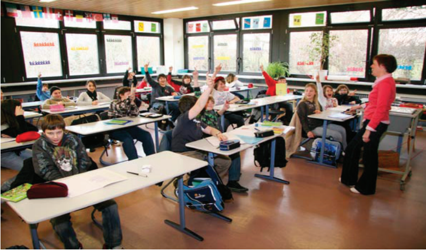
Resim 2: Ferdinand Steinbas Realschule

“Realschule”lerin sınıfları da her okulda standart özellikler göstermektedir. Resimde de görüldüğü gibi öğrenciler geniş, ferah sınıflarda, yeni ve temiz eşyalarla eğitim görmektedirler.