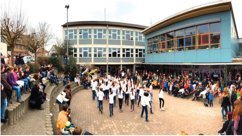
Resim 1: Güglingen Realschule

Almanya'da tüm "Realschule" türü okullar genel olarak bir birine benzemektedir. Okullarda öğrencilerin boş vakitlerini değerlendirebilecekleri geniş alanlar, spor tesisleri ve çoğunlukla okulların kapalı yüzme havuzları bulunmaktadır.