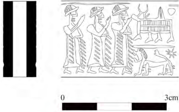
Figür 4. Elbistan Karahöyük silindir mübrü ve baskısının çizimi