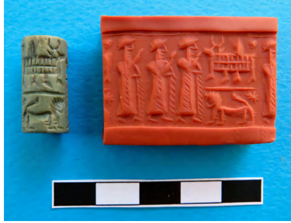
Figür 3. Elbistan Karahöyük silindir mühür ve baskısı

Elbistan Karahöyük mühründe olduğu gibi, üzerinde boğa altarına tapma konusunun işlendiği III. Ur geleneğinde yapılmış Eski Assur stilindeki mühürlerin benzerlerine baktığımız zaman, genellikle mühür baskılarından ibaret olan bu örneklerin sayısının fazla olmadığı görülmektedir. Elbistan Karahöyük mührünün kompozisyon bakımından en yakın benzeri olan Kaniş-Karum'dan ele geçmiş bir mühür baskısında, sağ tarafta üstte boğa altarı, ortada çizgi, alta aslan, bunların karşısında tapınan üç erkek figürü ve mührün bir kenarında dik duran bir yılan işlenmiştir (Kültepe kazısı: Özkan 1991: lev. 15: 58; Özgüç 2006: lev. 60: CS 647). Diğer örneklerde yapılan figürler, bunların sayıları, detayları ve doldurma motiflerinde farklılıklar vardır (Yale Üniversitesi koleksiyonu: Stephens 1944: lev. 84: f; Lewy 1937: lev. 235: 77; Özkan 1991: lev. 14: 53; Kayseri Müzesi Kültepe