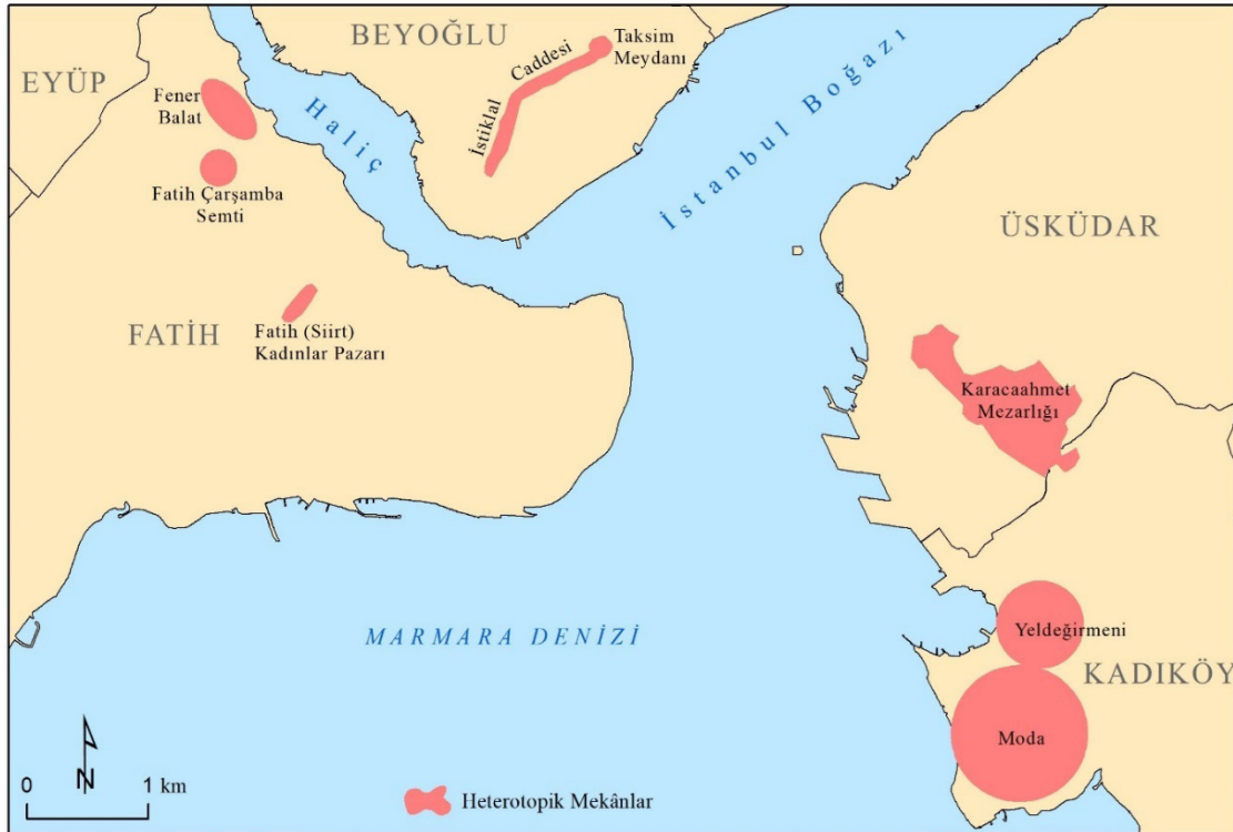
Harita 1. Çalışmada Seçilen Heterotopya Mekanlarının Coğrafi Dağılışı Figure 1. Geographic Distribution of Heterotopia Spaces in the Study

İstanbul, sanayi öncesi şehri, sanayi şehri ve sanayi sonrası şehri temsil eden mekânsal özelliklere sahiptir. Bu yüzden İstanbul, şehir coğrafyası açısından bulunmaz bir laboratuvardır. Şehir sakinlerinin zamanla değişen davranışları, farklı düşünce ve algıları şehrin coğrafi görünümüne yansımaktadır. Bu anlamda sürekli bir kimlik değişimi sürecinde olan İstanbul, "içinde yaşayan insanların mekânsal anatomisini yansıtan bir şehirdir (Tümertekin, 2014: 14-27)." Bu nedenle şehrin farklı yerlerinde yaşayan grupların davranışları, farklı mekânsal kalıpları doğurmuştur. Tanpınar'ın (2016: 146) ifadesi ile "İstanbul büyük mimari eserlerinin olduğu kadar küçük köşelerin, sürpriz peyzajların da şehridir." Kadim şehrin tarihsel coğrafyası ve kozmopolitliği öteki ve karşıt mekânları, dolayısıyla heterotopik mekânları üretmiştir.