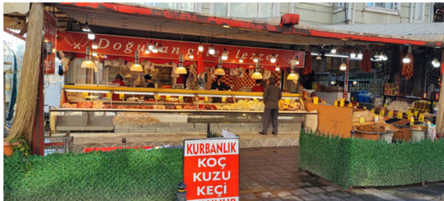
Foto 3. Kadınlar Pazarı’nda Bir Dükkan Tabelası: Doğudan Gelen Lezzet Photo 3. A Shop Signboard in the Kadınlar Pazarı: Taste from the East

Fatih ilçesine bağlı Zeyrek Mahallesi İtfaiye Caddesi’nde yer alan Siirt Kadınlar Pazarı, bulunduğu ortam ile farklı özelliklere sahiptir. Bozdoğan Kemerî’nin Unkapanı semtine denk gelen kesiminin kuzeybatısında yer alan Kadınlar Pazarı, başta Siirt olmak üzere Doğu ve Güneydoğu bölgelerine ait ürünlerin satıldığı bir çarşıdır. Cadde boyunca uzanan büryan kebabı restoranları ile sakatat, otlu peynir, Siirt fıstığı, menengiç, karakovan balı, baharatlar ve bittım sabunu satışı yapan dükkanlar, bu alanı adeta küçük bir Siirt haline getirmiştir. Bu nedenle çarşı, Siirt Pazarı olarak da bilinmektedir. Ayrıca işletme tabelalarındaki Diyarbakır, Van, Bitlis ve Bitlis gibi şehir adları, Doğu ve Güneydoğu Anadolu bölgelerine çağrışım yapmaktadır. Bu durum, Kadınlar Pazarı’nın bulunduğu ortamdaki farklı bir