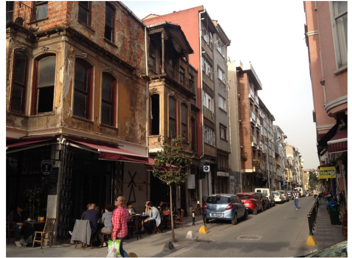
Foto 2. Metruk Bir Aparmanın Alt Katında Yer Alan Bir Kafe, Yeldeğirmeni, Kadıköy

kültür ve sanat odaklı etkinliklerin düzenlendiği Müze Gazhane, semtte farklı yaşam alanlarının gelişmesini hızlandırmıştır. Günümüzde Yeldeğirmeni semti kitapçıları, çeşitli tasarım ve sanat atölyeleri, restoranları, butik kafeleri, duvar yazıları, sergileri, sokak sanatçıları, eğitim ve dini yapıları ile sosyal ve mekânsal yapısıyla kendine has bir heterotopik mekandır. Burası İstanbul halkının eğlenmek, sosyalleşmek, öğrenmek ve fikirlerini özgürce ifade etmek için bir kaçış mekânı olarak ifade edilebilir (Foto 2).