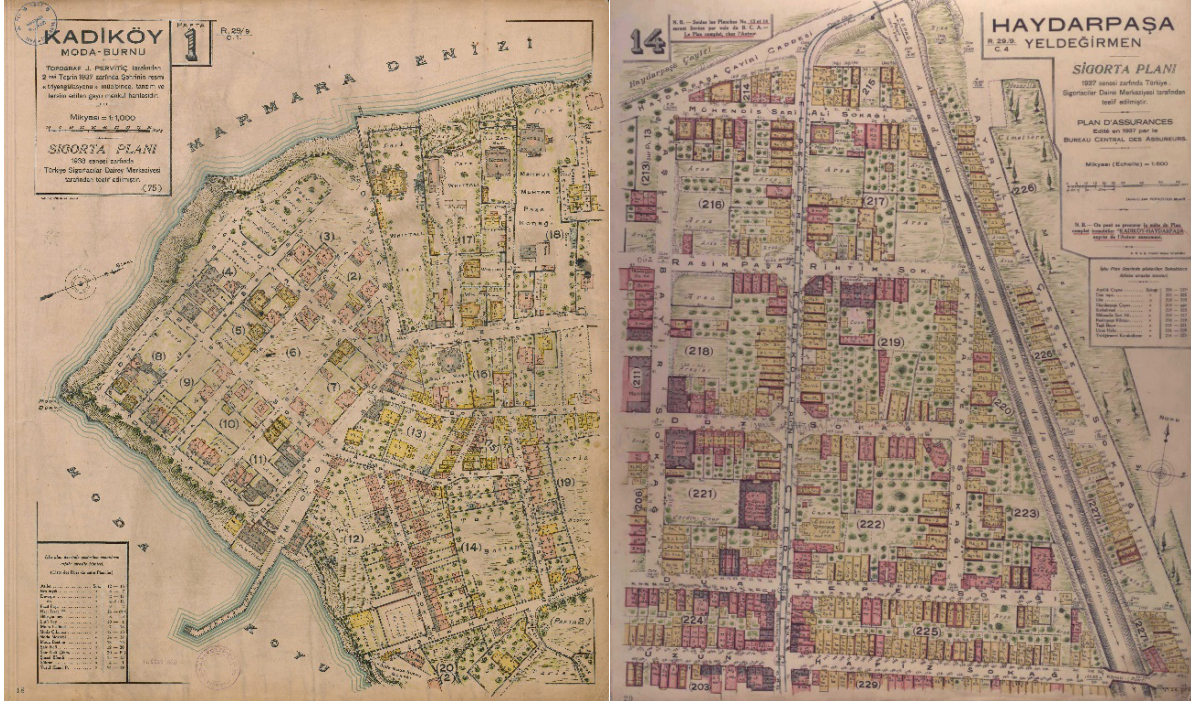
Harita 3. Kadıköy Moda Burnu ve Yeldeğirmeni (Pervititch, Haritaları, 1937)

J. Pervititch, İstanbul’un muhtelif bölgelerini ve Moda semtinin 1/1000 ölçekli planını çizmiştir (Michel & Serezli, 2002; Harita 3). Söz konusu dönemi gösteren haritada yer alan Moda parkı, çocuk bahçesi ve tenis kortu hala varlığını sürdürmektedir. Köşklerin, geniş bahçelerin, kâgir konutların ve bostanların yer aldığı semt planlı bir gelişim göstermiştir.