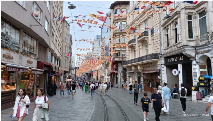
Foto 5. İstiklal Caddesi Photo 5. Istiklal Street