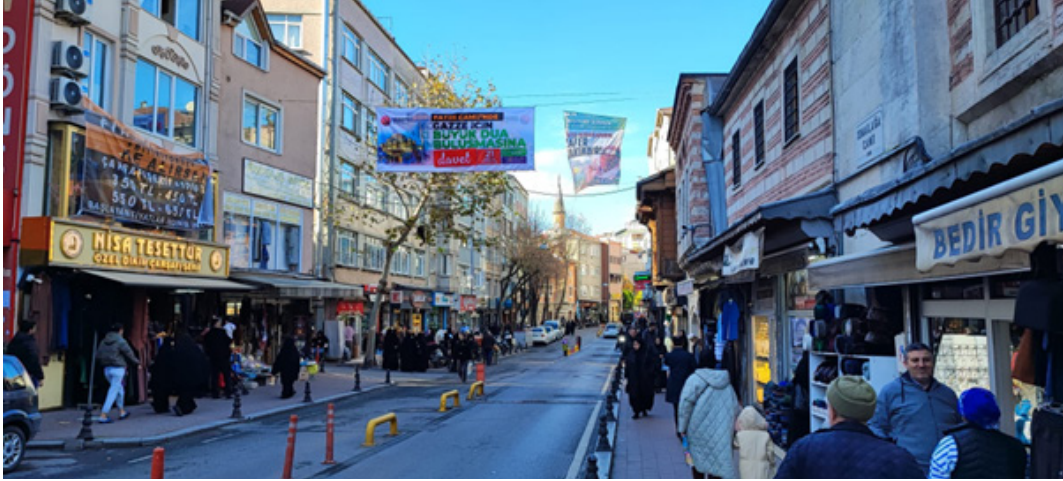
Foto 6. Çarşamba Semtinde İnsan ve Mekân Manzaraları (Manyasizade Cd.)