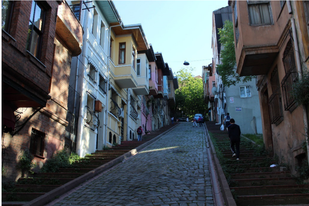
Foto 1. Merdivenli Yokuş, Balat Mah. Fatih.

“Eski İstanbul'un izlerini taşıyan harika bir yer.” “İstanbul'un en renkli, ahenkli bölgelerinden birisi. Antikanın, entelektüelliğin, taze kahvenin, hoş sohbetin ve renklerin aynı anda senkronize olup sizi mest ettiği mekân.” “Balat çok renkli, civil civil, farklı kültürel dokusu olan özel bir bölge. Sokakları, mekanları, camisi, kiliseleri, tarihi yapıları ve insanları ile çok özgün bir atmosfer var burada.” “Mahallenin kültürel çeşitliliği kiliselerin, sinagogların ve camilerin uyum içinde bir arada yaşamasından açıkça görülmektedir. Balat'ta önemli bir Yahudi mirası vardır. Balat özünde tarih, kültür ve canlı sokak yaşamının büyüleyici bir karışımıdır. Özgünlüğü ve karakteri, İstanbul'un çeşitli mahallelerinin zengin dokusuna dalmak isteyenler için...” “Fener ve Balat sokakları, eski tarz rengarenk evler ve gizli kiliselerle dolu olup, şehirde yürüyüş yapmak için idealdir. Bu mahalle alışlagelmişin dışındadır ve tarih ve kültür açısından