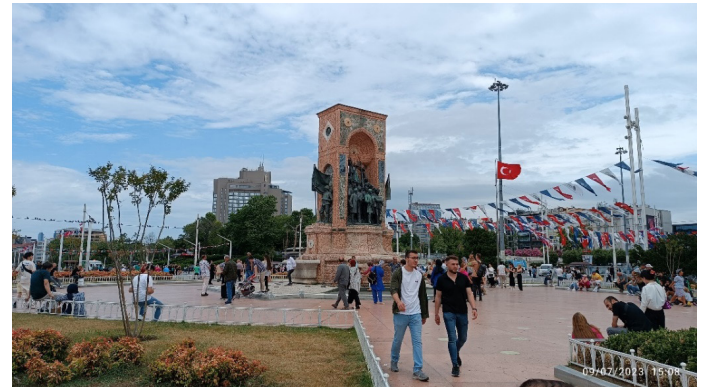
Foto 4. Taksim Meydanı Photo 4. Taksim Square

Taksim Caddesi'nin Beyoğlu'na doğru bir mekânsal uzantısı olan İstiklal Caddesi, farklı grupların gösteri yürüyüşlerinin