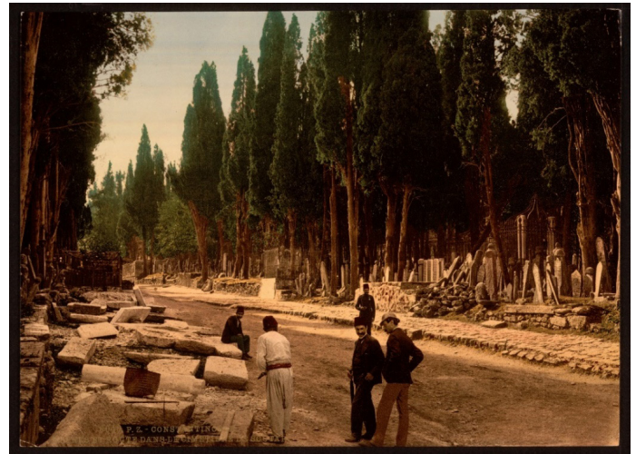
Foto 7. 1890’larda Karacaahmet Mezarlığı.

İstanbul’da 500’den fazla mezarlık olsa da bunlar içerisinde hiç şüphesiz en meşhuru tarihi Karacaahmet Mezarlığı’dır. İstanbul’un en büyük ve meşhur aynı zamanda en eski mezarlığı olan Karacaahmet Mezarlığı, 750 dönümlük bir arazi üzerinde yer almaktadır. Tarihi geçmişi 14. yüzyıla dayanan mezarlıkta, tam sayısı bilinmemekle beraber milyonlarca insanın defnedildiği tahmin edilmektedir. Mezarlık; Saraçlar Çeşmesi, Miskinler, Şehitlik, Duvardibi ve Musallâ isimli beş ana bölgeye ayrılmıştır. Mezarlık kuzeyde Tunusbağı’ndan güneyde Haydarpaşa Numune Hastanesi ve Avrasya Tüneli’nin Anadolu girişine doğru eğimli bir arazi üzerinde yer alır. Günümüzde şehirsiz alan içerisinde kalan Karacaahmet Mezarlığı 1920’li yıllarda Üsküdar yerleşim alanı dışında kalmaktaydı. Karacaahmet Mezarlığı başta servi olmak üzere çınar, defne, çitlembik gibi ağaçları ve farklı bitki türleriyle bir orman görünümü kazanmıştır. Mezarlığın etkileyici görünümü ve mimari ihtişamıyla yüzyıllar boyunca yabancı seyyahları büyülemiş (İşli, 2001; Şahin, 2015), bu yüzden tasvirlerle, gravürlere veya resimlere konu olmuştur (Kucur, 2015; Foto 7).