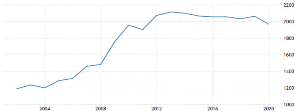
Рисунок 2. ВВП на душу населения в Афганистане 2004-2020 гг. Источник: Trading Economics, 2022

повлияла вспышка Ковид-19, начали снижаться. Видно, что эта тенденция к снижению сохраняется и при правлении талибов. Таким образом, глядя на общие макроэкономические показатели страны, можно сделать вывод, что экономика страны не могла хорошо управляться во время правления талибов.