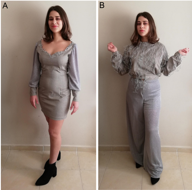
Görsel 8. Chicago Temalı Giysi Tasarımları (Keser, 2019)

Opera olan, Fransız yazar Gastob Leroux'un aynı adı taşıyan romanından uyarlanmış bir müzikaldir. 1910'da yayınlanan roman'da Paris Opera Binasında dolaşan bir hayalet herkesin korkulu rüyası olur. Fakat bu gizemli hayalet aslında maskeli bir aşiktir. Operanın parlayan yıldızı Christine ve ona âşık olan erkeklerle oluşan bu büyümlü atmosferin, saplantılı bir aşka dönüşümünü göstermektedir (Leroux, 2019). Hayaletin maskesi ile gizlemeye çalıştığı kıskançlığı ve reddedilme korkusu, Christine için büyük sorunlar yaratmaktadır. Dramatizasyon örneği olan bu olay kurgusu aşkın hem yıkıcı hem de kurtarıcı yönünü tutku, şiddet ve gerilim ile ele almaktadır (Leroux, 2018).