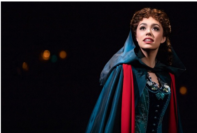
Görsel 9. Operadaki Hayalet Müzikalinden Christine Karakteri (The Phantom of the Opera, 2021) (Matthew, 2019)

Christine, maskesi ardında saklanan ve aslında hiç görmediği hayalet tarafından aldığı müzik dersleri ile başarılı bir soprano olurken, takıntılı bir âşık tarafından karanlık bir sona sürüklenmektedir. Bir gece sahnede şarkı söylerken aniden kaybolan