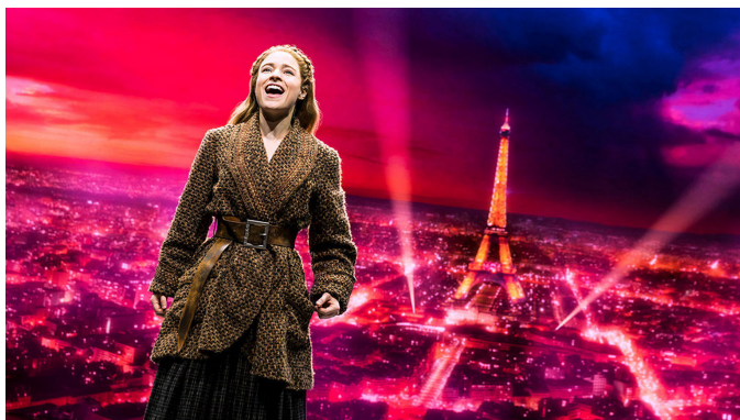
Görsel 1. Anastasia: Hanedanın Kayıp Prensesi Müzikalinden Bir Sahne (Cristi, 2019)

Lyman Frank Baum'un "The Wizard of Oz" isimli kitabından esinlenilerek ortaya çıkan ve çocuklara hitap eden Oz büyücüsü