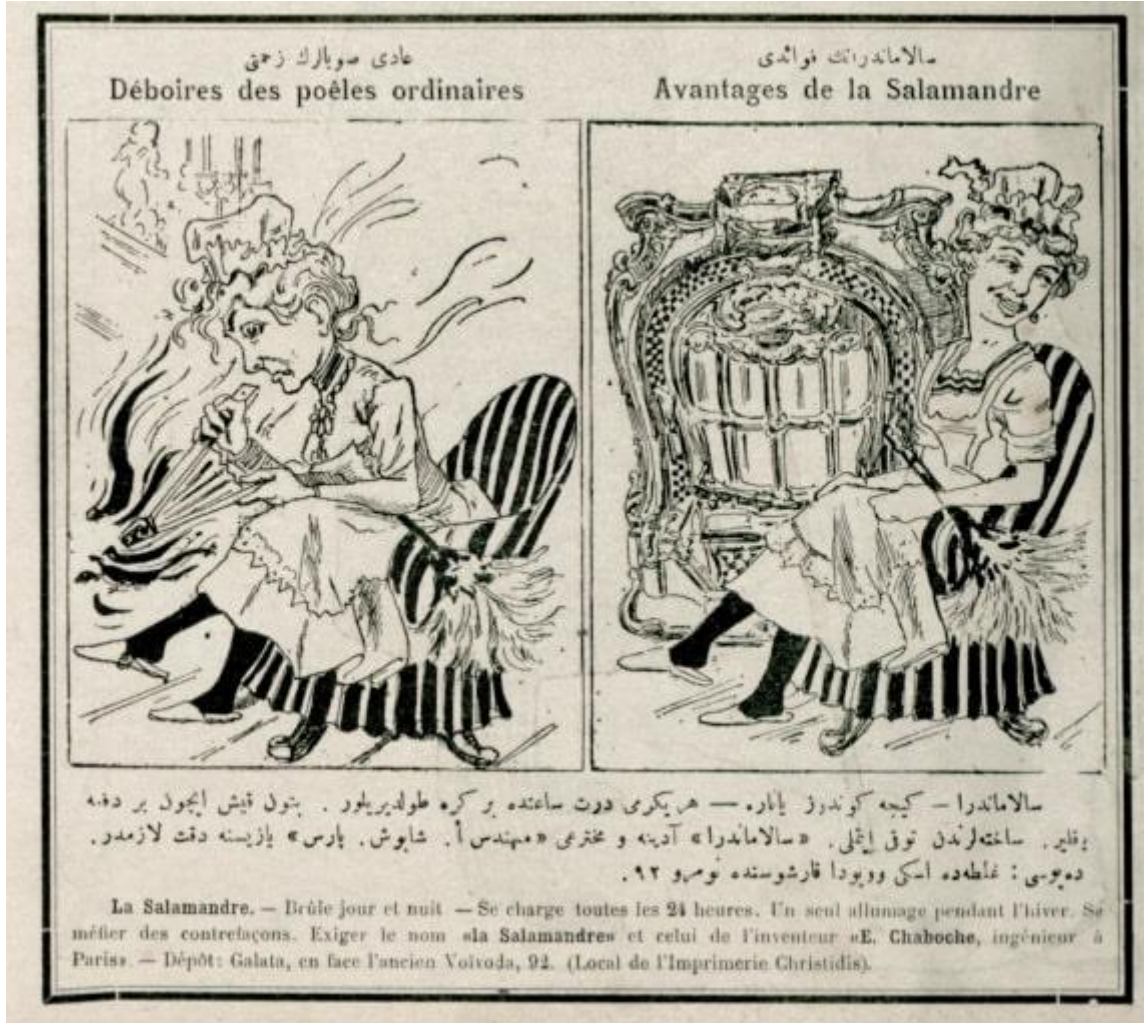
Şekil 3: Salamandre marka sobanın reklamı.