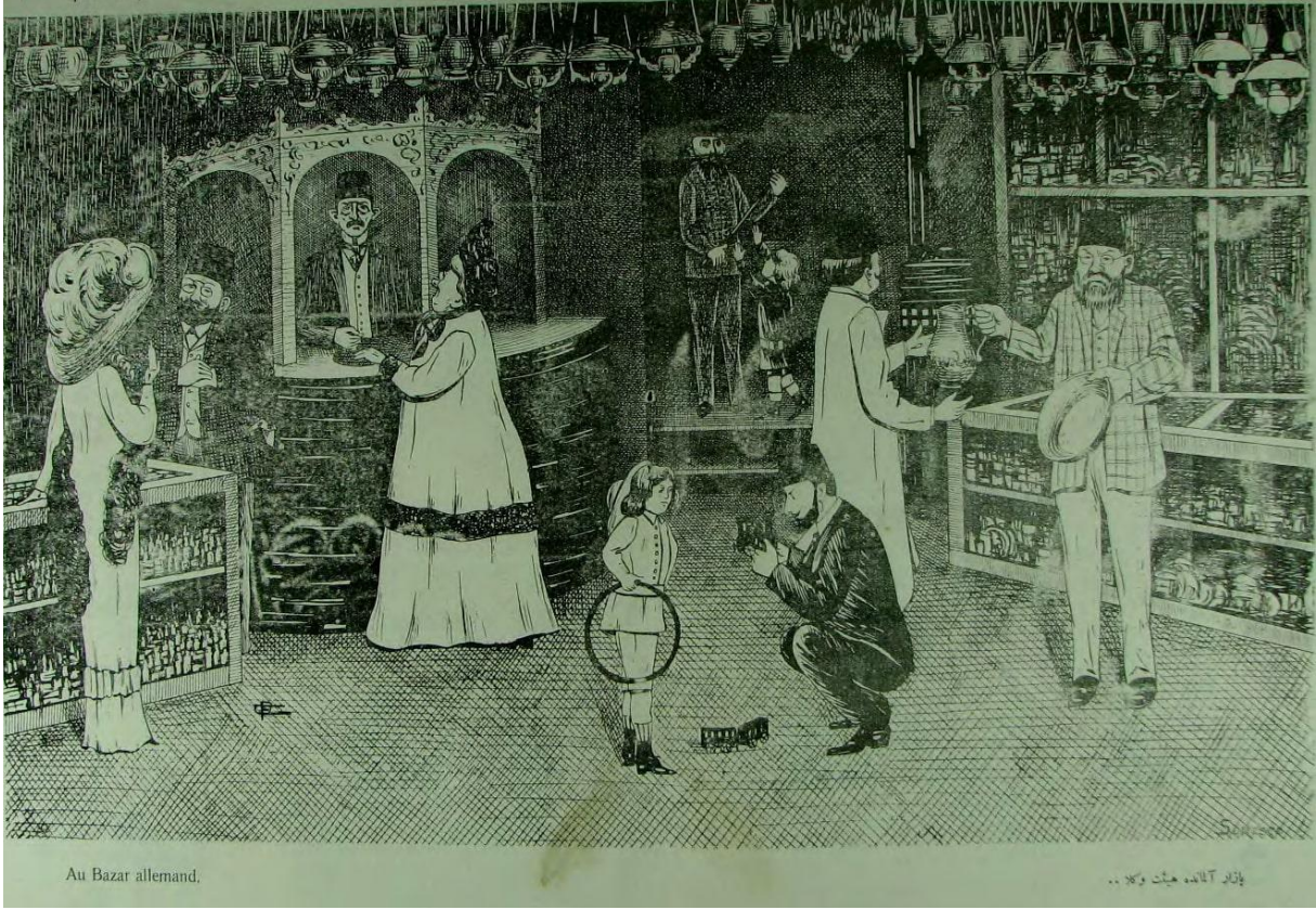
Şekil 5: Farklı bir bağlamda kullanılmakla birlikte alınan borç akabinde Pazar Alman'da alışverişe çıkılmasını eleştiren bir karikatür