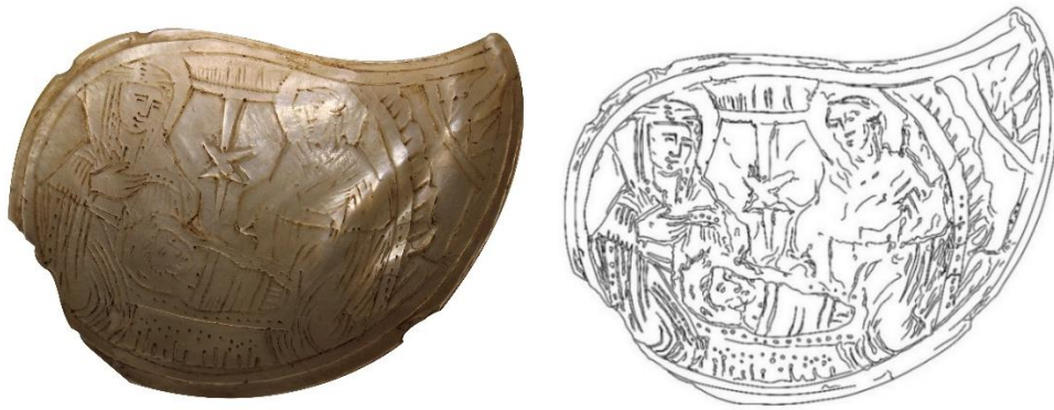
Görsel 1. Sedef Kemer Tokası Parçası (Çizim Aziz İNCE) / Mother of pearl Belt Buckle Piece (Foto. F.İ-SİDDİKİ ve C. UÇAR)

Tanım: Kemer tokası parçası yaprak formudur. Eserin sol alt kısmı kırık olup, arkası konkav ve sadedir 5 . Konveks ön yüzünde ise kazıma tekniğinde yapılmış “İsa’nın Doğumu” sahnesi bulunmaktadır. Merkezde bir beşik içinde kundağa sarılmış olarak yatan bebek İsa yer almaktadır. İsa’nın sarılı olduğu kundağı paralel çizgilerle vurgulanmıştır. İsa’nın üstünde ortada onun doğumunu simgeleyen beş kollu yıldız bulunmaktadır. İsa’nın solunda Meryem, oturmakta, bedeninin alt bölümü görünmemektedir. Hafif sağa dönük elleri göğsü üzerindedir. Meryem maphorion giyimlidir. Giysisi üzerinde kıvrımlar yatay ve dikey çizgiler ile vurgulanmıştır. İsa’nın sağında ise Yusuf bulunmaktadır. Yusuf İsa’ya doğru bakmaktadır ve himation giyimlidir. Sağ eli göğsünün üzerindedir. Yusuf’un himationu yatay ve dikey çizgilerle vurgulanmıştır (Görsel 1, Çizim 1). İsa’nın Doğumu, Luka İncili’nin 2:6-7 ayetinde anlatılmaktadır 6 .