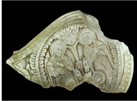
Görsel 2. Niğde Müzesi Sedef Kemer Tokası (Mimiroğlu ve Ünlüler 2018, s, 313).

Sedef kemer tokası süslerinin günümüze ulaşmış örnekleri farklı müzelerde bulunmaktadır 7 . Niğde Müzesi'nde Hıristiyan azınlığa ait olduğu anlaşılan dört kemer tokası parçası sergilenmektedir (Görsel 2). 18. yüzyıla tarihlenen 2.7.75 müze envanter nolu kemer tokası form açısından, 13.9.75 müze envanter nolu kemer tokası ise üzerindeki süsleme açısından 8 , Bandırma Müzesi örneğine benzemektedir.