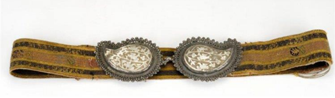
Görsel 6. Benaki Müzesi'nde Bulunan Sedef Kemer Tokası (benaki.org)

Atina Benaki Müzesi'ndeki üç örneğe bakıldığında bunların kadife bir kuşağa sahip oldukları görülmektedir. Bu üç örnekten ikisinin üzerinde geometrik ve bitkisel süsleme bir diğeri üzerinde ise ikonografik sahneler yer almaktadır. Bu şekilde üzeri süslü örneklerin Kudüs'te hacılar için üretildiği ve din adamları tarafından kullanıldığı düşünülmektedir (benaki.org).