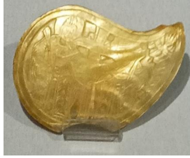
Görsel 3. İzmir Arkeoloji Müzesinden Sedef Kemer Tokası

Müze koleksiyonları haricinde kazı buluntuları arasında da sedef kemer tokaları görülmektedir. Örneğin Sinop'ta Balatlar Kilisesi Rum mezarlarında yürütülen kazılar sonucunda sedef kemer tokası ele geçmiştir. 20. yüzyılın ilk çeyreğinde kilise, manastır ve diğer yapıların etrafı mezarlık alanı olmuştur. Mezarlık alanında yapılan arkeolojik kazılar sonucunda Rumlara ait doğu- batı doğrultusunda yerleştirilmiş gömüler bulunmuştur (Soylu Yılmaz, 2022, s, 478). Bu gömülerde 20. yüzyıl modası hakkında bilgi veren kıyafet, ayakkabı ve kişisel süs eşyaları ortaya çıkarılmıştır. Geç dönem kilisesinin apsis duvarının önünde bulunan din adamlarına ait olduğu bilinen yükseltilmiş mezarlarda giysilerle birlikte kullanılan sedef kemer tokaları ele geçmiştir (Görsel 4). Sedef kemerlerin brokar, kadife ve pul işlemeli tören kıyafetlerinde kullanıldıkları anlaşılmaktadır (Soylu Yılmaz, 2022, s, 480).