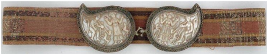
Görsel 5. Benaki Müzesi'nde Bulunan Sedef Kemer Tokası (benaki.org)

Sedef kemer tokalarının benzer örnekleri yurtdışındaki bazı müzelerde de sergilenmektedir. Atina Benaki Müzesi'ndeki örneklere bakıldığında (Görsel 5-6) sedef objelerin kemerin toka kısmında karşılıklı olarak kullanıldığı ve gümüşten bir çerçeve içine yerleştirildiği anlaşılmaktadır (Mimiroğlu ve Ünlüler 2018, s, 325).