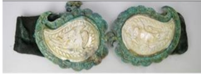
Görsel 4. Rum Din Adamları Mezarlarından Ortaya Çıkarılan Kartal Motifli Sedef Kemer ve Kıyafet Parçaları

Müze koleksiyonları haricinde kazı buluntuları arasında da sedef kemer tokaları görülmektedir. Örneğin Sinop'ta Balatlar Kilisesi Rum mezarlarında yürütülen kazılar sonucunda sedef kemer tokası ele geçmiştir. 20. yüzyılın ilk çeyreğinde kilise, manastır ve diğer yapıların etrafı mezarlık alanı olmuştur. Mezarlık alanında yapılan arkeolojik kazılar sonucunda Rumlara ait doğu- batı doğrultusunda yerleştirilmiş gömüler bulunmuştur (Soylu Yılmaz, 2022, s, 478). Bu gömülerde 20. yüzyıl modası hakkında bilgi veren kıyafet, ayakkabı ve kişisel süs eşyaları ortaya çıkarılmıştır. Geç dönem kilisesinin apsis duvarının önünde bulunan din adamlarına ait olduğu bilinen yükseltilmiş mezarlarda giysilerle birlikte kullanılan sedef kemer tokaları ele geçmiştir (Görsel 4). Sedef kemerlerin brokar, kadife ve pul işlemeli tören kıyafetlerinde kullanıldıkları anlaşılmaktadır (Soylu Yılmaz, 2022, s, 480).