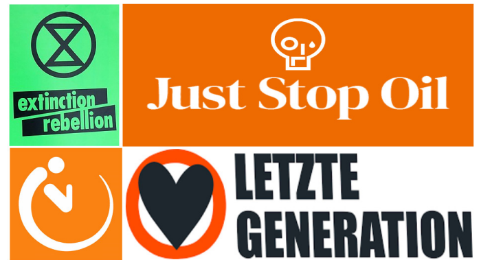
Görsel 6. İklim aktivist gruplarının logo ve amblemleri

Just Stop Oil, Extinction Rebellion, Letzte Generation ve Ultima Generazione gibi aktivist grupların ana amacı, odak noktasında fosil yakıt kullanımının verdiği zarar olan çevreci sorunlara karşı kendi aralarında oluşan kolektif bilinci, eylemleri ile izleyicilere ve dünya insanına aktararak global bir uyanışa sebep olmak istemeleridir. Aktivist eylem ne kadar dikkat çekerse ulaşılan insan kitlesi o kadar fazla olur düşüncesiyle vandalist eylemleri benimseyen bu gruplar sanat eserlerine zarar verme kaygısından uzak bir şekilde eylemlerine devam etmektedir. Grup isimlerinin Türkçe karşılıklarını incelediğimizde Just Stop Oil'in "Sadece Petrolü Durdurun", Extinction Rebellion'un "Yokoluş İsyanı", Almanca olan Letzte Generation ve İtalyanca Ultima Generazione'nin ise aynı Türkçe anlama karşılık gelen "Son Nesil" anlamını taşıdığını görmekteyiz.