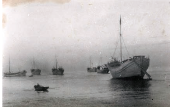
Fig. 5. Kastamonu Kıyılarında üretilen mavnalar, 1960’lı yıllar.