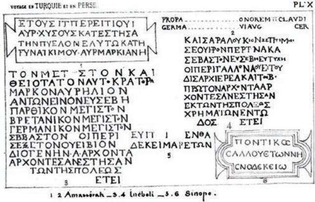
Fig. 3. Ionopolis'ten Antoninus Pius ve Septimus Severianus Dönemi yazıtları. Xavier Hommaire de Hell, 1860, 343-344, X, 3-4.

Tournefort yerleşimi İstanbul ve Sinop arasındaki bir nirengi noktası olarak belirtip gemi yapıcılığının da öneminden bahsetmiş, aynı konuya Vivien de Martin, De Marigny ve Jaupert de değinmiştir. Öte yandan Tournefort konakladığı yeri Abano olarak isimlendirmektedir. Günümüzde İnebolu'dan sonra Abana ilçesi ve sahili gelmektedir. Ancak antik ismiyle Aiginetes olan bu yerleşim demirlemek için çok uygun olmadığı gibi, İnebolu'dan da daha küçük bir yerleşimdir. İnebolu'nun bilinen ilk isminin Abonuteikhos olması Tournefort'un sözü edilen kentte konaklamış olduğu fikrini akla getirmektedir (Tournefort, 1741, 36-37). Evliya Çelebi, İnebolu'nun tarihinden ve kalesinden bilgiler sunarken, 20. yüzyıl başındaki araştırmacı E. Nowack ise yerleşimin coğrafi ve tarımsal ürünleri hakkında bilgiler vermiştir.