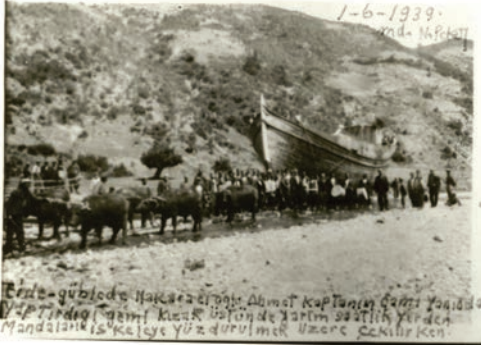
Fig. 4. Cide, Güble’de (Uğurlu Köyü) karada inşa edilmiş bir teknenin dere içinden mandalarla kızak üstünde denize çekilmesi