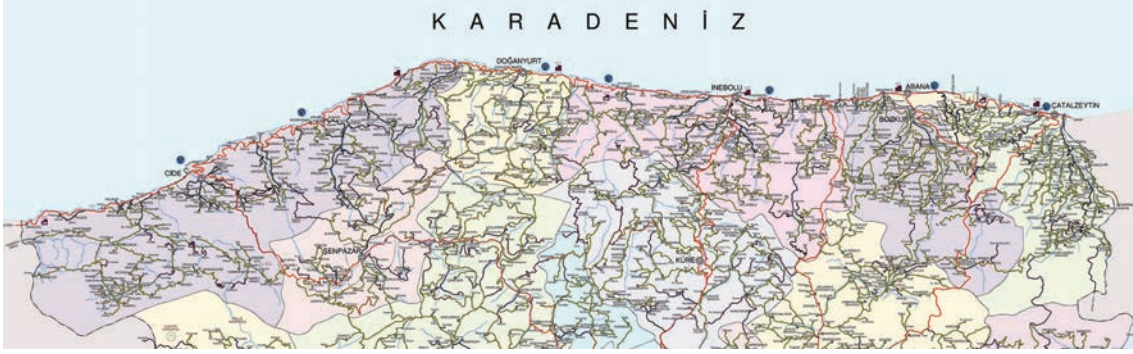
Fig. 1. Kastamonu Karadeniz kıyıları ilçe ve köyleri; 1/170.000 ölçekli Kastamonu Köy Yolları Haritası

kıyı çizgisinin hemen ardında yükselmesi nedeniyle iç kesimlerle bağlantısı zorlu bir coğrafyaya sahiptir. Antikçağda ise Halys (Kızılırmak) ile Parthenos (Bartın)/Billaios (Fiyos Çayı) ırmakları arasında kalan, kuzeyinde Pontos Eukseinos (Karadeniz), güneyinde Galatia, güneydoğusunda Kappadokia, güneybatısında Phrygia ve batısında Bithynia bölgeleri ile sınırlandırılan Paphlagonia Bölgesi'nde yer almaktadır (Strab. XII. 3. 9).