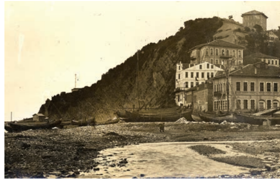
Fig. 7: Antik Abonuteikhos/Ionopolis günümüz İnebolu kıyısı, 1920'ler.