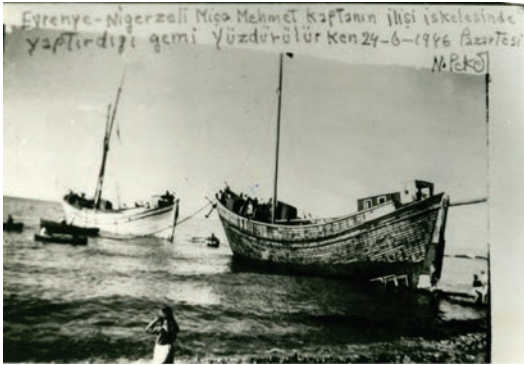
Fig. 6: Kastamonu kıyılarında üretilmiş bir mavnanın suya indirilmesi, yıl 1946.

Clavio'nun Kastamonu kıyılarını betimlediği dönemin Candaroğulları Beyliği'nin hâkimiyet yıllarına rastlaması oldukça dikkate değerdir. Özellikle Kinolis, koyundaki kalede Türk askerlerinin bulunduğu bilgisi, Bizans Dönemi sonrasında yöredeki kalelerin Türkler tarafından askeri amaçlar doğrultusunda kullanılıyor olduğunu göstermektedir. Öte taraftan, 1211/1212 (Yücel, 1988, 36) yılında Kastamonu'nun iç kesimleri Türklerin eline geçmesine rağmen kıyıların ne zaman Türk Hâkimiyetine geçtiği belirsizdir. I. İzzeddin Keykavus'un 1214 yılında Sinop'u alması, ardından da Çobanoğulları Beyliği'nin hükümdarı Hüsameddin Çoban Bey'in 1223 tarihinde Suğdak seferine Sinop'ta hazırlanan donanma ile çıkması (Yücel, 1988, 38), Kastamonu kıyılarında Türk varlığının yayılmaya başlamış olabileceğini ifade eder.