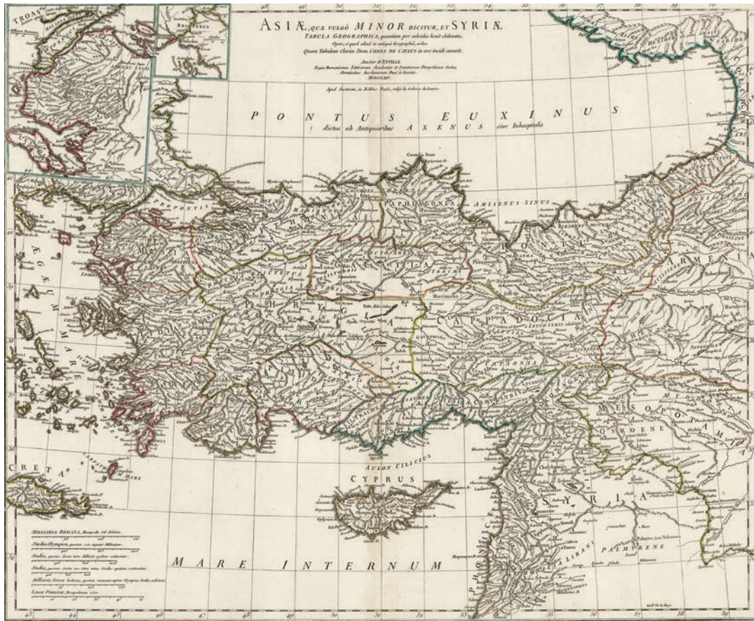
Fig. 8: Jean Baptiste Bourguignon D'Anville: Asiae, quae vulgo Minor Dicitur, et Syriae, Tabula Geographica; 1764, Paris; https://www.raremaps.com/gallery/detail/31636/Asiae_quae_vulgo_Minor_Dicitur_et_Syriae_Tabula_Geographica/D'Anville.html

Hem antik kaynaklarda hem de ortaçağ seyahatnamelerde Karambis Burnu, Karadeniz'in kuzeyindeki Kriumepetopon Burnu ile Karadeniz'in en dar kesimini oluşturmasıyla sözü edilen denizi ikiye ayırdıklarının varsayımı burayı önemli kılmaktadır. Antikçağlardaki Karambis, Ortaçağ'da Fakas olarak isimlendirilmiştir, burası muhtemelen günümüzdeki İlyasbey Köyü'dür. Buradaki yerleşimden ortaçağda Anna Komnena değinmiş, 1608 yılındaki notlarında J. Bordier, buradaki kalıntılardan bahsetmiştir. 1972 yılındaki çalışmalarda yerel halkın Ceneviz Hamamı dediği ve çeşitli tuğla örgü ve yığma taş teknikleriyle inşa edilmiş kalıntıların ortaçağ yerleşimine ait olduğu belirtilmiştir (Bryer-Winfield, 1985, 67-68).