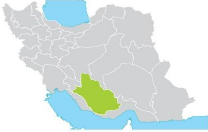
Harita 2. İran'ın Fars vilâyeti

bilgiler bunlardan bazılarının Kaşkay Türkçesi konuşmadığını göstermektedir. Fars vilâyetinde Halaç ve Afşar boyları ve Abiverdiler de yaşamaktadırlar. Bölgede yaşayan konargöçer Türklere ait bilgiler bu yazının içerisine dahil edilmemiştir.