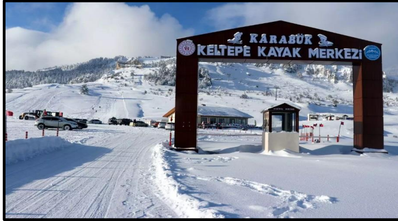
Görsel 1: Keltepe Kayak Merkezi

Karabük ilinde merkez ilçeye bağlı Karaağaç Köyü Sorgun Yaylası Keltepe Mevkii 1480-1725 metreleri arasında Keltepe Kayak Merkezi bulunmaktadır (Karabük Gençlik ve Spor İl Müdürlüğü, 2023). Keltepe Kayak Merkezi, 1 eğitim pisti olmak üzere 5 adet piste sahiptir (Görsel 1). Pistler; Mavi Pist (2400 m), Kırmızı Pist (1800m), Siyah Pist (1000 m), Terzikaya Pisti (1800m) ve Eğitim Pisti (200m) diye adlandırılmıştır. Toplamda 7200 m pist uzunluğuna sahip merkezde 690 m uzunluğunda Teleski Tesisi, 873 m uzunluğunda Telesiyej Tesisi, Alt ve Üst Günübirlilik Tesisi, Alt ve Üst İstasyon ile Trafo Tesisi bulunmaktadır. Telesiyej sistemi, 8:30 - 17:30 saatleri arasında hizmet vermektedir. Telesiyej saatte 1200 kişi taşıma kapasitesine sahip olup günlük 9600 kişi telesiyejden faydalanabilmektedir. Telesiki saatte 716 kişi kapasiteli olup günlük 5728 kişi faydalanabilmektedir. Gelen ziyaretçiler için 1 adet alt günübirlilik kafeterya ve 1 adette üst günübirlilik kafeterya bulunmaktadır (Belder, 2021).