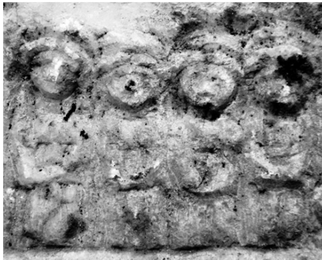
Figür 1 b