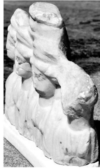
Figür 2 d