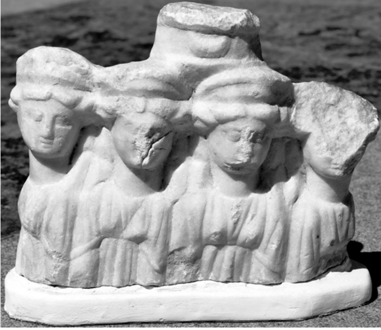
Figür 2 a