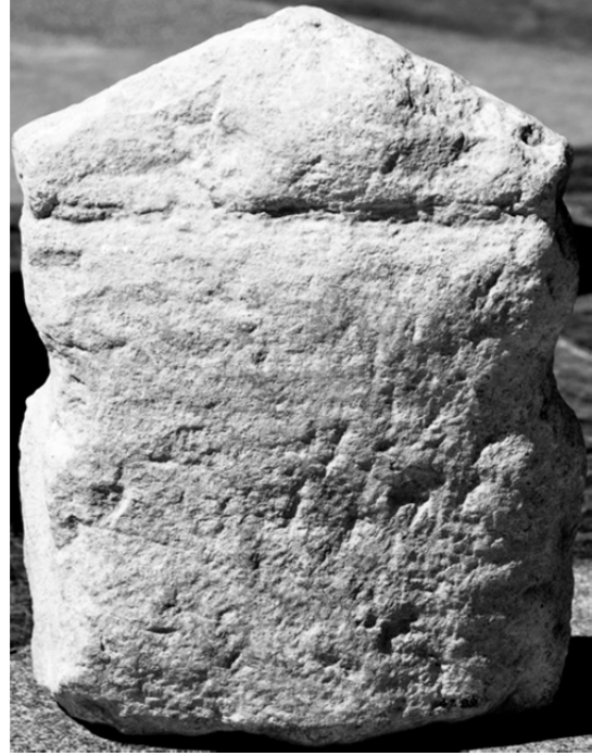
Figür 3 d