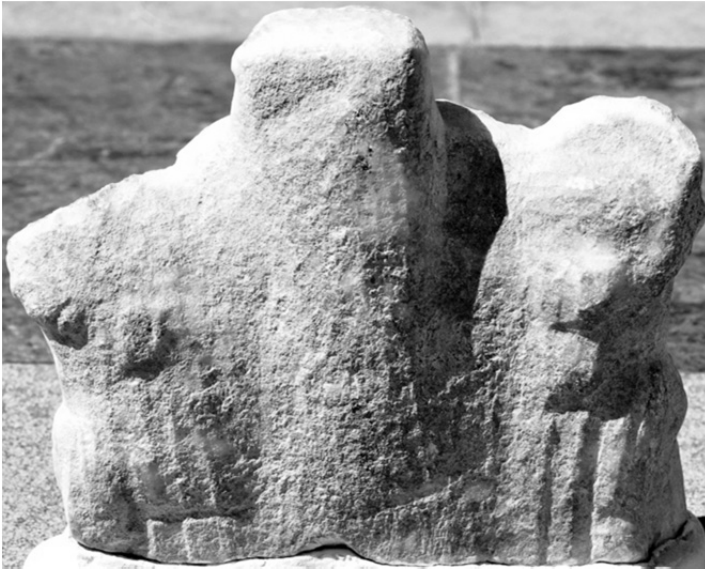
Figür 2 c