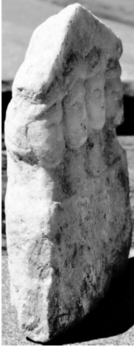
Figür 3 c