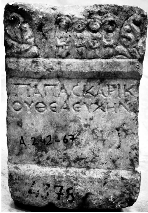
Figür 1 a