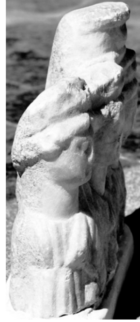
Figür 2 b