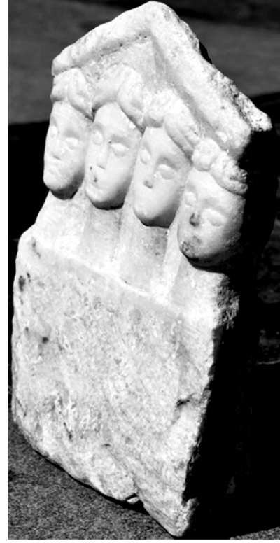
Figür 3 b