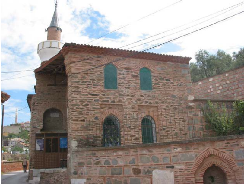
Resim 6. Dođanbey Camisi