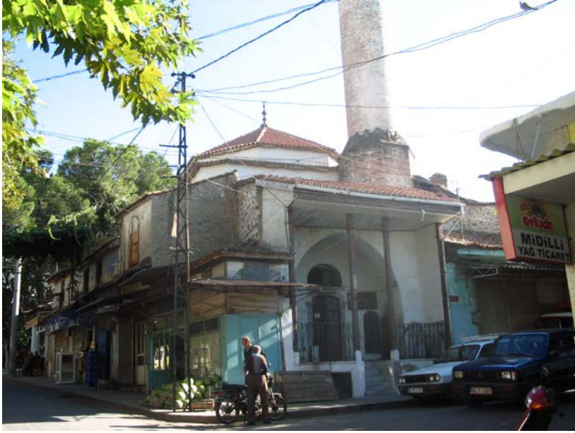
Resim 7. Gazazhane Camisi