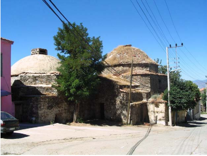
Resim 5. Yalınayak Hamamı