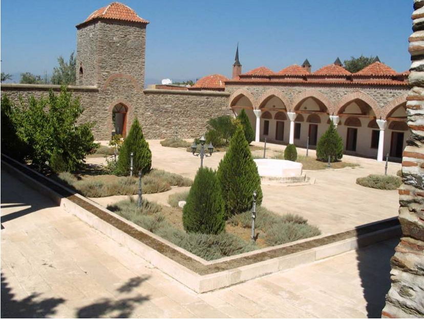
Resim 3. Yavukluođlu Külliyesi