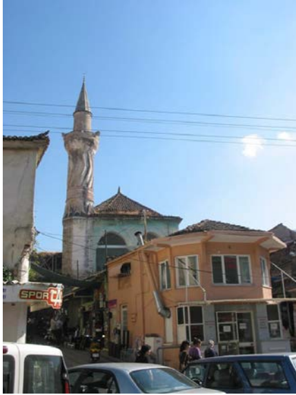
Resim 8. Hüsamettin (Hasır Pazarı) Camisi