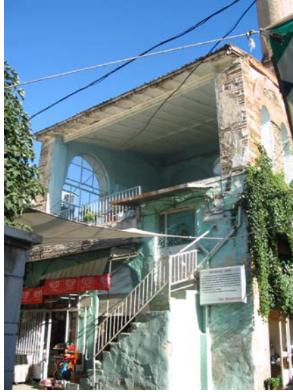
Resim 9. Tahtakale Camisi