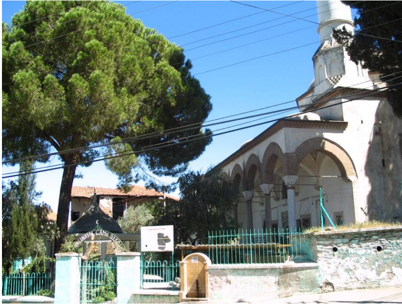
Resim 4. Yalınayak Camisi