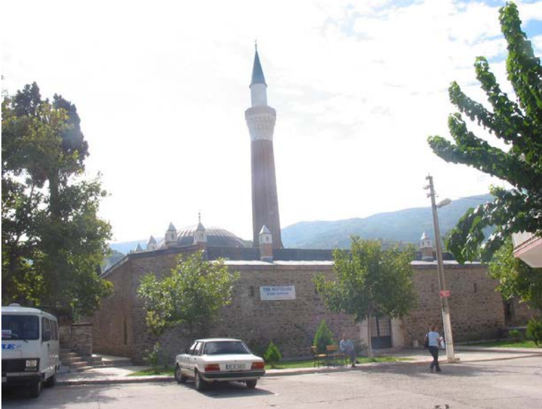
Resim 2. Kentsel Doku İçinde Karakadı Mecdettin Külliyesi