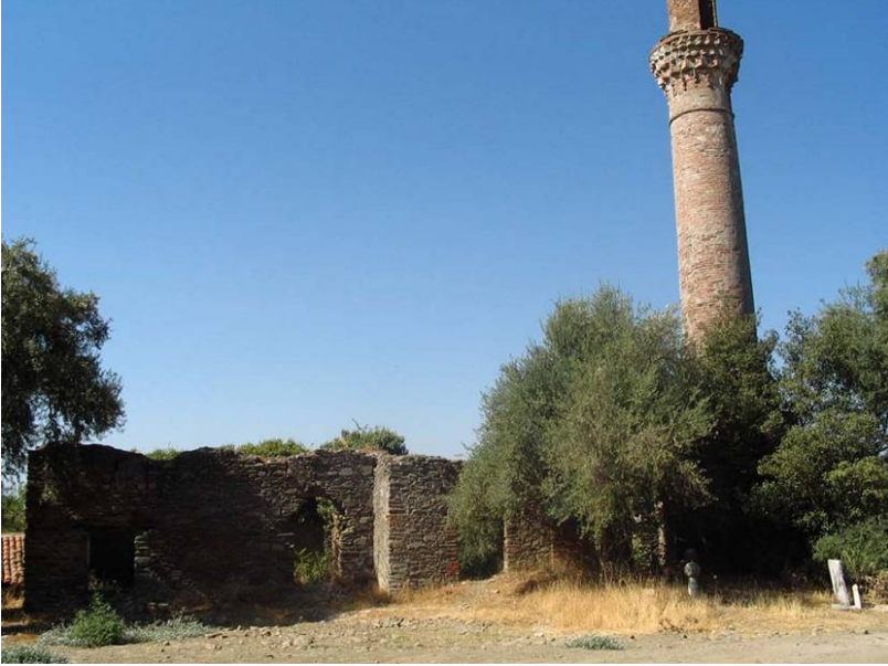
Resim 1. Hafsa Hatun Külliyesi ve Çevresi