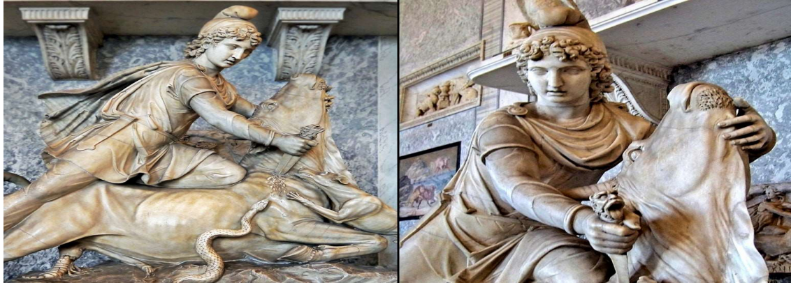
Şekil 2: Mitra'nın Bođa Öldürme Sahnesi Pio Clementino Müzesi - Vatikan Müzesi

Mitraizm ile ilgili en çok çizilmiş resim, yapılmış kabartma ve heykel, Mitra'nın bođa öldürme sahnesini gösteren tasvirdir. Bu resimde Mitra, boyun eğdirdiđi bir bođaya binmiş olarak resmedilmiştir. Mitra bu resimde bođanın başını sol eliyle arkaya doğru çekmekte ve sağ eliyle de iki omuzu arasına kılıç veya bıçak saplamaktadır. Siyah bir kuzgun Mitra'nın başı üzerinde durmakta, kanat çırpmakta ve