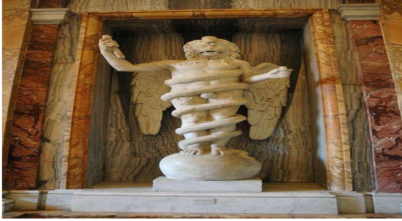
Şekil 4: Aslan Başlı İnsan. Aion, Museo Gregoriano Profano, Vatikan Müzeleri.

Mitraizm’le ilişkilendirilmiş olan karmaşık ve bu yüzden yorumlanması kolay olmayan bir diğer sembolik görsel, kimi zaman gövdesi bir yılan tarafından sarınmış aslan başlı bir çizim veya heykeldir. Bu sahneyi gösteren resimlerde genellikle dört kanatlı ve iki anahtar taşıyan bir aslan kafası betimlenmiştir. Kimi zaman bu aslan bir kürenin üzerine kurulu vaziyette de gösterilmiştir. Bu sahneyi gösteren tasvirlerin birinde aslan yerine bir insan kafası çizilmiştir. Kimi zaman bu tür resimlerde astronomik burçların konumlarının da çizildiği görülebilmektedir. Bu görselin farklı versiyonları hakkında birbiriyle çelişen veya birbirini destekleyen çok sayıda yorum yapılmıştır. Kimi alan araştırmacısına göre resimdeki aslan kafası şeytani potansiyelini sembolize ederken (İnsler, 1978, s. 27259; Zeahner, 1389, ss. 129-130) diğer alan araştırmacıları ise bunun iyilik potansiyeli olan tanrısal kudretin bir betimi olduğunu ileri sürmüştür (Howard, 1985, s. 23; Vermaseren, 1975, s. 2/446-456). Ancak bazı araştırmacılar söz konusu bu çizimin, maddeden kopuşu ve dünyadan göç etmeyi diğer bir ifadeyle ruhun kurtuluş sürecinde kat ettiği yükseliş merhalelerini betimlediğini savunmuştur (Bakırî, 1389, s. 166; Hansman, 1978, ss. 215-217; Hinnels, 1975, s. 364).