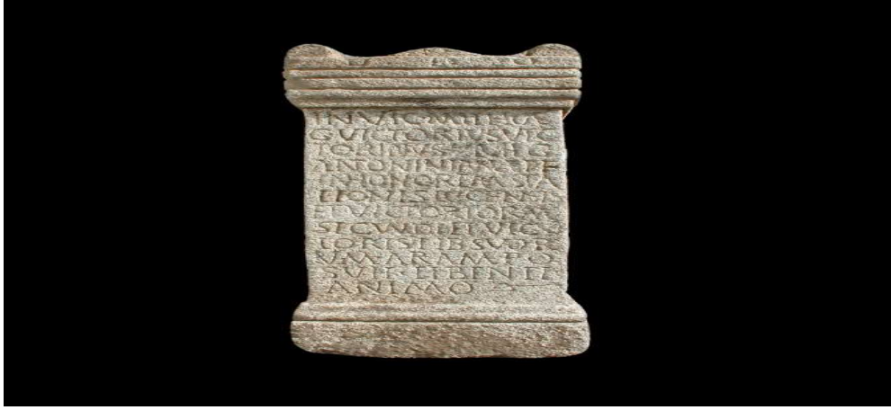
Şekil 7: 2003 yılında Lugo'daki (antik Lucus Augusti) Plaza Pio XII yakınlığında yapılan kazılarda bir ev ve üzerinde Invictus Mithras 'ın yazılı olduğu granit bir sunak