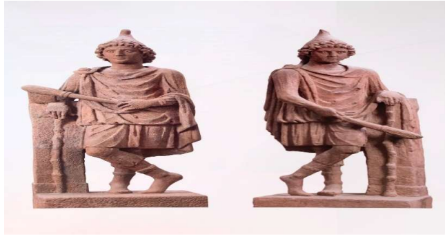
Şekil 3: Hedernheim III. Mithraeum'undan Cautes ve Kautopates - Yeni Mithraeum