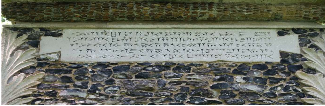
Şekil 5: Mitraik Altar yazıtı 2 - Wrest Park - Bedfordshire, İngiltere