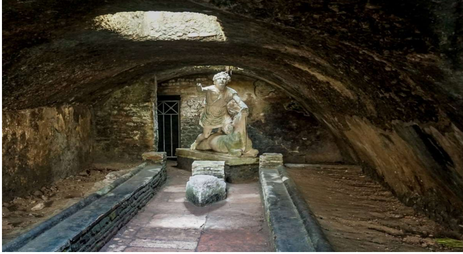
Şekil 1: Londra Mitraum: Londra'nın altında keşfedilen gizemli Roma tapınağı