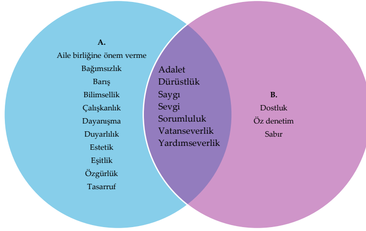
Şekil 1. SBDÖP’de yer alan (A) ve kök değerleri (B) gösteren venn diyagramı