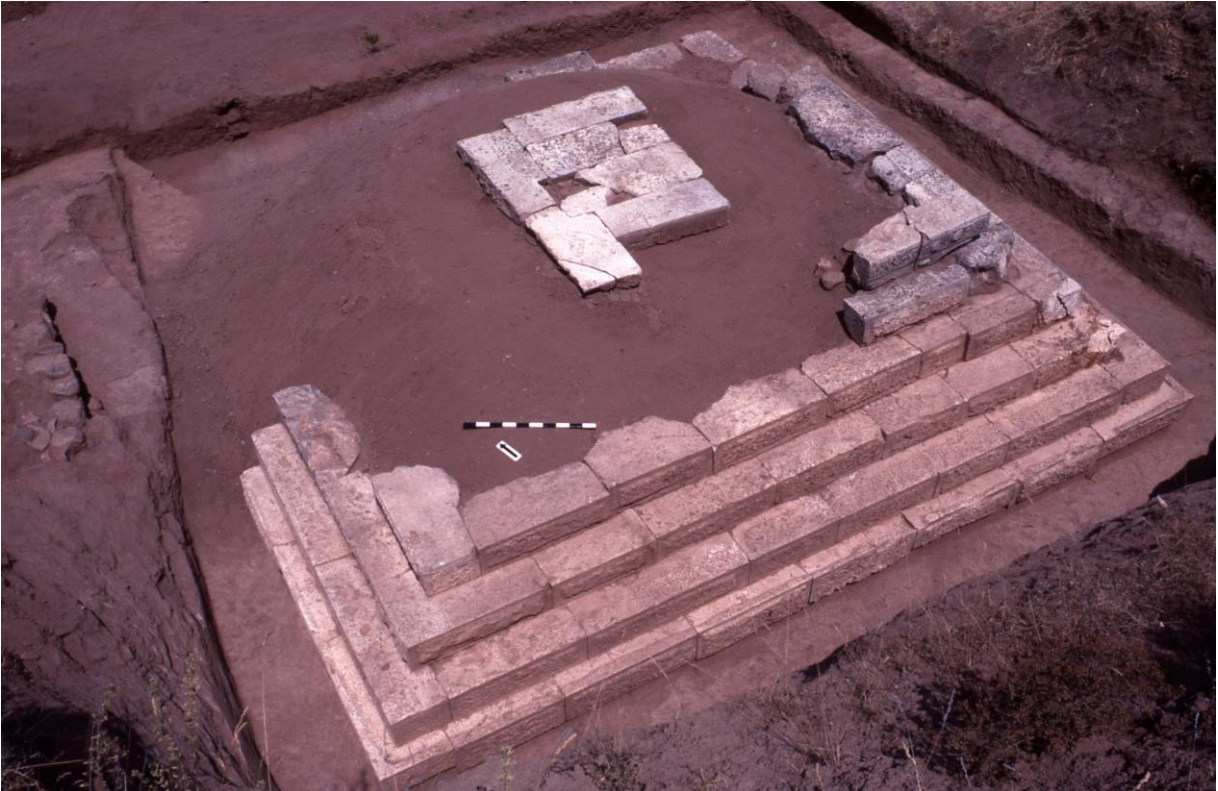
Resim 12: Sardes'teki Mezar Yapısı