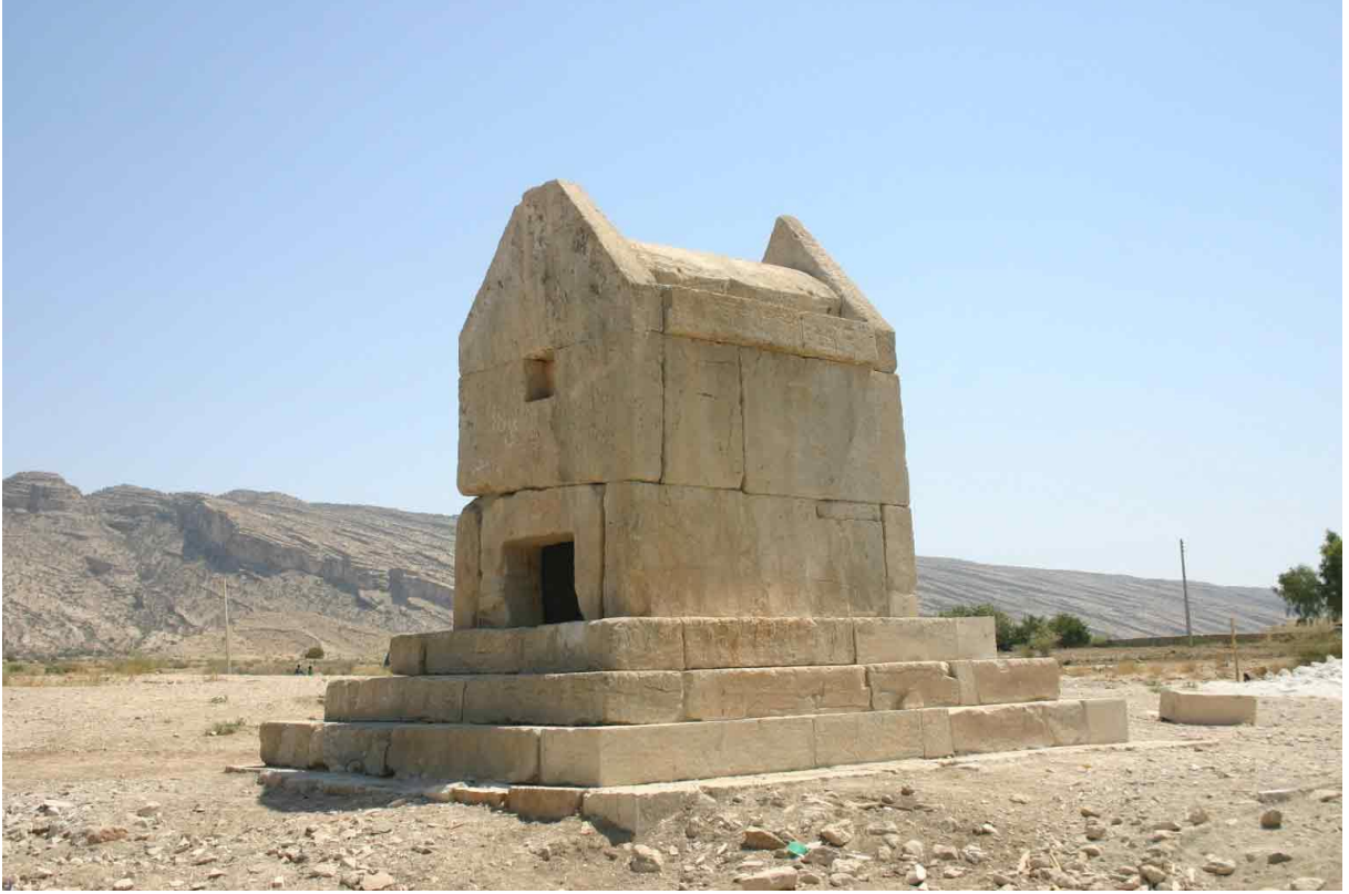
Resim 11: Bozpar'daki Mezar Yapısı