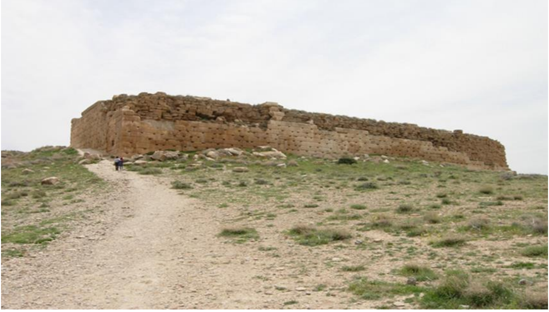
Resim 9: Saray Olduđu Düşünölen Yapının Kalıntıları