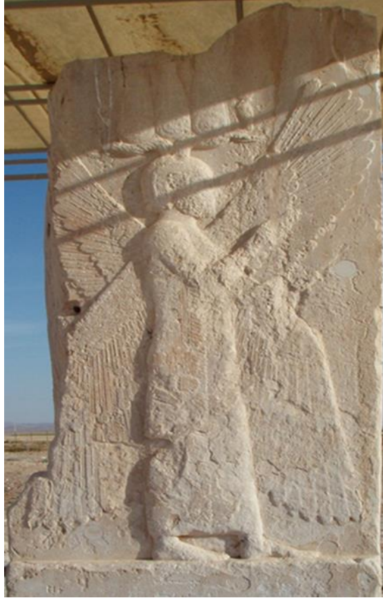
Resim 4: Kanatlı İnsan Kabartması