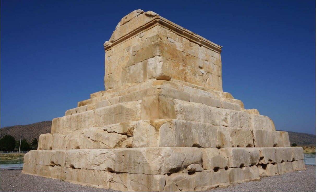
Resim 3: Büyük Kyros'un Anıt Mezarının Arka Tarafı