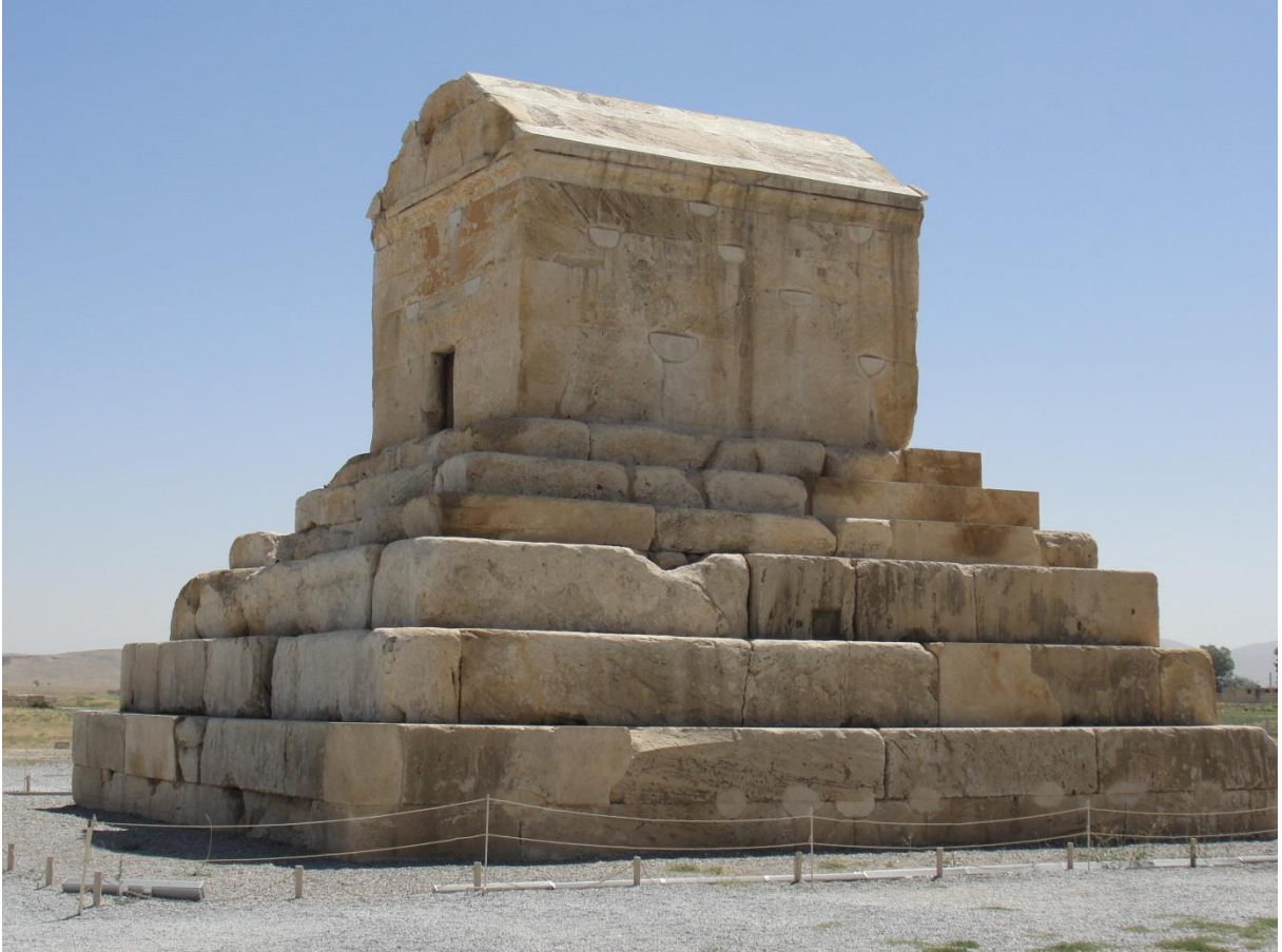
Resim 2: Büyük Kyros'un Anıt Mezarının Ön Tarafı