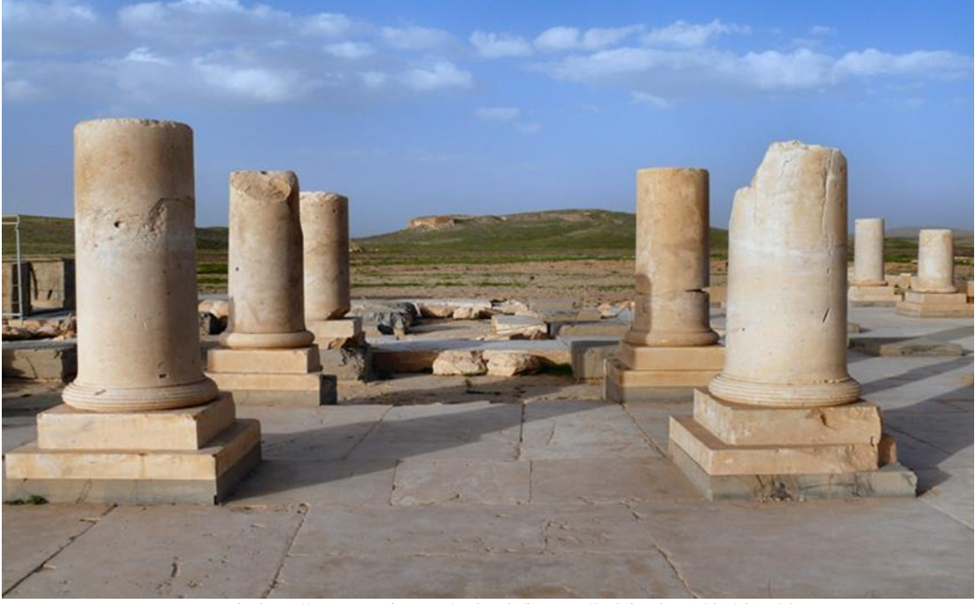
Resim 7: P Sarayı İsimli Yapının Kalıntıları