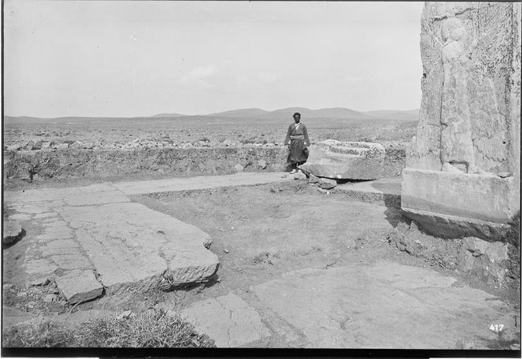
Resim 5: R Kapısı İsimli Yapının Kalıntıları