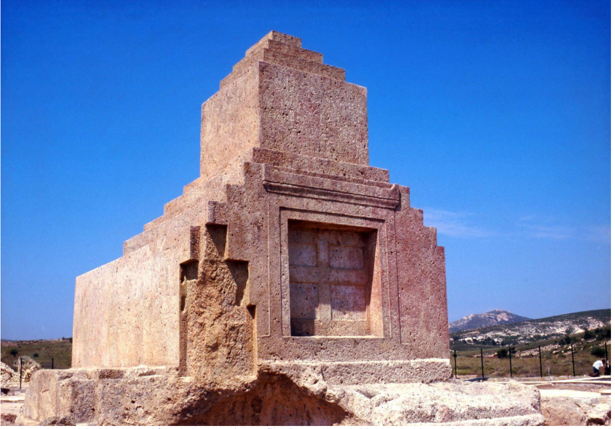
Resim 13: Foça'daki Mezar Yapısı