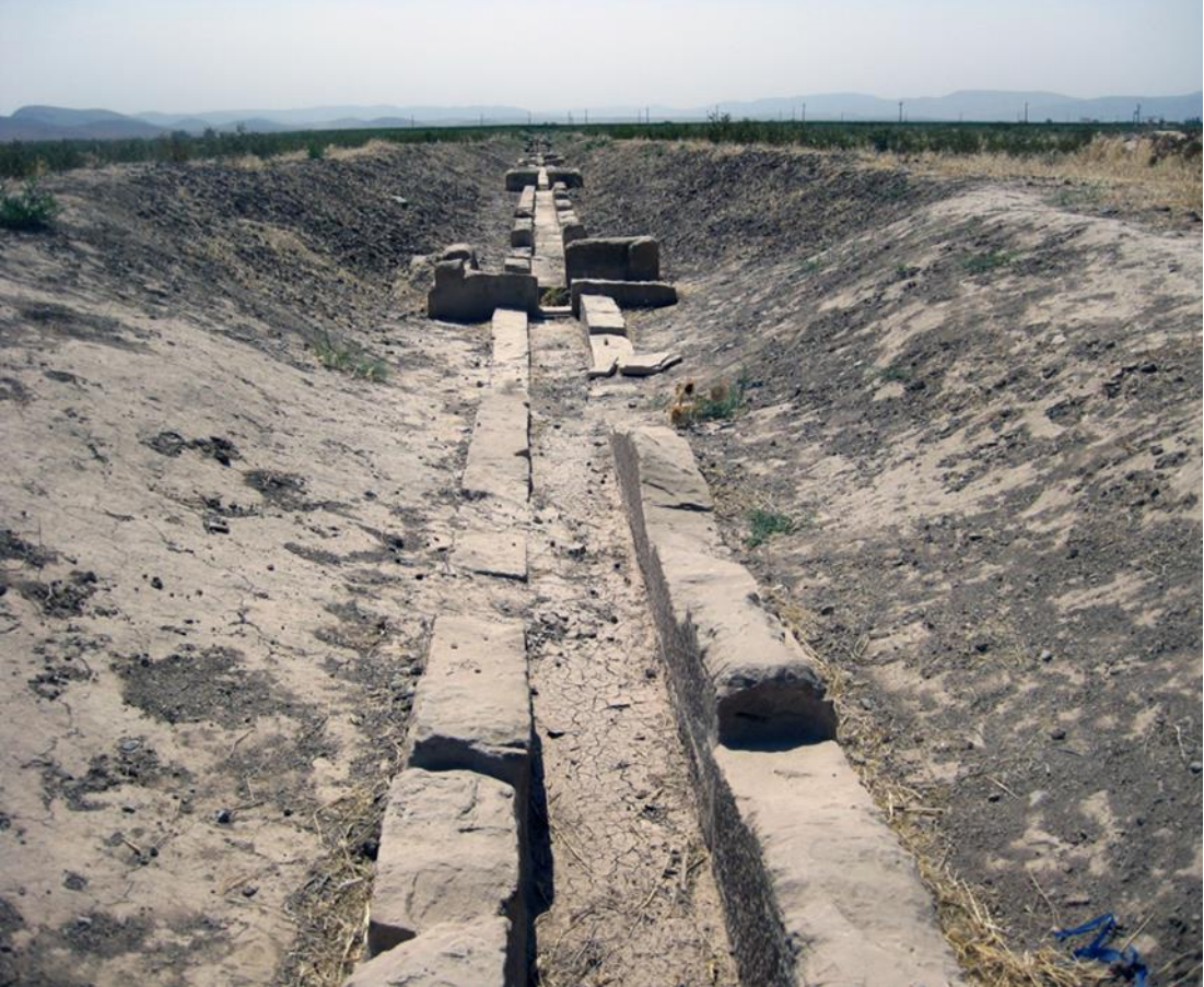
Resim 10: Pasargadai Şehrinin Bahçesini Sulamakta Kullanılan Olukların Kalıntıları