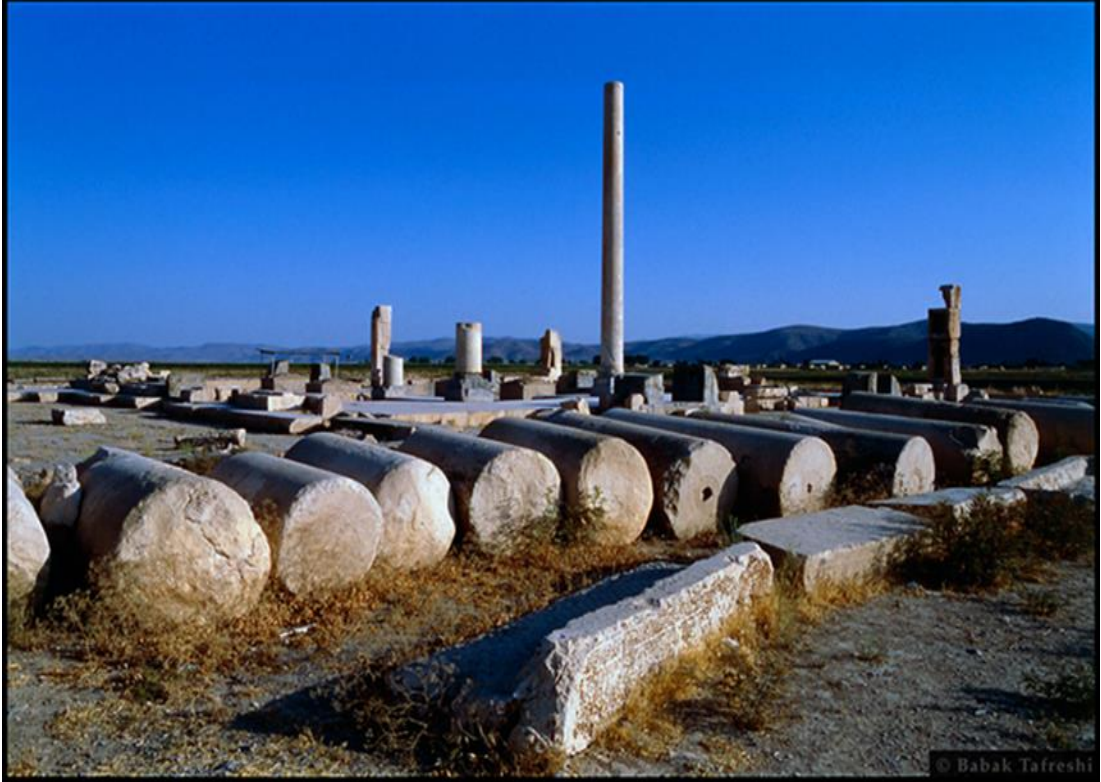
Resim 6: S Sarayı İsimli Yapının Kalıntıları