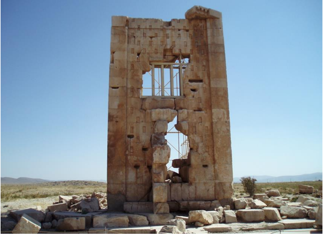
Resim 8: Ateşgâh İsimli Tapınağın Kalıntıları