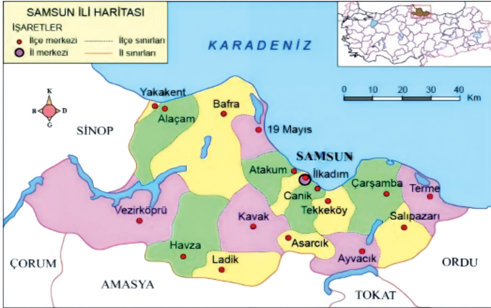
Şekil 1: Araştırma Alanı

Araştırma, Samsun ilinde faaliyet gösteren 15 kadın kooperatifini kapsamaktadır. Türkiye’nin on altıncı, Karadeniz Bölgesi’nin ise en büyük şehri konumundaki Samsun, 9.579 km 2 yüzölçümüne ve 1 milyon 377 bin nüfusa sahip olup, 17 adet ilçesi bulunmaktadır (Samsun Valiliği, 2024). Samsun İl Tarım ve Orman Müdürlüğüne bağlı kadın kooperatifi olmayıp, Samsun Ticaret İl Müdürlüğüne bağlı 15 adet kadın kooperatifi bulunmaktadır (TB, 2023; TOB, 2023). Araştırma alanı Şekil 1’de gösterilmektedir.